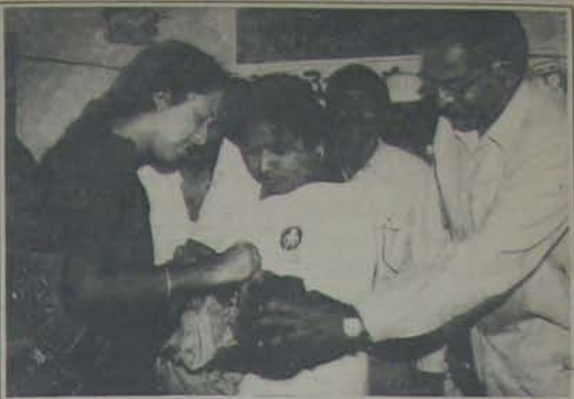
పట్టణంలోని కార్యక్రమాలకు పురస్కారాలను పొందిన విద్యార్థులకు పాఠశాల మండు చుక్కలు పంపిస్తున్న కలెక్టర్ శ్రీమతి శ్రీమతి.

భారతి అధ్యక్షులలో నేడు రెండు ఉచ్చిత పాఠశాలలు, బానియ్యి, దీర్ఘ కళాకాలం, ఇంజనీరింగ్ కళాకాలం మొదలయ్యాయి. అలాగే రెండువేల మందికి వసతి కల్పిస్తున్న మూడు హాస్టళ్లతో సంపూర్ణ దేశీయ పరిష్కారం చేసారు. స్వల్పాక్షయ సంబంధంగా నూతన భవన సమీపాన నిర్మించబడినట్లు, మరో 400 మంది వీడి విద్యార్థులకు వసతి కల్పించింది. విద్యార్థులకు అధికంగా చేయూత చేస్తుంది. చదువుకుంటూ సంతోషించే విధంగా పథకాలు రూపొందిస్తున్నట్లు చెప్పారు. దీన్ని దాకర రామచంద్రారెడ్డి మెమోరియల్ సేవా సాంస్కృతిక సంస్థ వర్తమానం చేశారు. స్వల్పాక్షయాలను పునరుద్ధరించే జవహర్ భారతి పూర్వ విద్యార్థులు చేత విదేశాలలో ఎక్కడ ఉన్నా తమ చిరునామాను కమిటీకి అందజేయమని కోరారు.