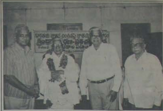
భారతీయ జాతీయ పరిశోధనా సంస్థ డైరెక్టర్లు... విద్యార్థులు ప్రాంతీయంగా పనిచేయాలని ఆయా ప్రభుత్వాలకు సూచనలు చేసింది.

నెల్లూరు ముచ్చట్లు... విద్యార్థులు ప్రాంతీయంగా పనిచేయాలని ఆయా ప్రభుత్వాలకు సూచనలు చేసింది.