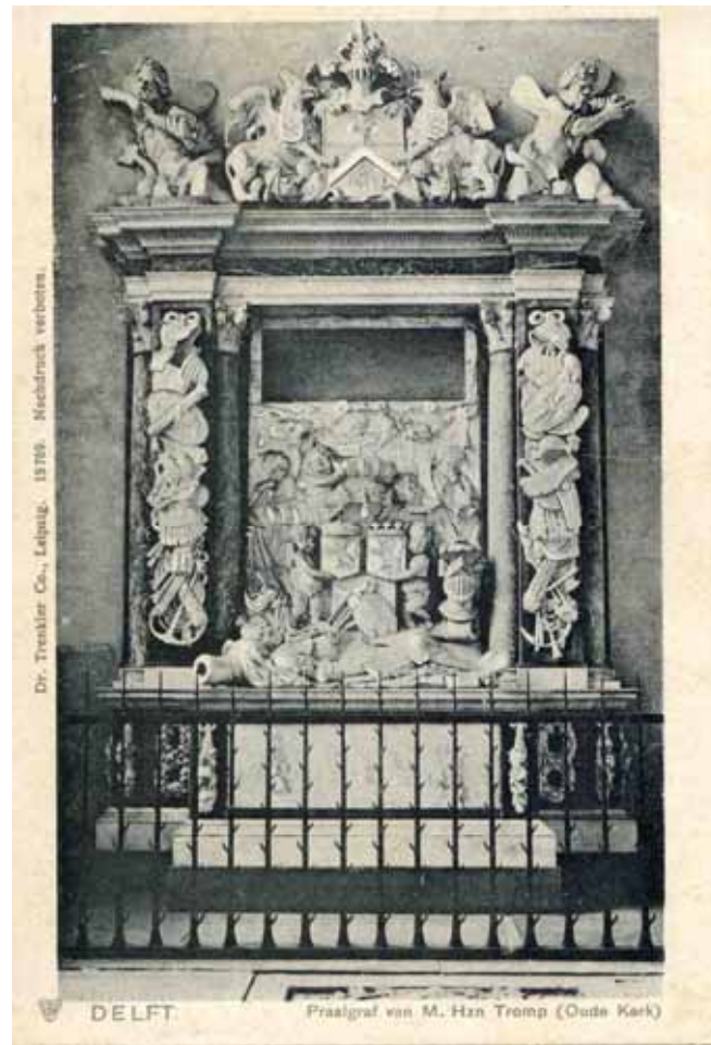
Figuur 10: Praalgraf van Tromp, Oude Kerk, Delft