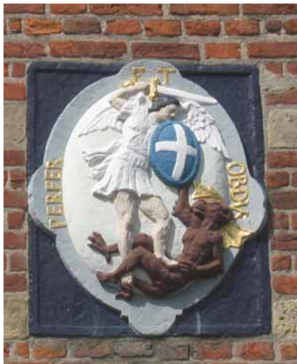
Figuur 5: Gevelsteen Maarland Nz 24

We keren terug naar Den Briel. En wat zien we in de voorgevel van het huis Maarland Nz 24? (voorheen eigendom van De With). Een gevelsteen die een opvallende gelijkenis heeft met de bovengenoemde medaille. Het randschrift luidt: ‘Perfer et Obdur’, of wel ‘Verdraag en Volhard’, een spreuk die past bij een militair (Figuur 5).