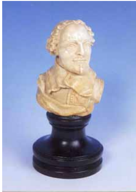
Figuur 9: Ivoren borstbeeld van Tromp, Hist.Museum Den Briel

De vloten voeren vier keer door elkaar en al in het eerste treffen sneuvelde Tromp (Figuur 9). De admiraalsvlag werd echter niet gestreken om de vijand geen overwinningsgevoel te geven.