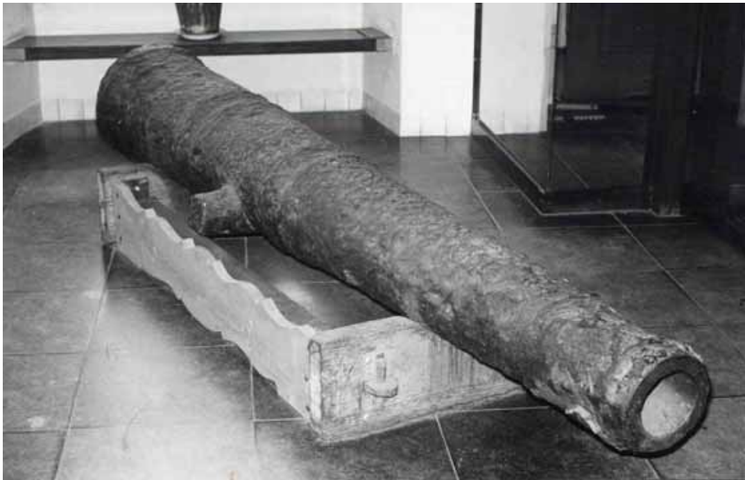
Figuur 13: Het kanon van de Brederode, geschonken door Denemarken, in de hal van het stadhuis

In 1910 is een opgevist kanon van de Brederode door de Deense regering geschonken aan Nederland. Via een verzoek van B. en W. van Brielle aan koningin Wilhelmina is het in bruikleen afgestaan aan de gemeente en geplaatst in de hal van het stadhuis (Figuur 13).