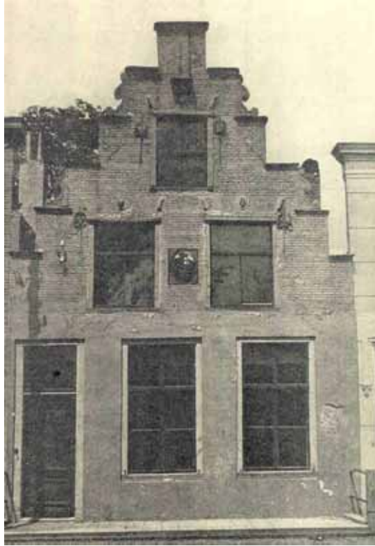
Figuur 2: Maarland Nz 24, vermoedelijk woonhuis van De With voor restauratie