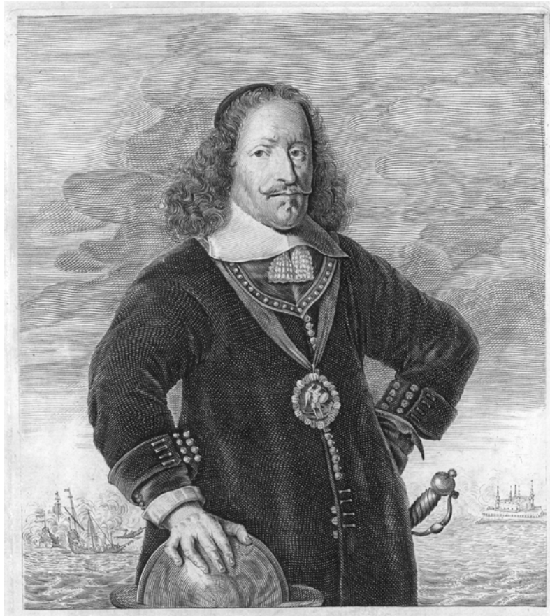
Figuur 1: Witte de With als viceadmiraal

In 1626 is De With thuisgevaren als viceadmiraal van een Oostindische retourvloot met een kostbare lading (Figuur 1).