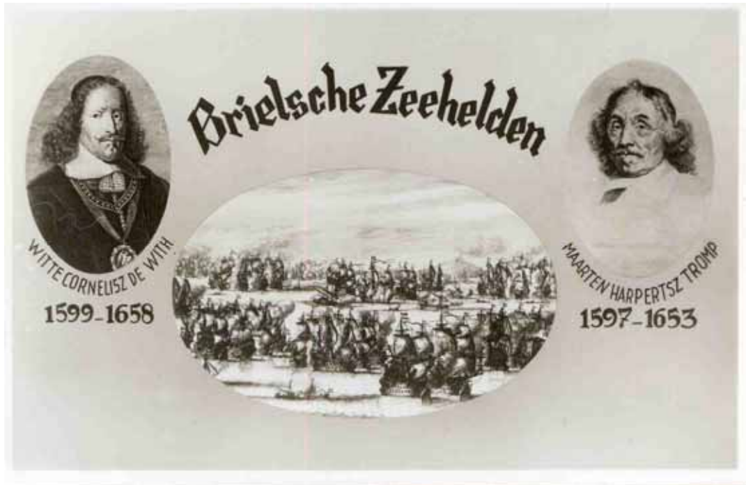
Figuur 7: Brielse zeehelden, maar niet altijd door dezelfde deur

Maar de Engelsen bleven de Nederlandse schepen lastig vallen met als gevolg dat de Eerste Engelse oorlog uitbrak. Als eerste kreeg Tromp de volle laag maar Michiel de Ruyter versloeg de Engelsen bij Plymouth (Engelse zuidkust). Witte de With leed een nederlaag voor de Theemsmond, mede omdat veel kapiteins in zijn eskader het niet langer aandurfdten met de Engelsen strijd te leveren (Figuur 7).