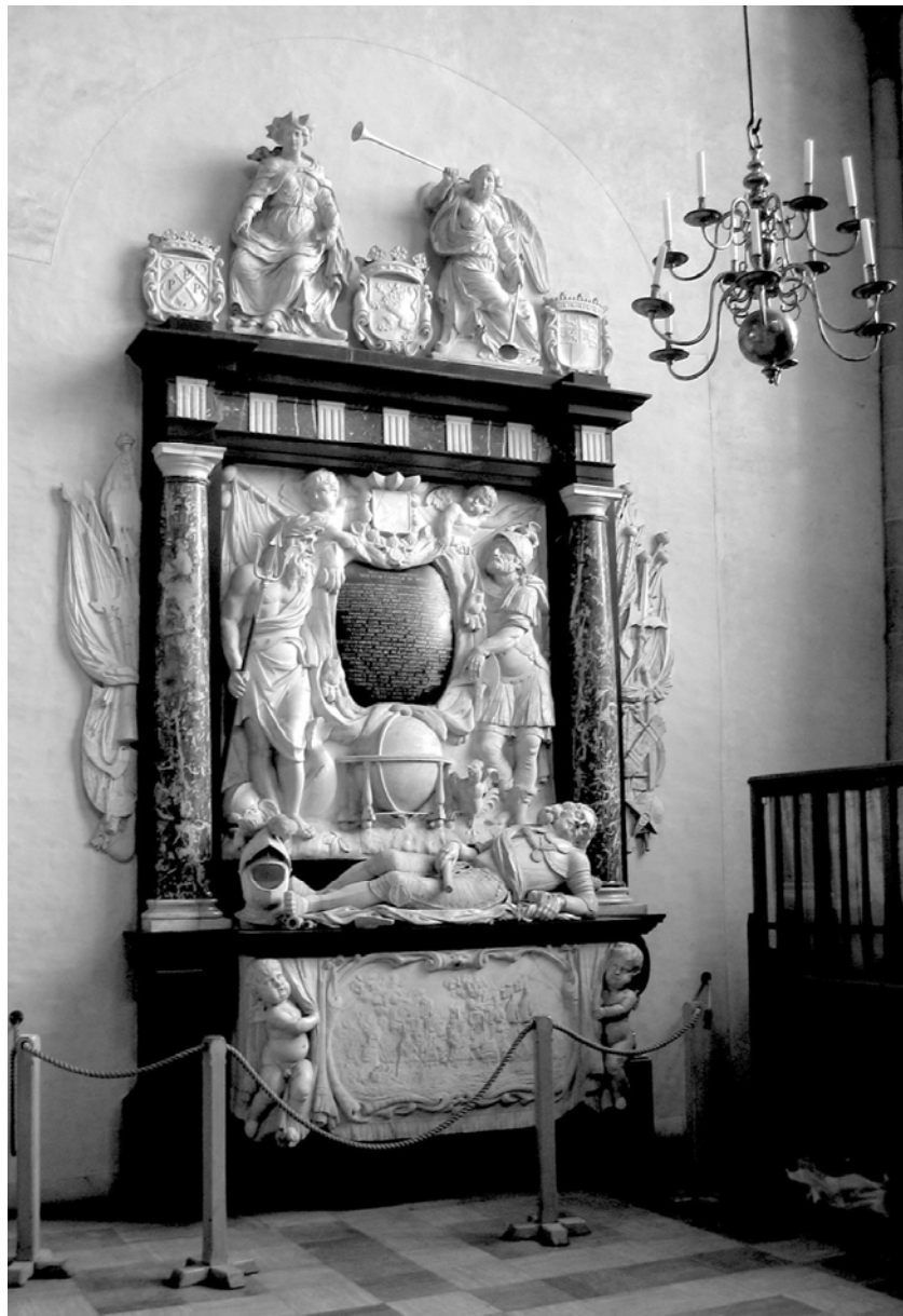
Figuur 12: Praalgraf van Witte de With in de Laurenskerk, Rotterdam