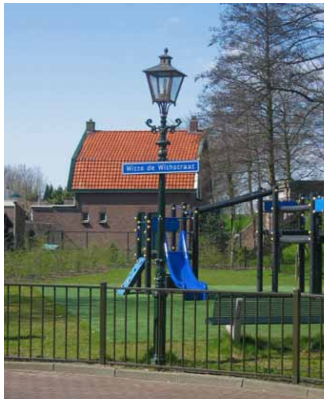
Figuur 6: Straatnaambord van de (door vriend en vijand) gevreesde viceadmiraal Witte de With tegen de achtergrond van een kinderspeelplaatsje