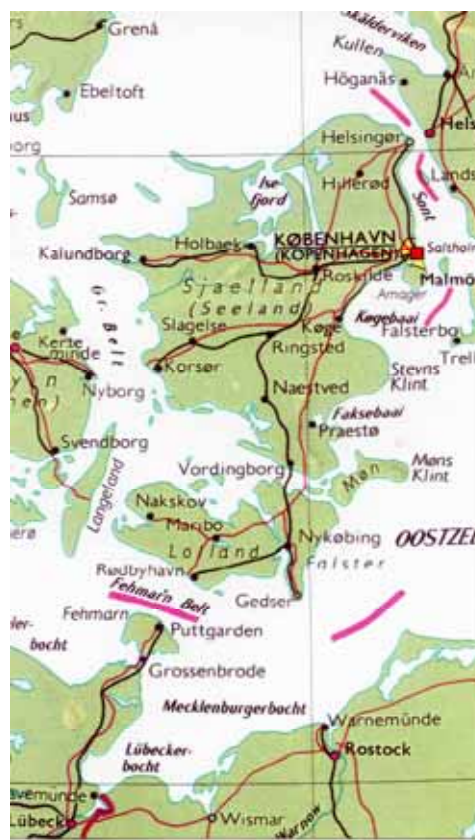
Figuur 11: De Sont en omgeving. Bij Helsingør vond de zeeslag plaats

Ondanks het feit dat het de gewoonte was dat de admiraal van de ene vloot het andere admiraalsschip zou aanvallen ging viceadmiraal De With daartoe over. De Zweed trok zich terug en liep aan de grond. De With voer daarop naar het schip van de Zweedse viceadmiraal.