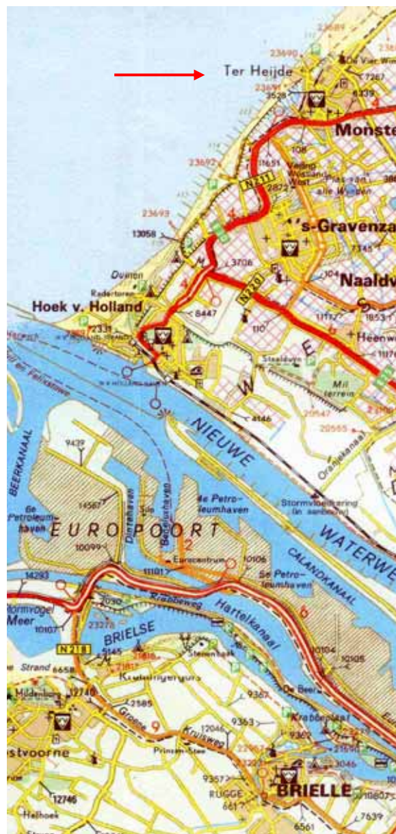
Figuur 8: Ligging Ter Heijde ten opzichte van Den Briel

Direct na het gesprek begon de strijd met de Engelsen. De vloten waren inmiddels naar het zuiden afgezakt en op zondag 10 augustus 1653 kwam het tot een treffen bij het Zuidhollandse plaatsje Ter Heijde, zo'n 15 km van Tromps geboorteplaats Den Briel (Figuur 8).