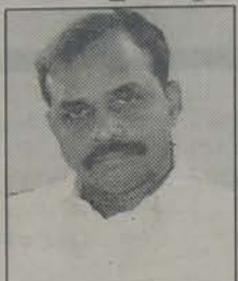
విషయం, పార్టీ అధికారంలోకి వచ్చినా, రాజకీయంగా రాజశేఖరరెడ్డి కష్టం మాత్రం

కాంగ్రెస్ పార్టీ గెలుస్తుందా, గెట్టి అధికారంలోకి వస్తుందా అప్పటి వేరే