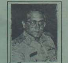
అయినప్పటికీ, వీసిన అధ్యక్షుడు దాక్షర్ వైఎస్ రాజశేఖరరెడ్డి తండ్రి రాజారెడ్డిని ఆయన ప్రత్యర్థులు కర్కశంగా చంప

పుష్టించిన దుర్బలసలలోనూ పోలింగు యంత్రాంగం వచ్చిగా, వచ్చి వెళ్ళాడు. దళం వలె వ్యవహరించడం అసహాయక