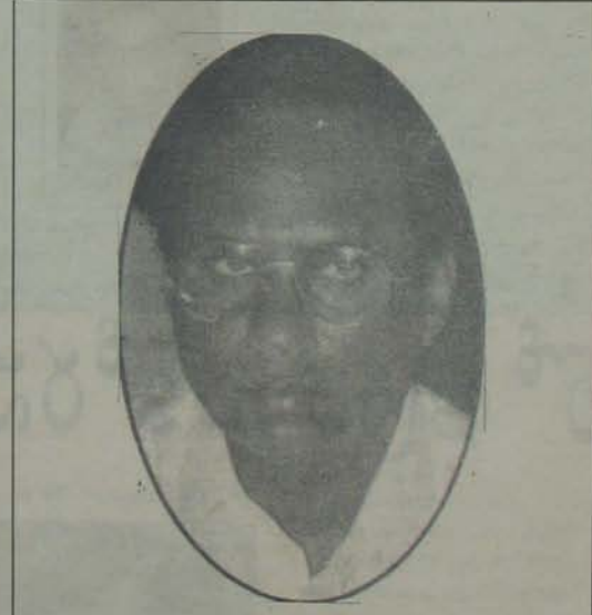
వివి సంస్కృతికి బీజం - కోడెల వుళ్లమే!

కోడెల సైన్యం మామూలుగా ఏదీలేని తిరుగుతుంటే జనం కణచికిరి పరుగులు పెట్టడం రిచాల, వారికి ఎదురు చెప్పుడం కాదు - ఎదురుపడనే రిచాల సమస్యలని పక్కటి పక్కటి రుద్దే సుతీచ్యు డాక్టర్