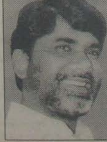
కన్పిస్తున్నది. గత వారం, వది రోజులుగా ఆయన ముఖంలో కల లేదు. మేకపోతు

గాంధీయం నటిస్తున్నప్పటికీ, ఆయనలోనూ అనుమానం, అందరినీ వున్నాయన్న వార్త వం ముఖకవలలోనే కన్పిస్తే పోతున్నది. ఒకవేళ ఆ అనుమానం పరిణామం ఎదుర్కోక తప్పని సరి పరిస్థితి వచ్చి తమవరి దర్శనమిటి అన్న వచ్చి ప్రారంభమైంది తెలుగుదేశం కేంద్రంలో! అందుకు అందరూ కలిసి ఏకగ్రీవంగా నూరిస్తున్న పరిస్థితి కేంద్రంలో ఆశ్రయం పొందడం. ఢిల్లీలో బీజెపి సర్కారు ఏర్పడడం భయమని నూనెలంతు తున్నందు వల్ల చంద్రబాబు కేంద్రమంత్రి పదవిలో చేరడం మంచిదని భావిస్తున్నాడు. ఎన్నికలు ముగిసేదాకా కాబట్టి మైసూరిలోనే తమను తిరగించే