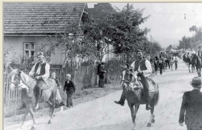
Selská jízda před 2. světovou válkou