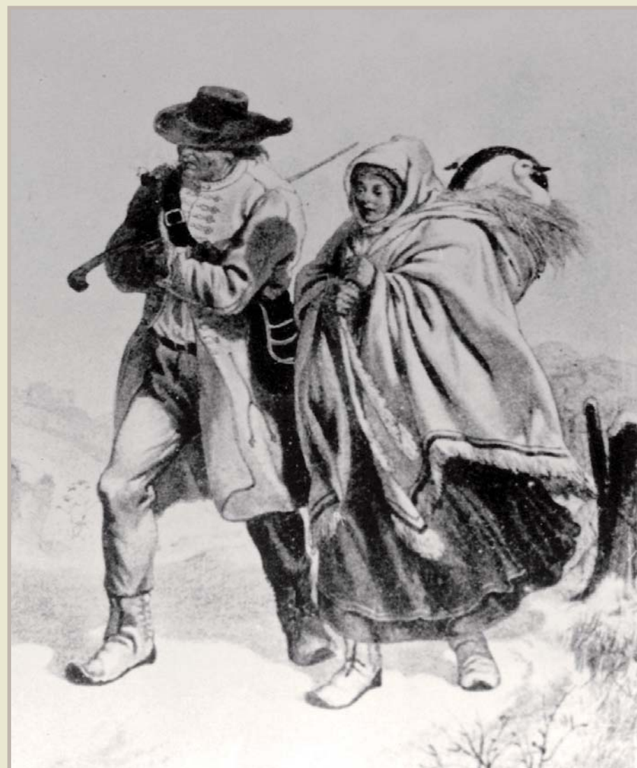
Valaši od Lukova – podle barevné litografie Františka Kalivody, přibližně z roku 1859