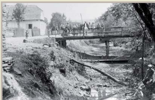
Neregulované koryto Všeminky a most přes ni, směrem na Círón, 1919