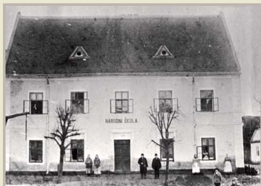
Národní škola, 1903