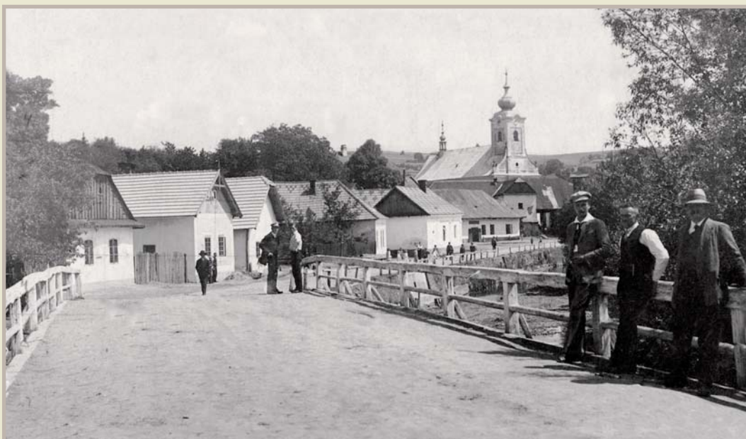
Starý most přes Dřevnici, 1925