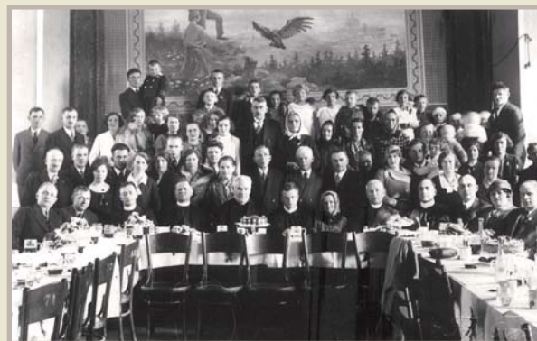
V pozadí část orelské opony