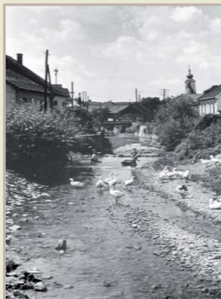
Koryto Všeminky pohled od Hovězákového