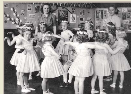
Mateřská škola představení Pampelišky, 1950

Dne 1. dubna 1948 byla výnosem Zemské školské rady v Brně založena mateřská škola. Navštěvovalo ji tehdy 36 dětí a umístěna byla v budově národní a střední školy ve Slušovicích. Již od září téhož roku byla nouzově přemístěna do částečně upravených prostor budovy bývalého hostince na náměstí. Pro velký zájem vznikla později druhá třída, počet dětí se pohyboval kolem 60.