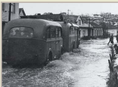
Povodeň v ul. Dlouhá, v noci z 8. na 9. srpna 1960. Rozvodnila se Dřevnice a způsobila značné škody.