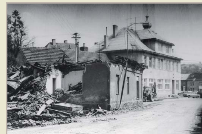
Bourání, Vojtkovo (bývalá cukrárna), začátkem osmdesátých let 20. století