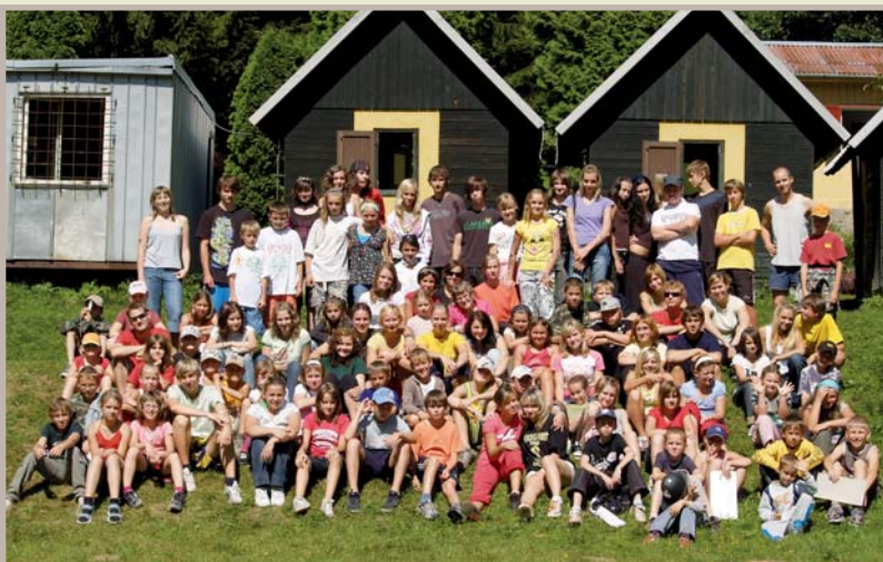
Dětský tanečně-sportovní tábor ASPV v Pohořelicích v roce 2008

• Asociace Sportu pro Všechny Slušovice (ASPV) – ASPV se zabývá tělovýchovnou a kulturní činností. V minulosti ji známe také pod názvem ZRTV (Základní a Rekreační Tělesná Výchova). V roce 2002 se větší skupina členů oddělila od Sportovních klubů a založila oddíly pod hlavičkou ASPV. Asociace Sportu pro Všechny pořádá pravidelná cvičení v hale (rodiče a děti, aerobik, gymnastika, míčové hry, florbal, taneční kroužek Kontrast dance, cvičení žen). Organizuje také akce pro veřejnost, např. tábor Pohořelice, přehlídku činnosti, pochod Za Velikonočním vajíčkem, víkend pro ženy. V současnosti má ASPV přibližně 160 registrovaných členů.