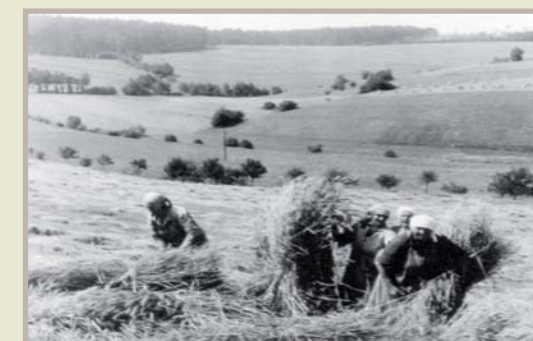
Sena období vzniku JZD