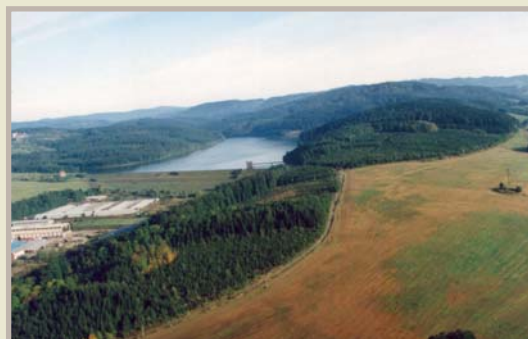
Letecký pohled na přehradu, současný