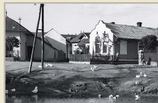
Prostranství před domem rodiny Daňkovy 1935