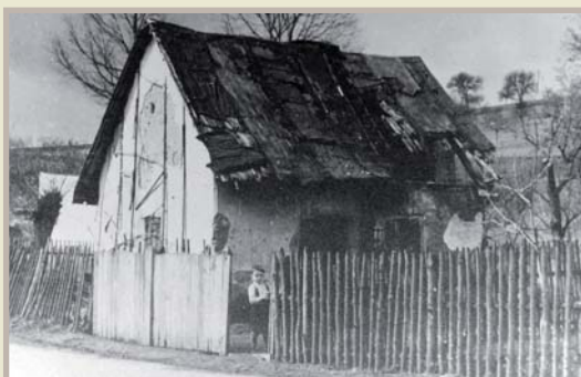
Gargulákova kovárna a vařírna povidel – stála těsně u mostu přes Všeminku