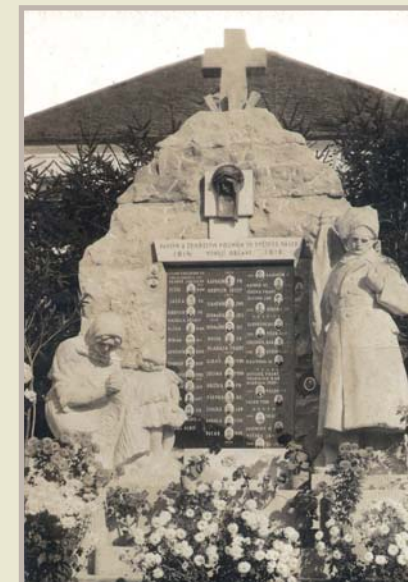
Pomník na památku padlých v 1. světové válce