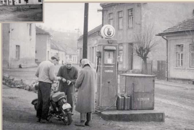
Náměstí s benzinovou čerpací stanicí, stála zde do sedmdesátých let 20. století