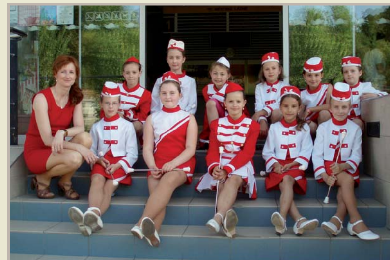
Mažoretky v roce 2011

Další kluby a instituce, jejichž historie či současnost je zmíněna v textu: