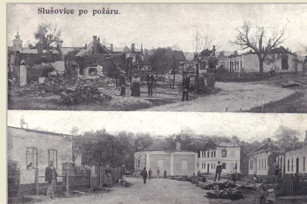
Poblednice, Slušovice po požáru, 1909

Ještě se lidé nedostali z dluhů a nebyly dostaveny nové domy, když přišla 1. světová válka.