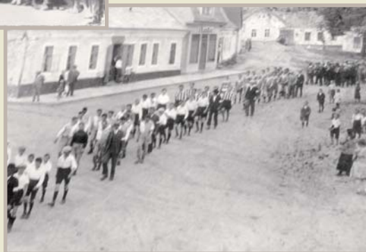
První sportovní průvod, 1927