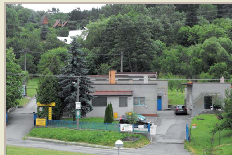
Zahrádkářský areál v roce 2011