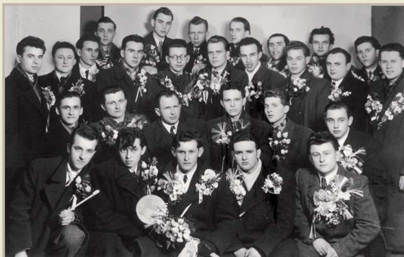
Odvedenci, třicátá léta 20. století