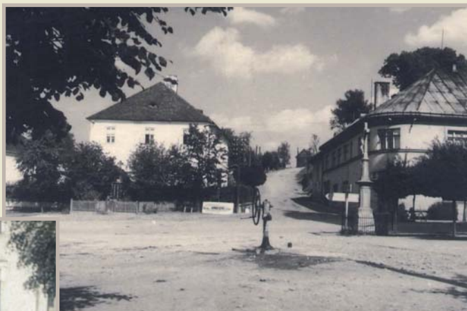
Momentka u studny