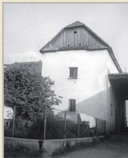
Výřez z pohlednice, náměstí u panského domu