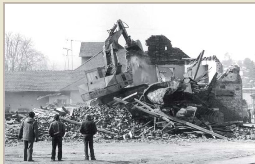
Bourání domu kvůli nové komunikaci, začátkem osmdesátých let 20. století