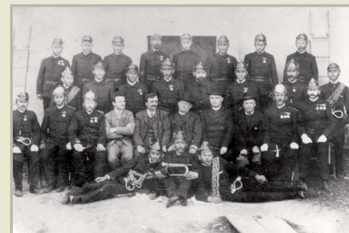
Hasičský sbor snad třicátá léta 20. století