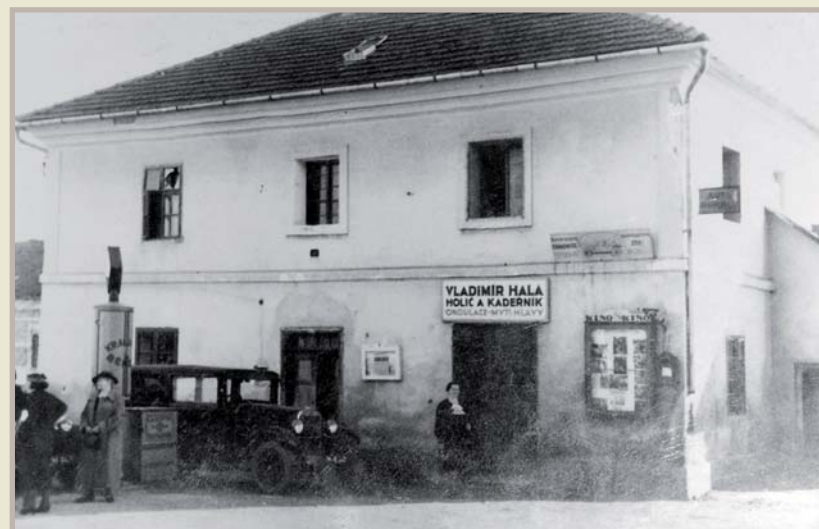
Stará radnice, zbourána roku 1937