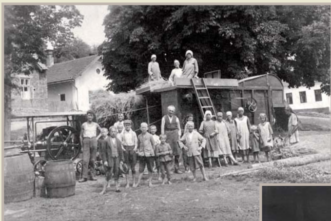
Mláčení obilí na náměstí 1926