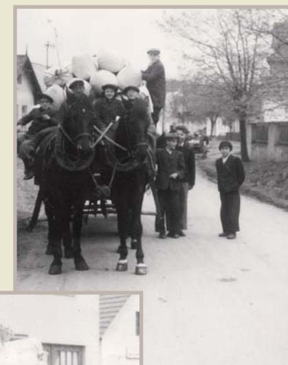
Měštanka - odvoz léčivých bylin do Lípy, 1943