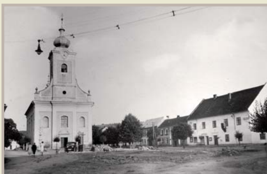
Náměstí s kostelem, 1903