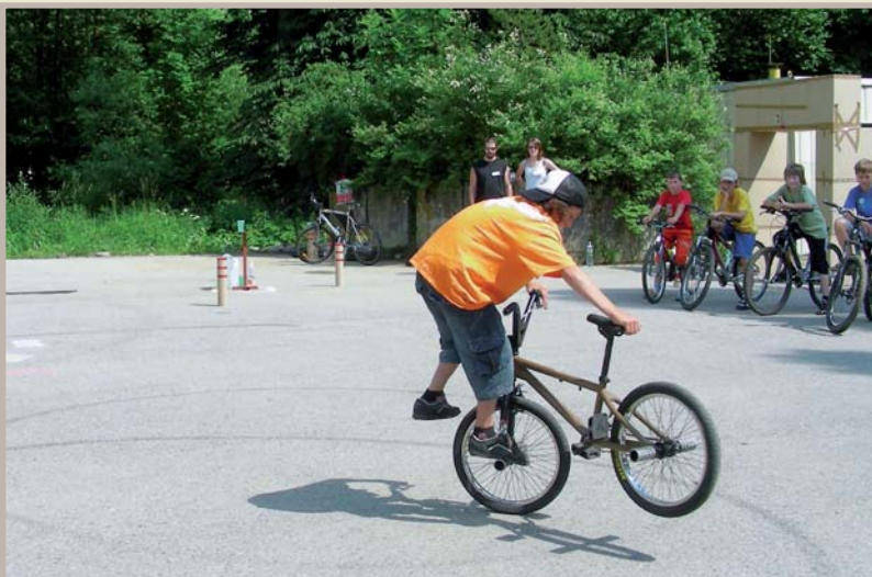
Sportovní kluby - Jízda zručnosti 2007

• Sportovní kluby Slušovice - vznikly ze Sokola Slušovice. Jejich hlavní náplní vždy byla a je sportovní a kulturní činnost. V současné době mají asi 50 členů. V jejich majetku je chata na Příschlopě, kterou již několik desetiletí využívají občané Slušovic a okolí ke své rekreaci.