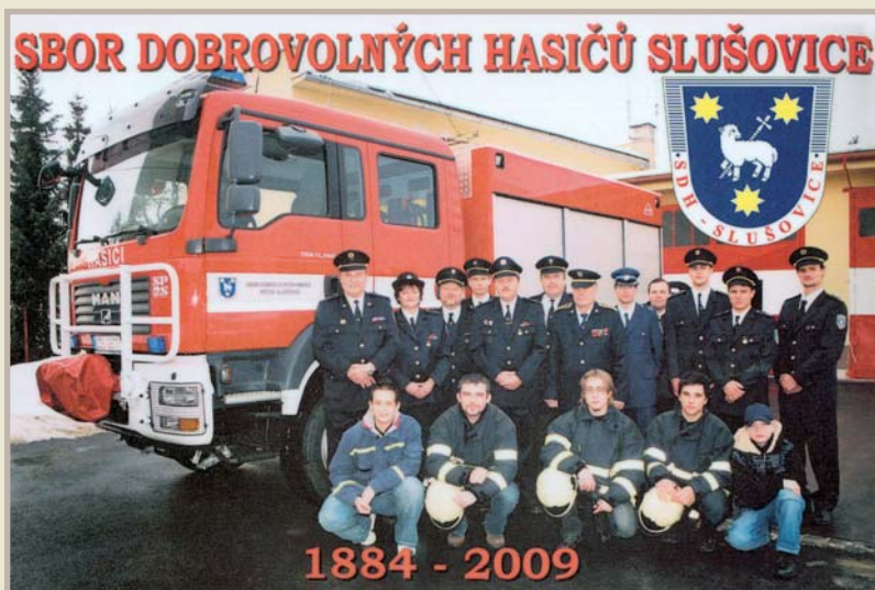
SDH v roce 2009

Při SDH funguje kroužek mladých hasičů, v němž je 18 dětí do 15 let. Na různých hasičských soutěžích reprezentují SDH 3 družstva: družstvo dětí (18 členů), žen (9 členek) a mužů (12 členů).