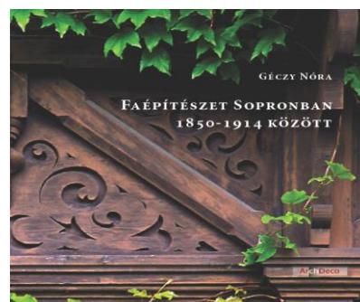
Amit a 19. század soproni faépítészetéről tudni érdemes - Könyvrecenzió