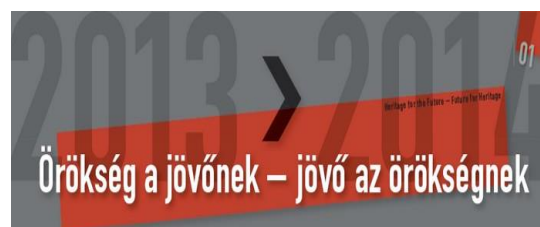
Félidejéhez ért a konferenciasorozat