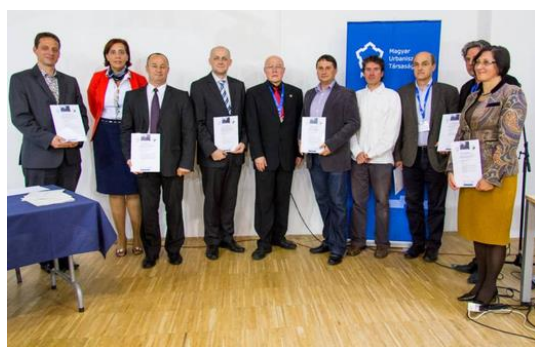
Köztérmeújítási Nívódíj - 2014