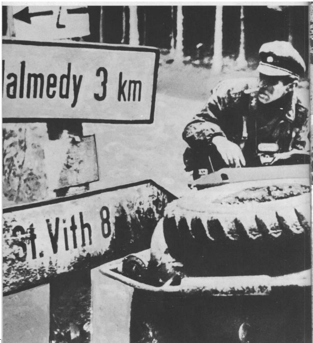
17 SS-Obersturmbannführer Jochen Peiper, einer der tapfersten und hochdekorierten Panzerkommandeure des Zweiten Weltkrieges, an der verhängnisvollen Straßenkreuzung vor Malmedy, von der nach dem Kriege die ganze Welt sprechen sollte. Peiper, der die Panzerspitze der Ardennenoffensive befehligte, und 42 Generale, Offiziere und Männer der Waffen-SS wurden später im sog. Malmedy-Prozeß in Dachau wegen der Erschießung von 71 amerikanischen »Gefangenen« zum Tode verurteilt, später aber zu lebenslänglich begnadigt und bald darauf freigelassen. Die in Schwäbisch Hall unter Foltern abgepreßten »Geständnisse« erwiesen sich als falsch, wie es eine Begründung des Urteils niemals gegeben hat. Sicher ist, daß gegen Jochen Peiper weder aus seiner Befehlsgebung, noch aus seinem Verhalten im Kampf irgendwelche Vorwürfe abgeleitet werden konnten. Peiper, der nach dem Krieg in Frankreich lebte, wurde am 14. 7. 1976, dem französischen Nationalfeiertag, von unbe-