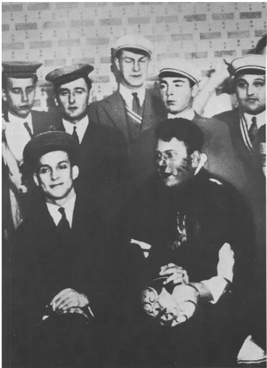
[ In seiner Wiener Studentenzeit gehörte Skorzeny der schlagenden Verbindung Markomania an. Das Bild zeigt ihn vorn rechts nach einer schweren Blessur im Jahr 1928, die ihm später den Namen »Das Narbengesicht« eintrug.