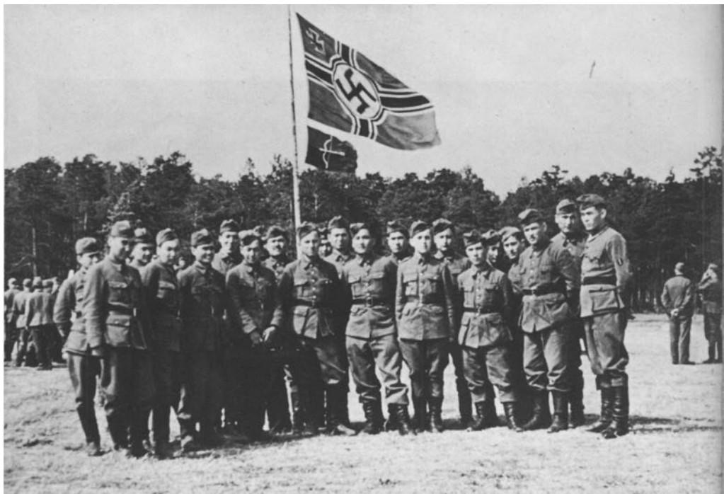
2 Eine Rarität: Angehörige der Turkestanischen Legion in Legionowo bei Warschau. Sie nahmen teil am Unternehmen Zepplin im Juli 1942.