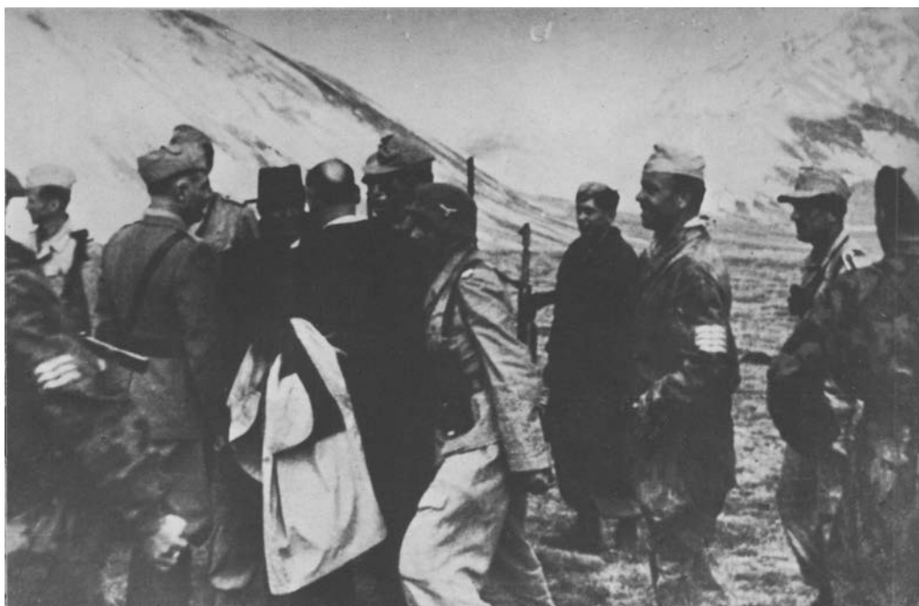
6 12. September 1943: Mussolini mit seinen Befreibern, dem italienischen General Soleti und seinem Bewadler General Cueli.