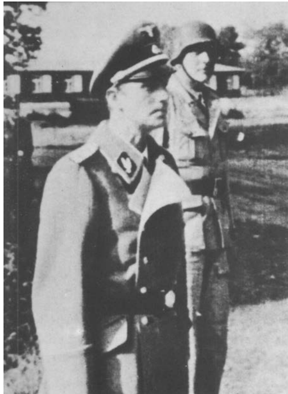
11 Eine seltene Aufnahme: Der Chef des Reichssicherheitshauptamtes, Walter Schellenberg, und Otto Skorzeny (mit Stahlhelm) im Jahr 1944.