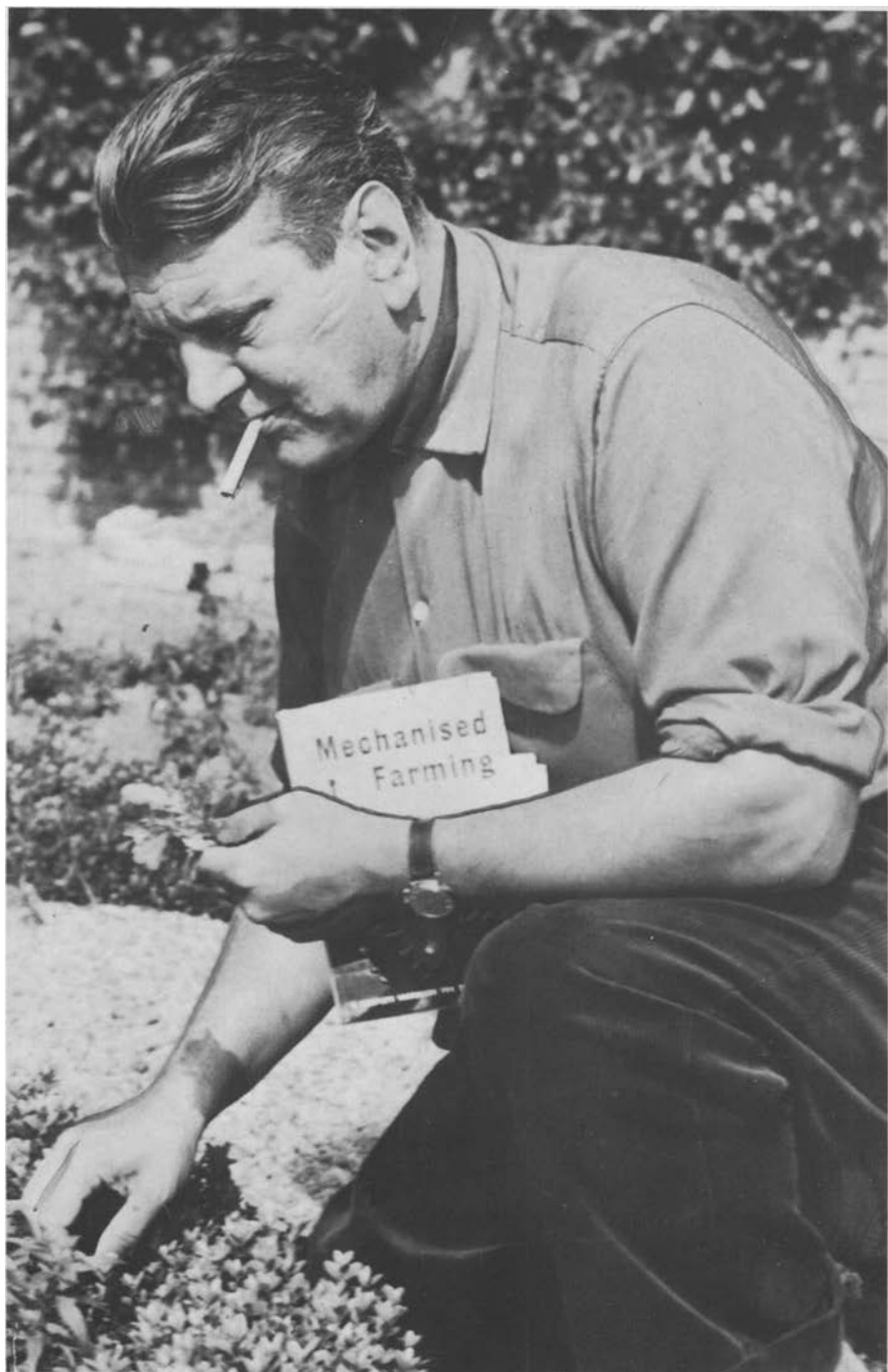
25 Wieder Zivilist, erwarb Otto Skorzeny (49) ein Gut in Curragh/Irland, wo er die eine Hälfte des Jahres Schafzucht betrieb. Die andere Hälfte verbrachte er jeweils in Madrid, wo er als Diplomingenieur u. a. auch Stahlgeschäften nachging.