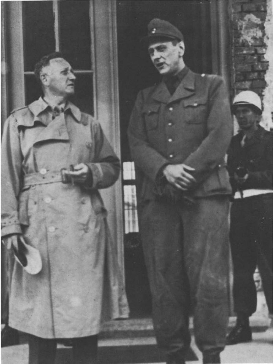
20 Otto Skorzeny als Gefangener.