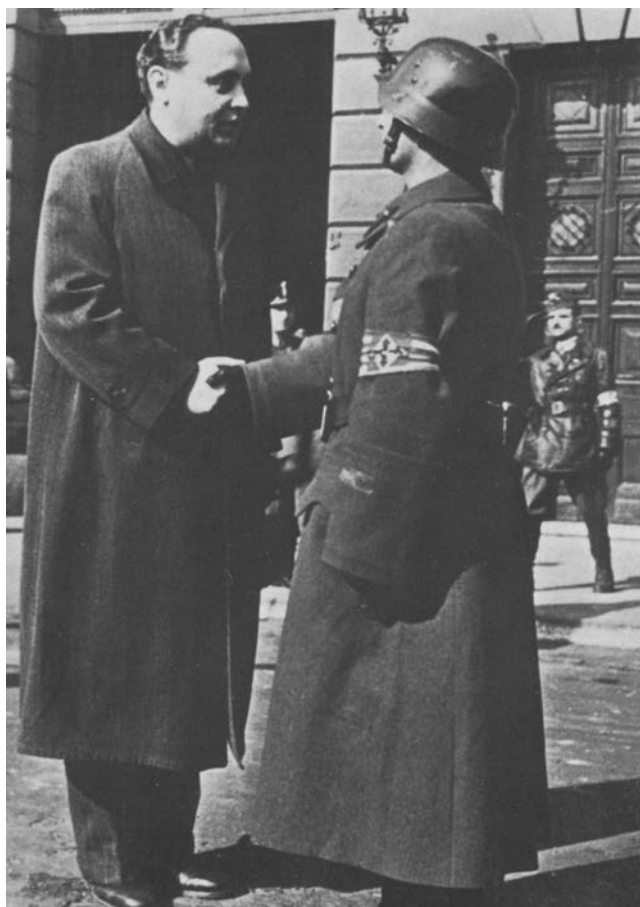
io Franz Szalasi, Führer der ungarischen faschistischen »Pfeilkreuzler«, der nach dem Sturz Horthys im November 1944 die Regierungsgeschäfte in Budapest übernahm. Hier bei der Begrüßung der Wache vor dem ungarischen Kriegsministerium in Budapest am 4. 11. 1944. Otto Skorzeny hatte auch damals seine Hand im Spiel.