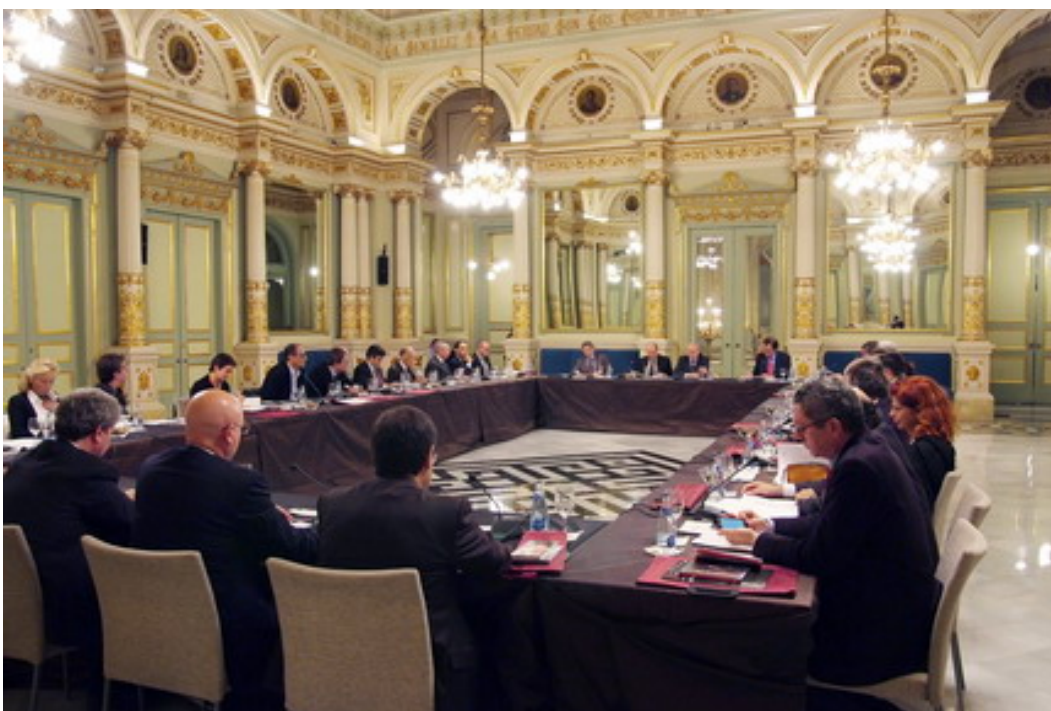
Membres dels patronats del Teatro Real i del Gran Teatre del Liceu.

L'objectiu del conveni és fixar les condicions generals de col·laboració per al desenvolupament de sis projectes dins l'àmbit operístic.