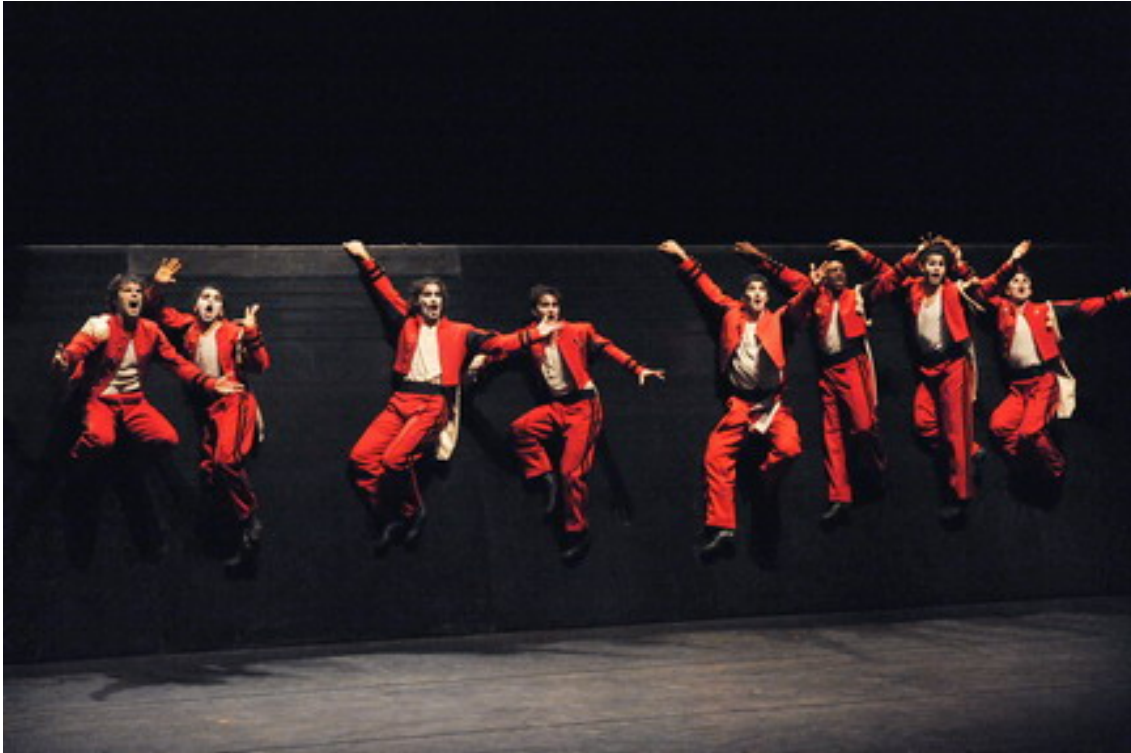
Perpetuum . Balé Da Cidade de São Paulo.