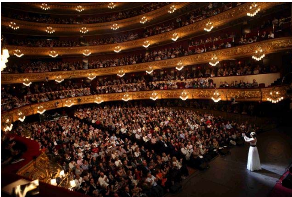
Pasi3n Vega al Liceu

Primeres figures del Ballet Rus. Ambar Ballet. 4 i 5 d'agost de 2009. Sala principal.