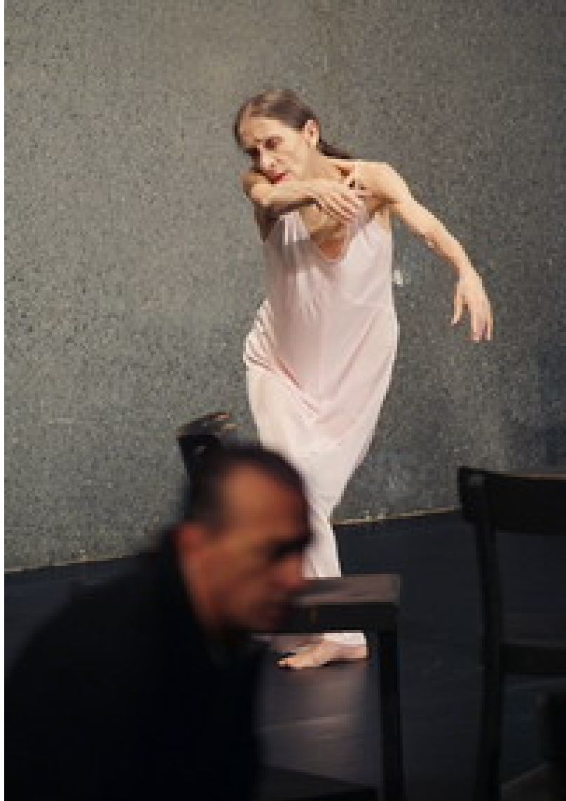
Café Müller . Tanztheater Wuppertal-Pina Bausch.