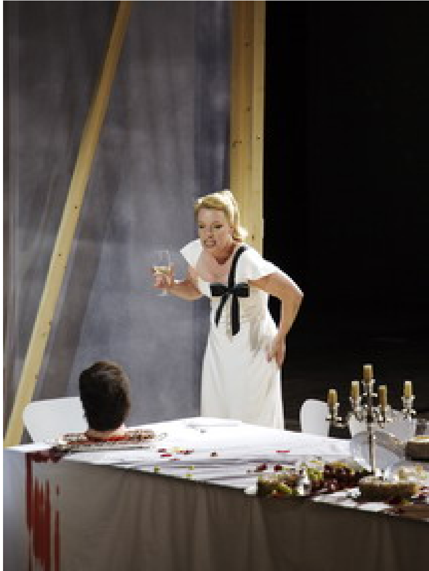
Salome. Nina Stemme (Salome).