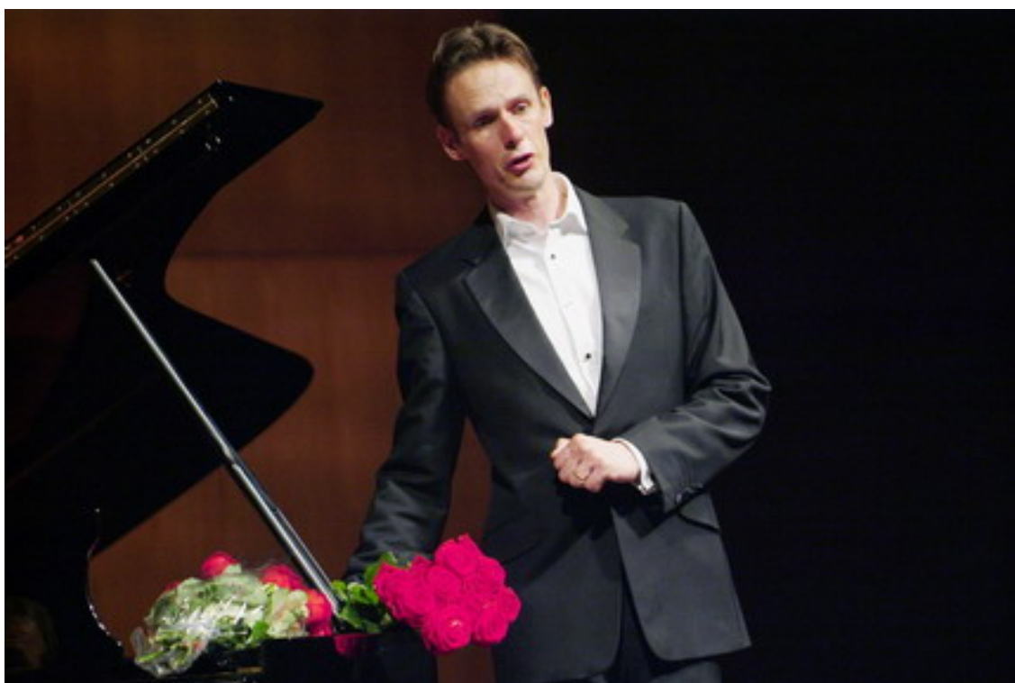
Ian Bostridge.

Franz Schubert: Im Frühling; Über Wildemann; Der liebliche Stern; Tiefes Leid; Auf der Brück; Aus Heliopolis I; Aus Heliopolis II; Abendbilder; Ins stille Land; Totengräbers Heimweh; Auf der Riesenkoppe; Sei mir gegrüßt; Daß sie hier gewesen; Die Forelle; Des Fischers Liebesglück; Fischerweise; Atyls; Nachtviolen; Geheimnis; Waldesnacht (Im Walde)