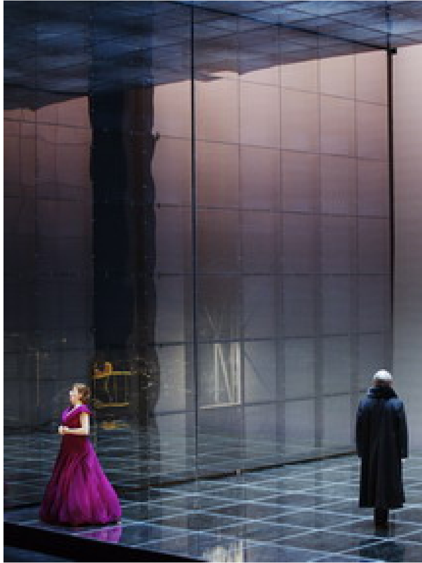
Simon Boccanegra. Krassimira Stoyanova (Maria Boccanegra), Anthony Michaels-Moore (Simon Boccanegra).