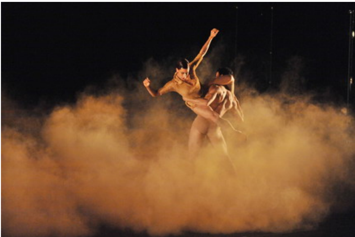
Canela fina . Balé Da Cidade de São Paulo.