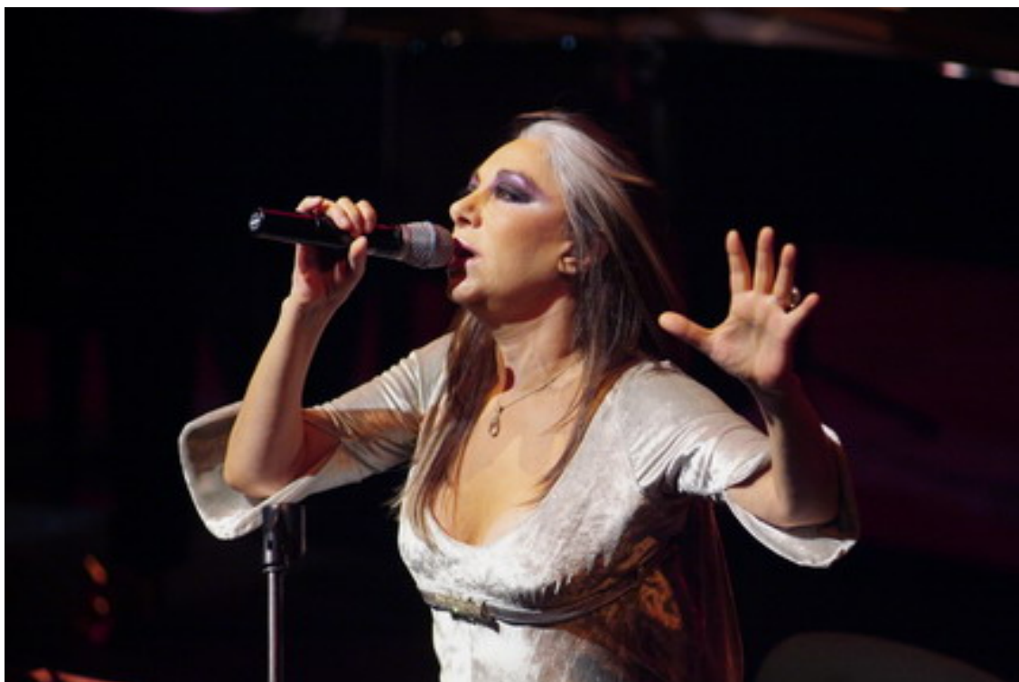
Adriana Varela.