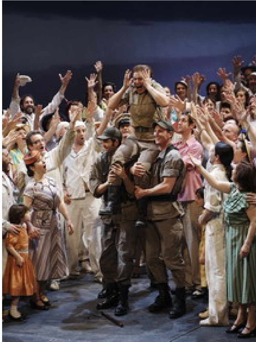
Fidelio. Karita Mattila (Leonore).