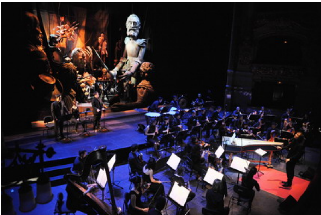
El retablo de Maese Pedro.