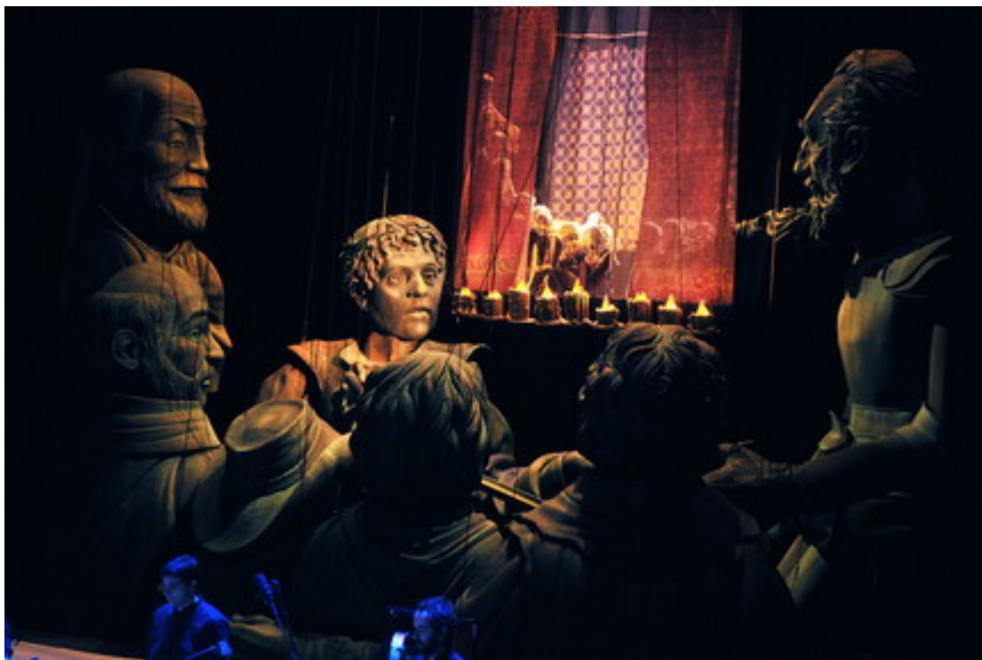
El retablo de Maese Pedro