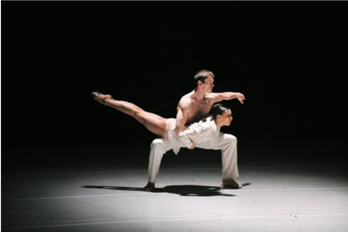
Silent Screen. Nederlands Dans Theater I.