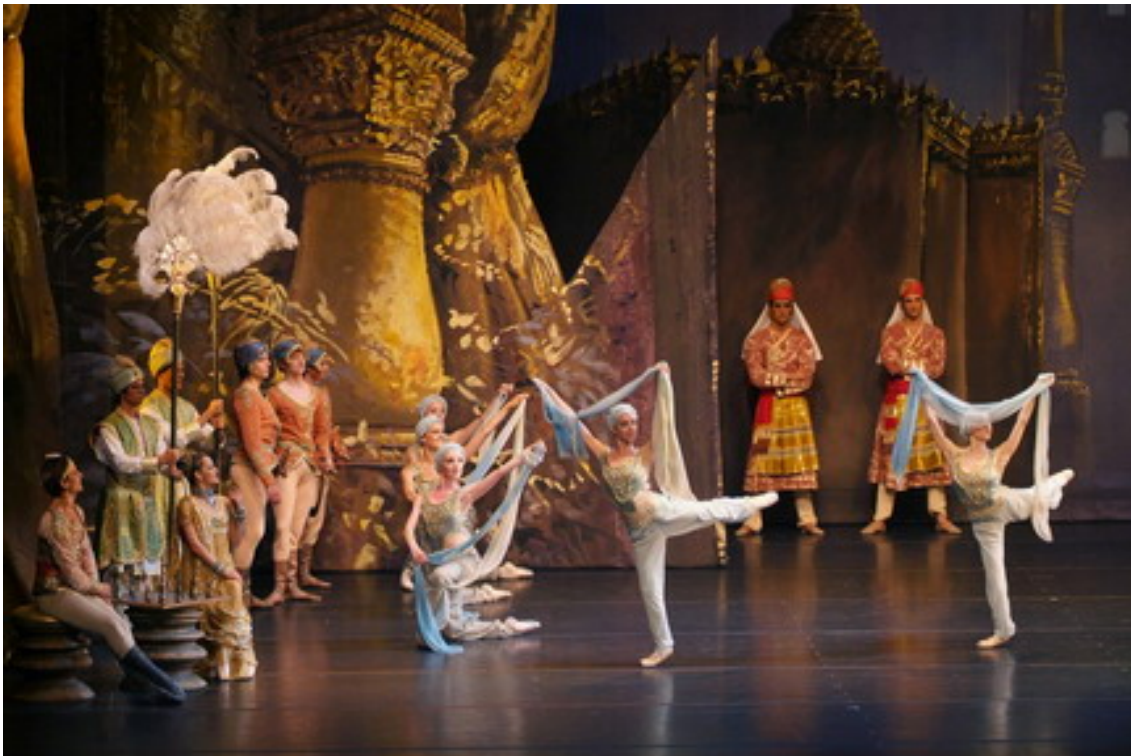
La Bayadère . Corella Ballet Castilla y León.