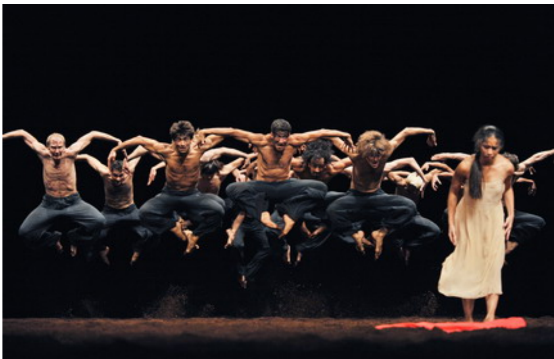
La consagració de la primavera. Tanztheater Wuppertal-Pina Bausch.