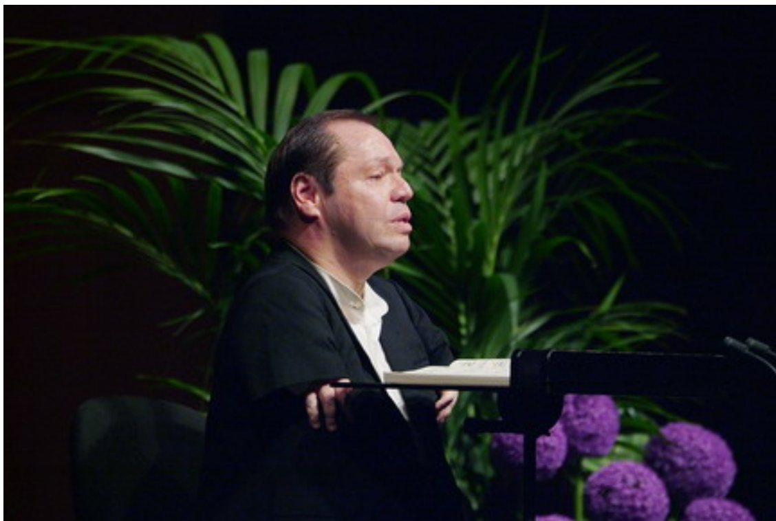
Thomas Quasthoff.