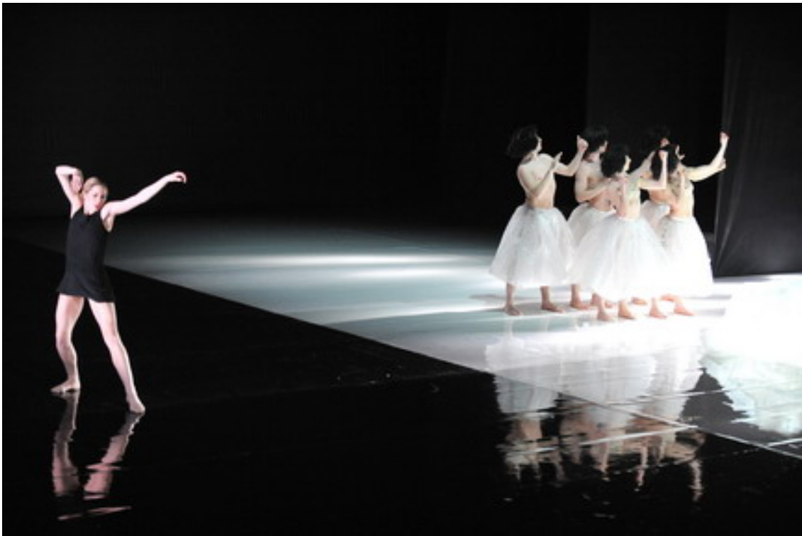
Tar and Feathers. Nederlands Dans Theater I.