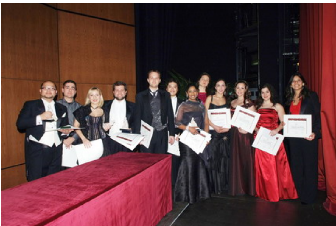
Solistes participants del Concert final del Concurs Francesc Viñas.

Gershwin: «My man's gone now» de Porgy and Bess