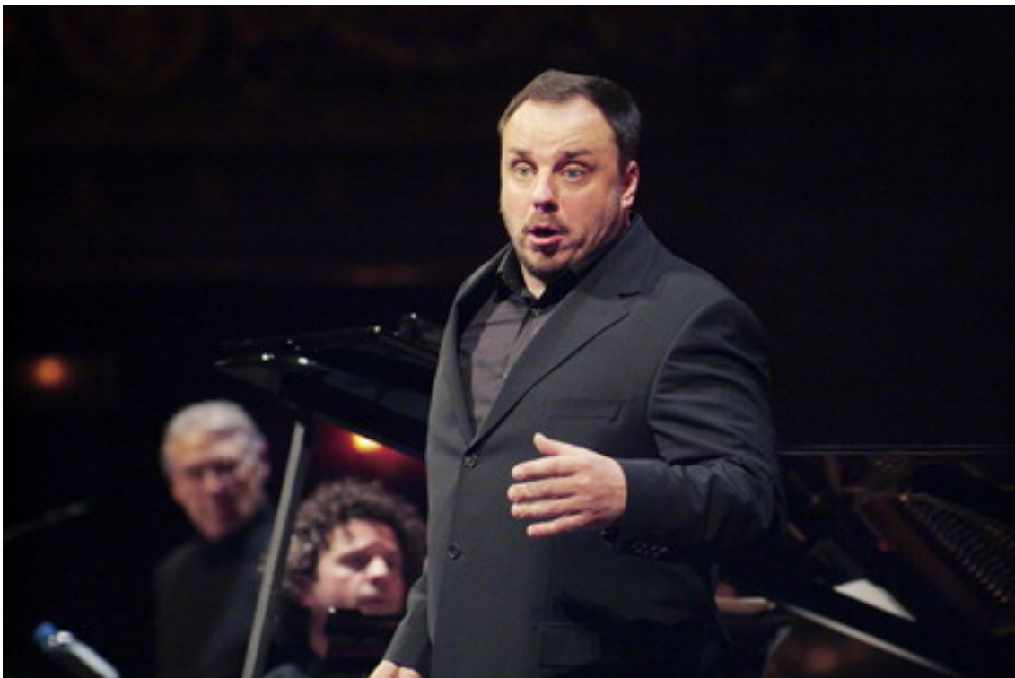
Matthias Goerne.