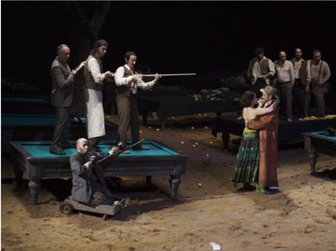
La cabeza del Bautista.