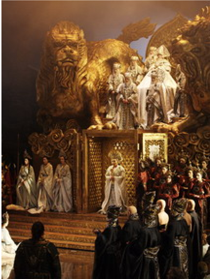
Turandot. Maria Guleghina (Turandot).