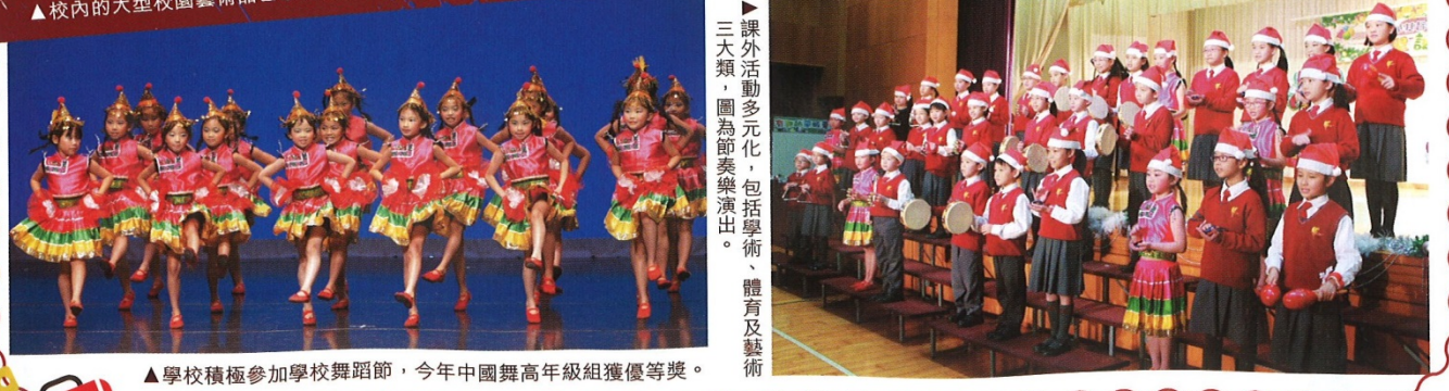
▶課外活動多元化,包括學術、體育及藝術三大類,圖為節奏樂演出。