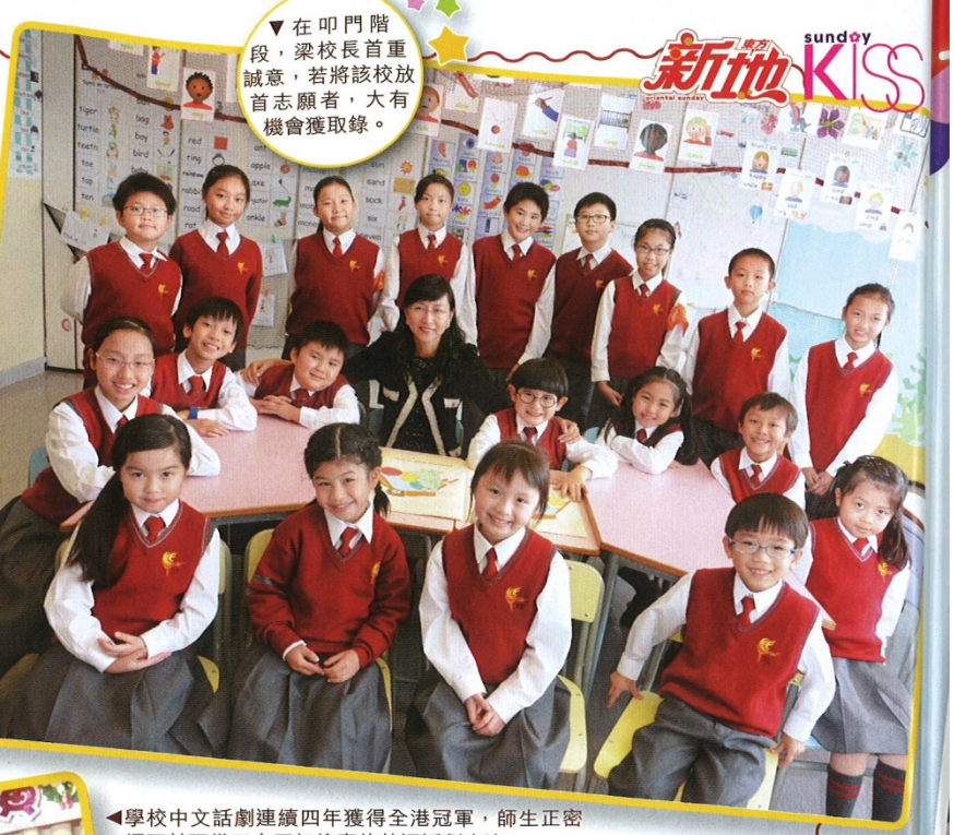
▼在叩門階段,梁校長首重誠意,若將該校放首志願者,大有機會獲取錄。

近年基法小學(油塘)在自行分配學位階段,每年都收到300至400份申請表,即使叩門名額只有12個,卻引來200至300人競爭。梁校長明言:「在自行分配及統一派位由頭到尾都選本校的學生優先考慮,也大有機會獲選。」在叩門階段,校方會接見所有申請人,「他們全部都可以參加第一輪筆試,考中、英、數的基本知識,不過筆試成績只作參考,我們最緊要看志願,再在當中揀60至70人進入第二輪面試。」第二輪面試由校長、副校長、主任等約六人,各自面見學生和家長,接見的可能是校長或其他老師。「這個時候一併見家長,了解他們選讀本校的原因,我喜歡能好好照顧和支持小朋友發展的家長,也會看學生成績及課外活動表現。不過我們最重視誠意,以及小朋友是否想入宗教學校。」有家長日日在學校門口等梁校長,也有的瘋狂來信,梁校長說如有迫切需要的家長才接見。