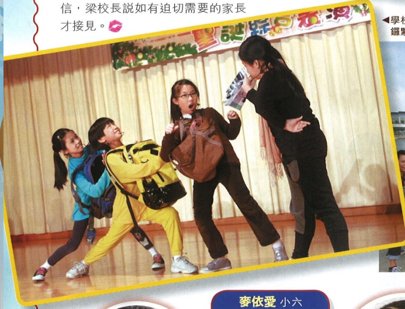
▲學校中文話劇連續四年獲得全港冠軍,師生正密鑼緊鼓預備五十周年校慶的英語話劇表演。