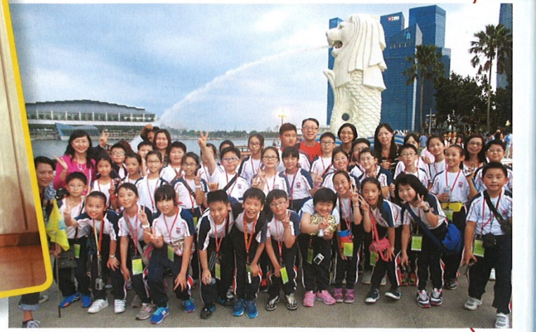
▲校方舉辦了不少境外交流團,如前往新加坡的學校進行交流,了解當地文化。