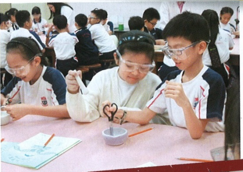
▲在「合作學習法」下,學生透過小組討論一起學習,令組內每一位成員參與及作出不同的貢獻。

學校提供六十多項課外活動,學生在視藝方面表現尤其出色。校園各處遍布學生的藝術作品,原來學校自2002年開始推行「公共藝術家夥伴協作計劃」,每年邀請藝術家為學校設計及推動各項藝術計劃。梁校長分享計劃的成果:「例如第一年進駐新校舍時,當年的一小一學生印上他們的小掌印,成為一幅藝術品,剛好他們今年畢業,大家都在掌印前拍照留念,別有意義。」師生從觀塘搬到油塘校舍,為加強與油塘新市鎮的聯繫,藝術家與師生合力創作,在走廊掛上多幅富地區特色的壁畫,組成一條藝術觀賞路線「美藝徑」,如有鯉魚門面貌的壁畫。