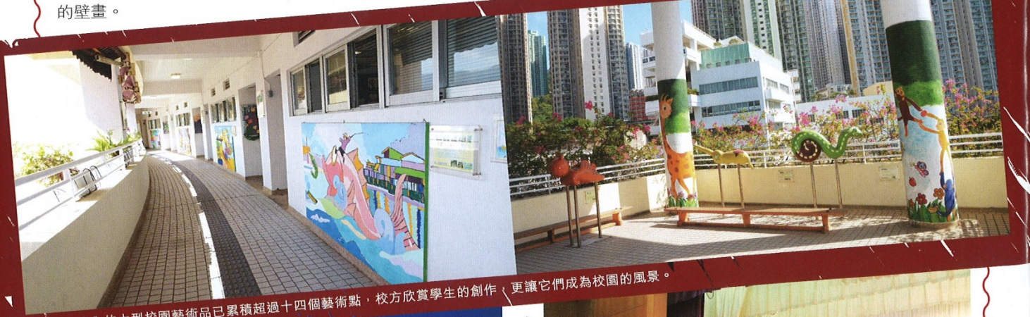
▲校內的大型校園藝術品已累積超過十四個藝術點,校方欣賞學生的創作,更讓它們成為校園的風景。