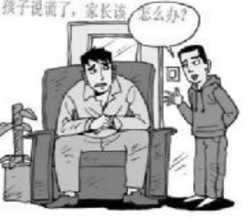
孩子说谎了,家长该怎么办?

5.耐心细致地说服教育 家长平时要善于发现问题,消灭问题于萌芽状态。处理问题时要和风细雨的耐心教导,注意孩子的神情、动作和言语,搞清楚事情发生的经过,将孩子的有意说谎和无意说谎区分开来。心理学的研究和教育实践表明,一个人在思想品德上受到潜移默化的影响,所形成的道德观念,对一个人品德的成长影响极大。作为成人必须注意自己的示范作用,让孩子在家庭学习、日常生活、人际交往、游戏玩耍等过程中多积累一些正面的道德经验。(乐乐)