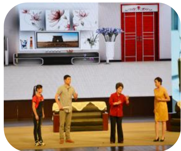
2016 许昌春节戏曲大联欢