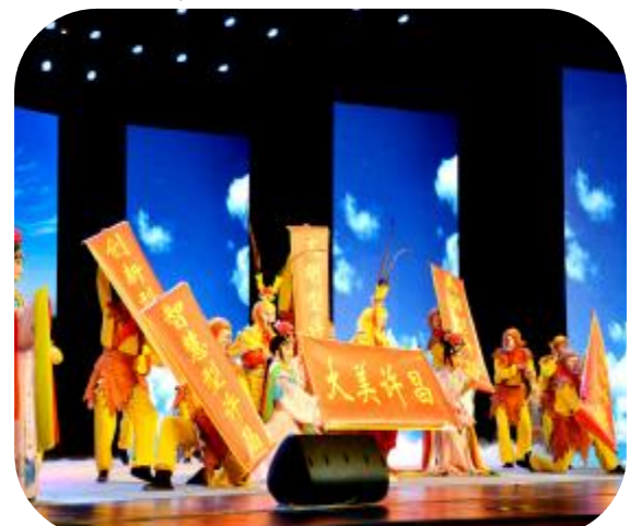
2016 许昌春节戏曲大联欢