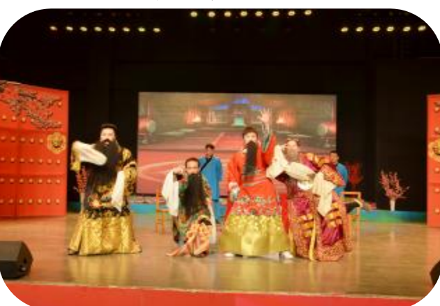
广电一家亲迎新春联欢晚会