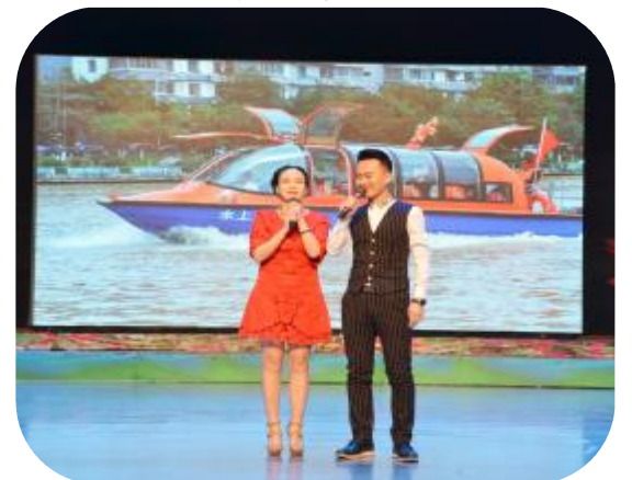
广电一家亲迎新春联欢晚会