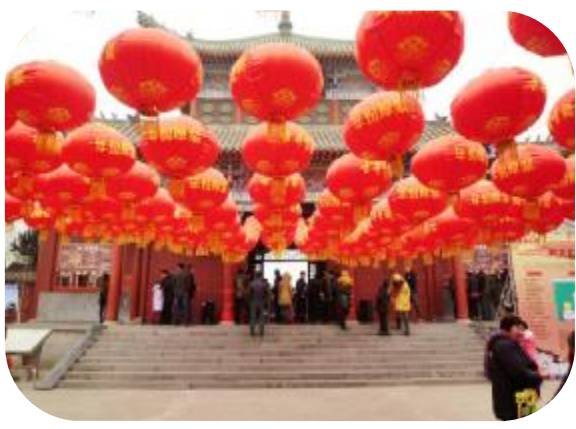
第三届灞陵桥文化庙会