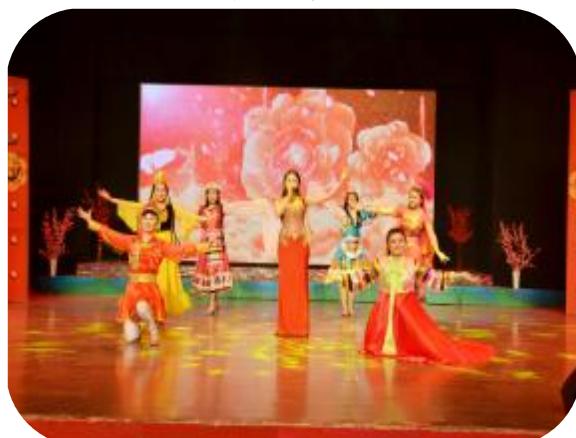
广电一家亲迎新春联欢晚会