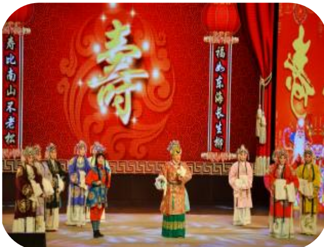
2016 许昌春节戏曲大联欢