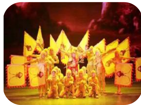
第三届灞陵桥文化庙会