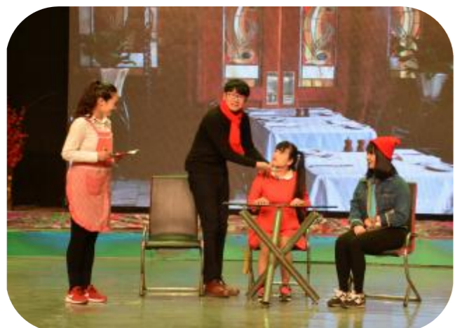
938 汽车音乐广播的主持人在表演小品节目