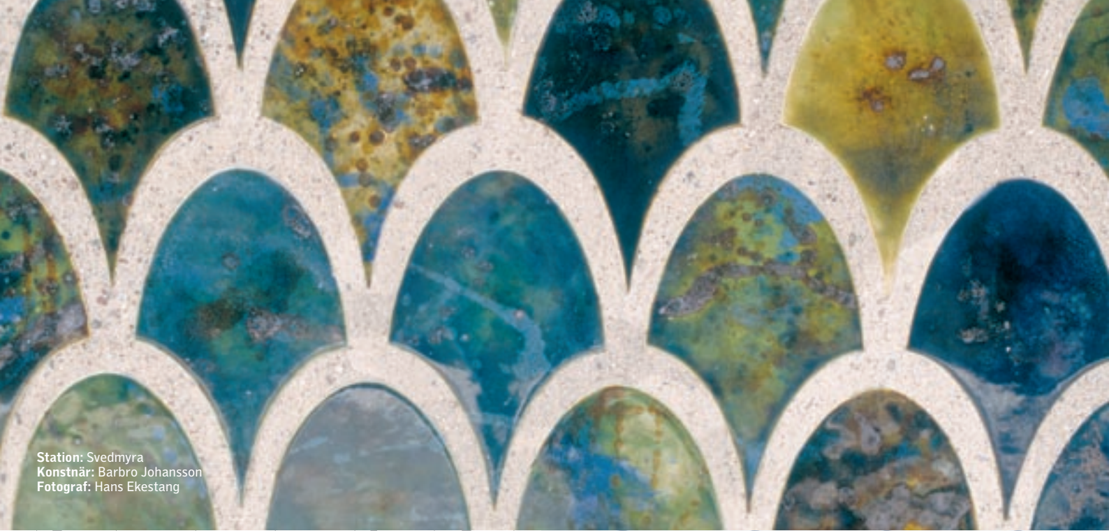
Station: Svedmyra Konstnär: Barbro Johansson