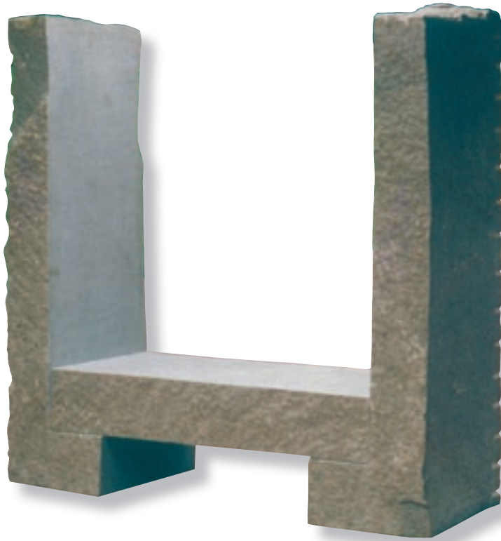
Station: Skarpnäck Konstnär: Richard Nonas