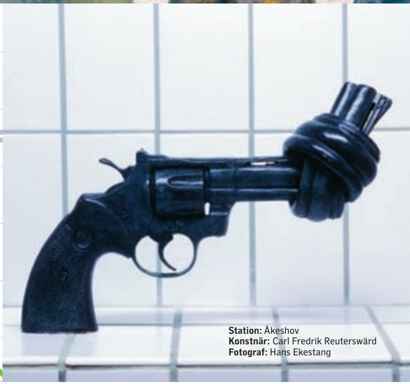
Station: Åkeshov Konstnär: Carl Fredrik Reuterswärd