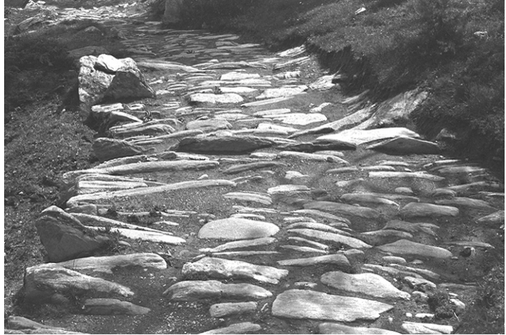
Pflasterung mit steilgestellten Steinen, Randsteinen und Querabschlägen zur Wasserableitung oberhalb Simplon Dorf (VS 1.2.4). Abb. 5