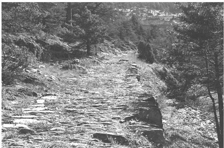
Besonders auf der Nordseite zwischen Riederwald und Taferna wird die Weganlage durch talseitige Stützmauern gesichert. Abb. 7

Wenn talseitige Stützmauern nötig waren, führte man diese in traditioneller Trockenmauertechnik aus: lagig und in gutem Verband geschichtet. Interessant ist in diesem Zusammenhang folgende Feststellung: Bei den gefundenen zweistufigen Ausbauten des Weges (s. Abb. 1) erfolgte der äussere (und damit jüngere) Abschluss der Trockenmauern mit gestellten Steinplatten, während die ältere Mauer als Wegabschluss nur horizontal geschichtete Steinplatten kannte.