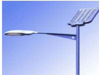
Solar Street Lights