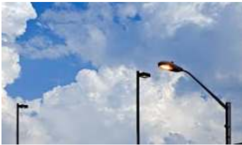
Electric Street Lights