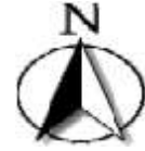
Map Not To Scale