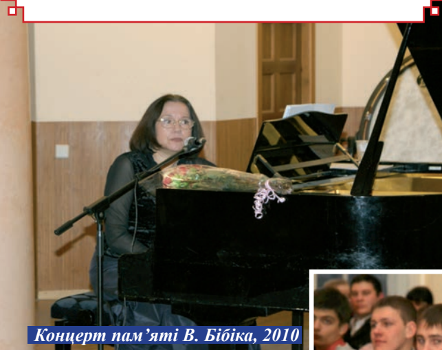
Концерт пам'яті В. Бібіка, 2010

«Нужно ли доказывать, как важна для нас именно музыкальная классика – она дает ощущение внутренней гармонии, она позволяет вырваться из плена суеты, учит духовной стойкости, в нашей сегодняшней драматической реальности мощно подпитывает энергетически» (1999 р.)