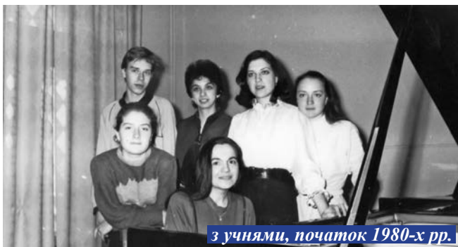
з учнями, початок 1980-х рр.