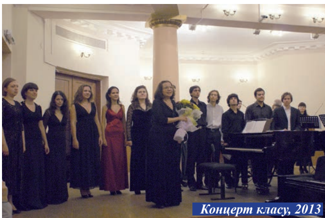
Концерт класу, 2013