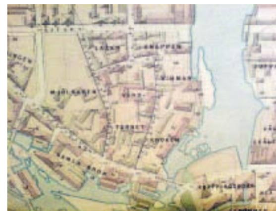
Virrvarr. Området Midtina på en karta från 1870-talet. Norra Bryggaregatan och Trångsundsgatan skär rakt igenom kvarteren och det rörde sig om en blandning av hus och gårdar.