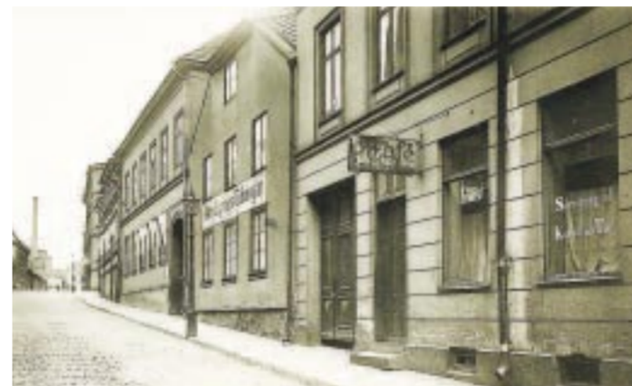
Tidningsgatan. I mer än 130 år fungerade Västgötegatan som säte för Norrköpings Tidningar. Epoken i kvarteret Mjölaren började redan 1786 och kom att sträcka sig fram till dess att tidningen flyttade in i eget nyuppfört hus vid Hospitalsgatan 1918.

Drottningholmsteatern och kulisserna är en del av Unescos världsarv. Det rör sig om drygt 490 objekt från 1700-talet, i form av kulisser, fonder och lösa dekorelement. Vid de föreställningar som ges i dag används kopior. LASSE SÖDERGREN