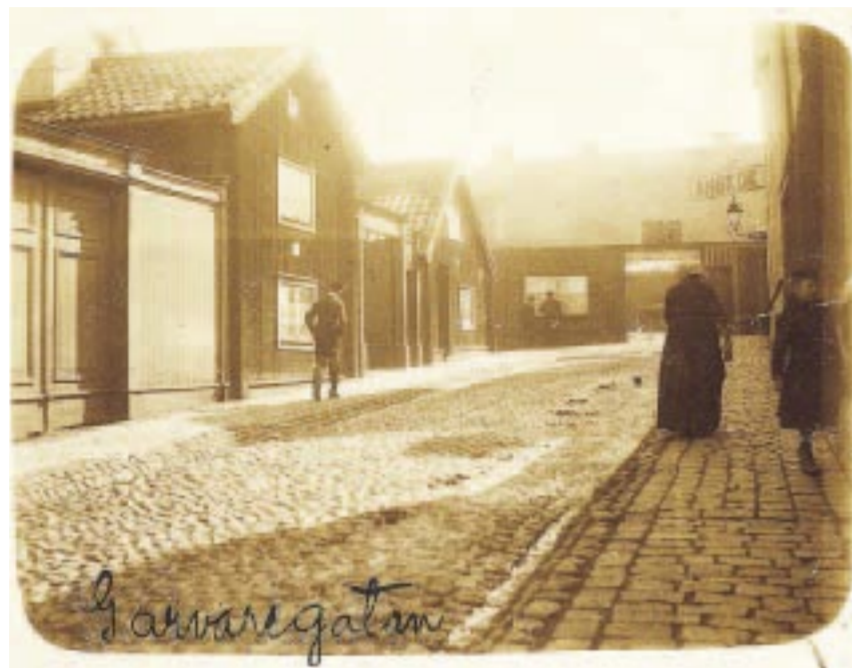
Kåkstad. Garvaregatan mot Trångsundsgatan, innan framdragningen till Västgötegatan. Till höger ses skylten för Frälsningsarméns ångkök.