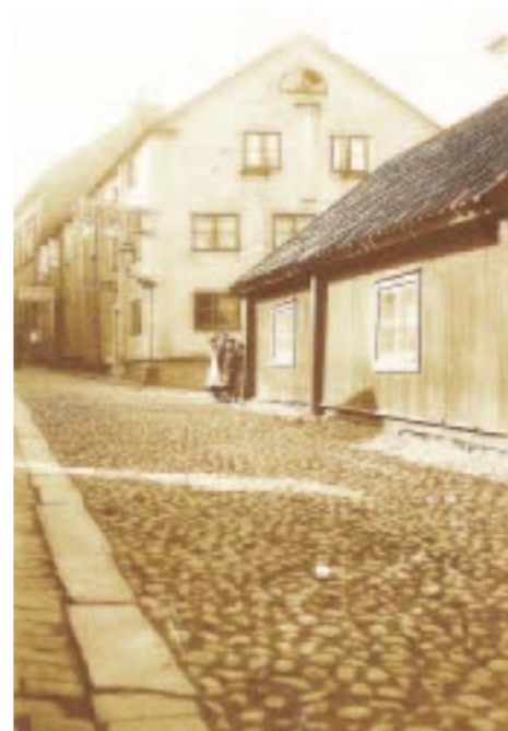
I kringelkrokar. Trångsundsgatan hade kvar sin äldre sträckning, från tiden innan stadens gator delades upp i rutnätsmönstret. På bilden ses gatan komma fram vid skylten för ångköket.