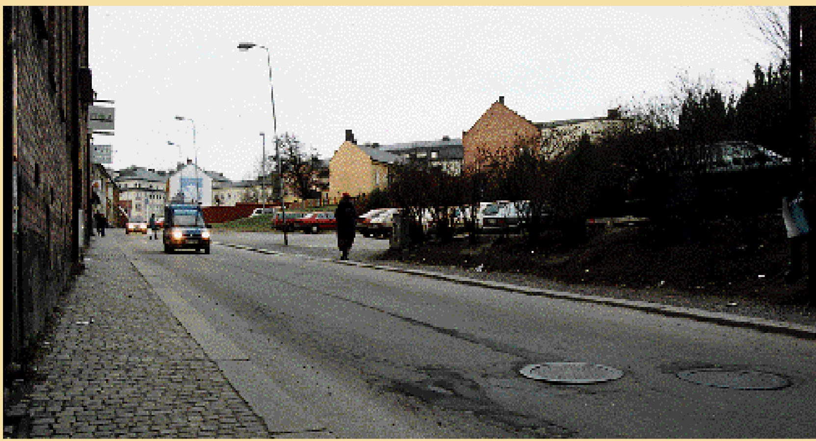
Nu. I decennier har vi vant oss vid de tomma parkeringstomterna. Men nu planeras det återigen nya byggnader längs Västgötegatan.