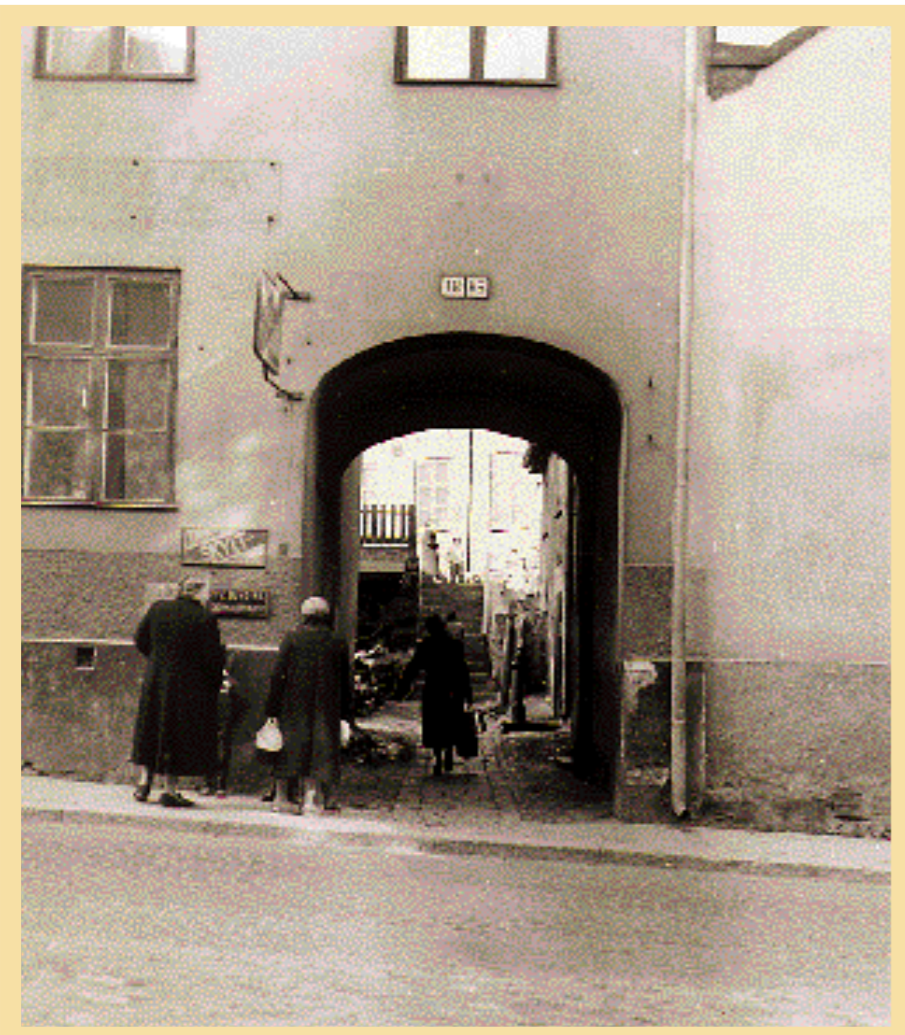
Norrköpings Tidningar återfanns på ett par olika adresser längs Västgötegatan, bland annat vid nummer 16-18.