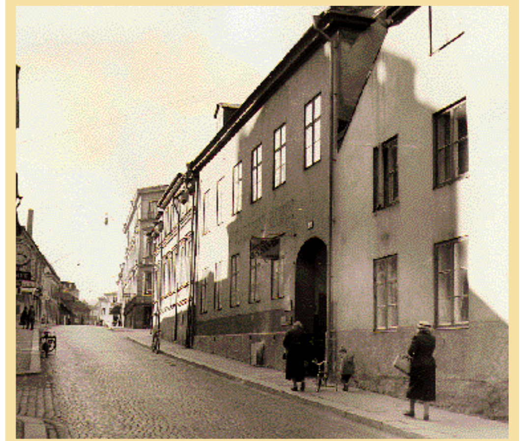
Då. Västgötegatan mot väster 1959. Gatubilden var fortfarande enhetlig, men några år senare revs bebyggelsen.