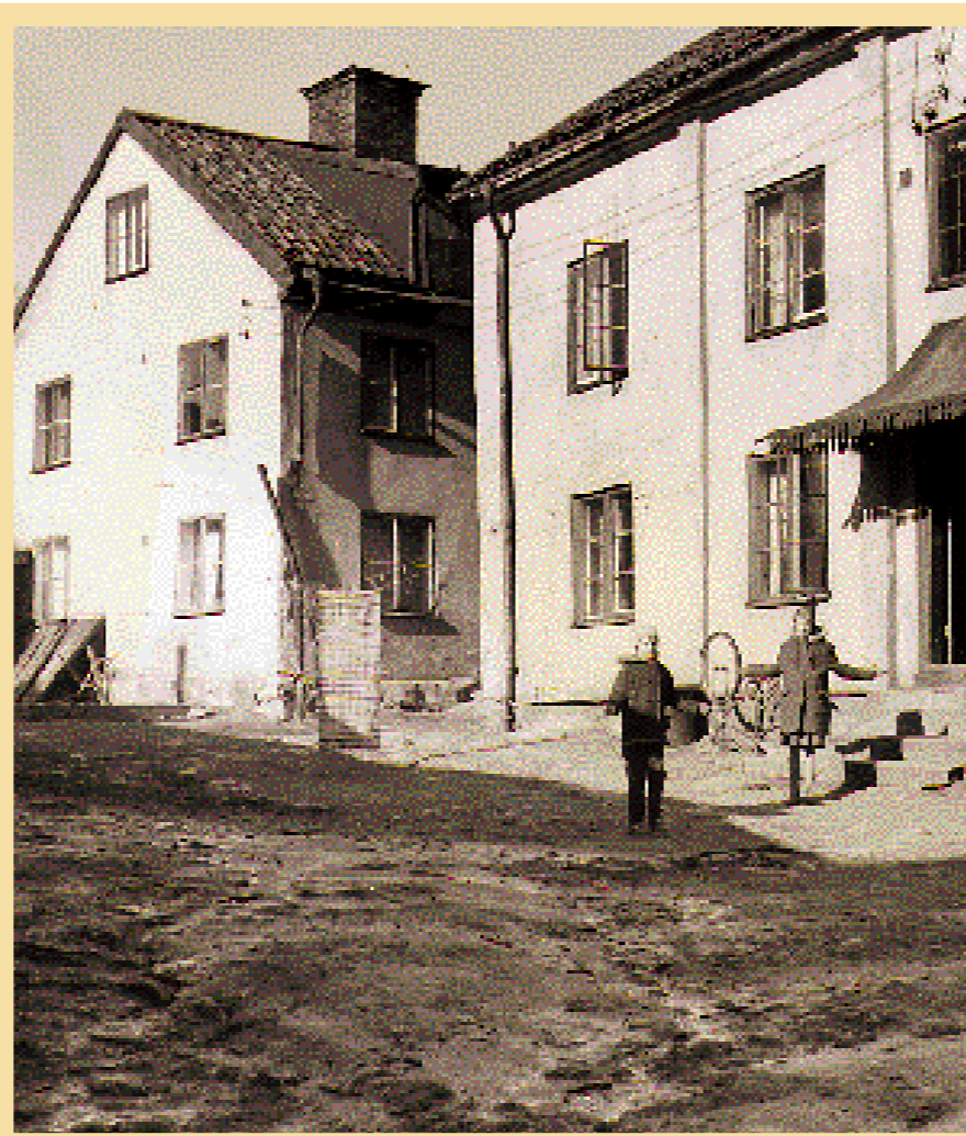
Våren 1959. Kvarteret Mjölneren var fyllt med gamla kåkar och uthus. De grusiga bakgårdarna förvandlades lätt till dypölar.