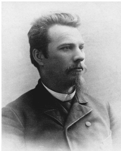
Е.Е. Лазарев в Америке. 1890 г.

для занятий физическим трудом, к которому был приучен с раннего детства. Лазарев был убежден, что нужно «торопиться жить, то есть мыслить, чувствовать, познавать себя и окружающий мир, напоминать людям, что человек из животного превращается в полубога только благодаря его жизни в обществе, что поэтому для полного человеческого счастья на земле долг каждого – любить ближнего своего, работать, творить...» [Там же, с. 74]. Много позже, в 1920-е гг., во время его пребывания в Чехословакии, российские эмигранты и чехи называли Егора Егоровича не иначе как «справедливый старик» [Андреев 1996, т. 2, с. 84].