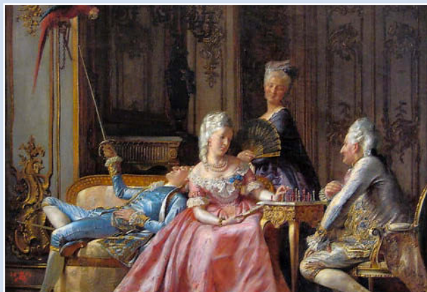
Кристиан VII, Каролина-Матильда и Струэнзе

своей сути и физически слабый, он отстаивал идею, что настоящий мужчина должен периодически подвергать себя пыткам и истязать. Пытаясь сделать свою кожу крепкой и непроницаемой, король подвергал себя физическим пыткам, щипал и бил. Он занимался «физкультурой» даже ночами, бегая и прыгая по королевскому саду, растирался снегом, льдом и порохом, обжигался раскаленными деревяшками, боксировал со стеной, а иногда даже разбивал о нее голову в кровь.