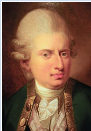
Иоганн Фридрих Струэнзе