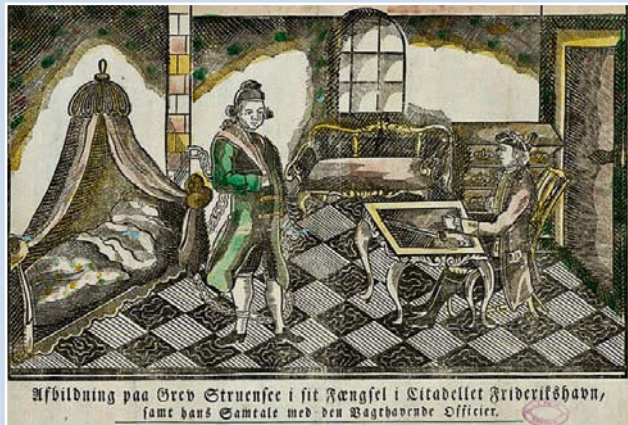
Струэнзе в тюрьме