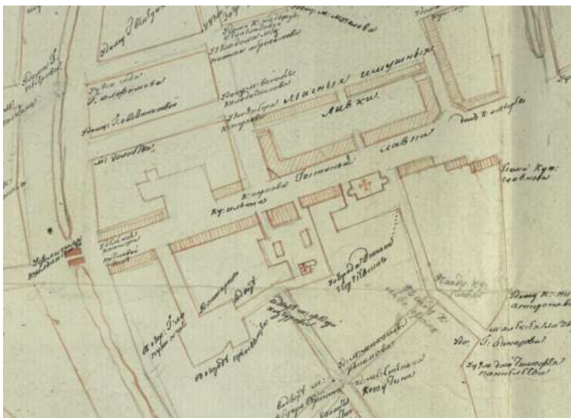
Чертеж 1841 года (ГАВО Ф.420. Оп.1. Д.1196. Л.15)

В 1841 году в городе проходило выравнивание землемерами городских улиц по установленным межевым столбам. На схематическом чертеже 1841 года мы видим рядом с Георгиевской церковью два отдельно стоящих флигеля бывшего Приказа общественного призрения, пожарный двор.