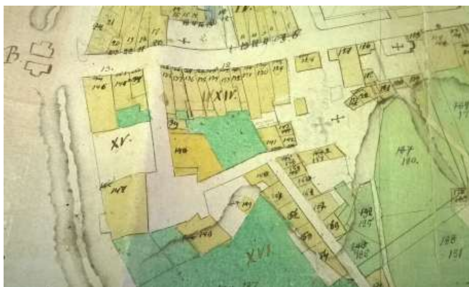
ГАВО. Ф.417. Оп.4. Д.585. Л.20.

Интересное изображение Георгиевской улицы мы находим на плане 1-й части города 1804 года: