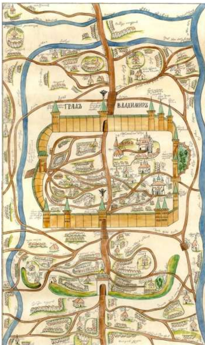
«Чертеж» 1715 г.

Отметим, что при всей схематичности рисунка, со стороны обрыва к Клязьме никаких строений не показано.