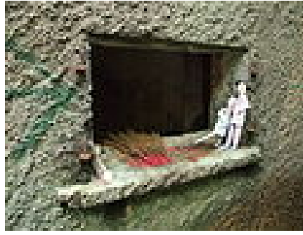
因為曾鬧鬼的關係， 其中一座營房的窗上有用作拜祭的用品