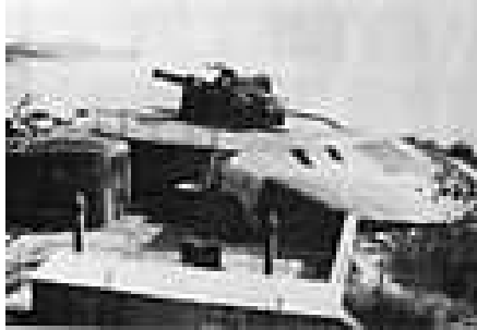
二次大戰時 F1 編號的海岸炮

要塞由營房、五個炮台、指揮總部及多座瞭望台與掩蔽體組成，其中大炮口徑為9.2吋。要塞配合位於 西高山 的機槍堡，扼守着 維多利亞港 西部及 硫磺海峽 等航運要道。