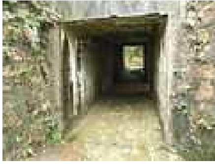
營房之間四通八通的防空通道