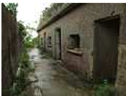
偽裝保護牆後的營房