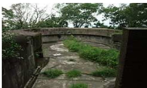
其中一座炮台的遺址