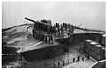
二次大戰時 F2 編號的海岸炮