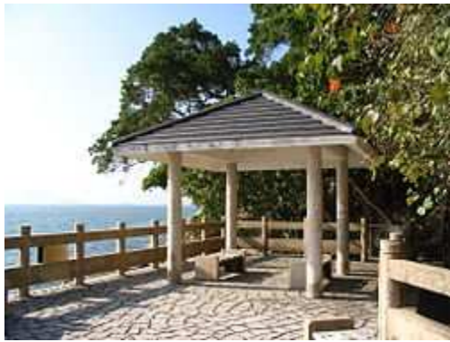
位於銀禧炮台舊址的日落觀瀾亭