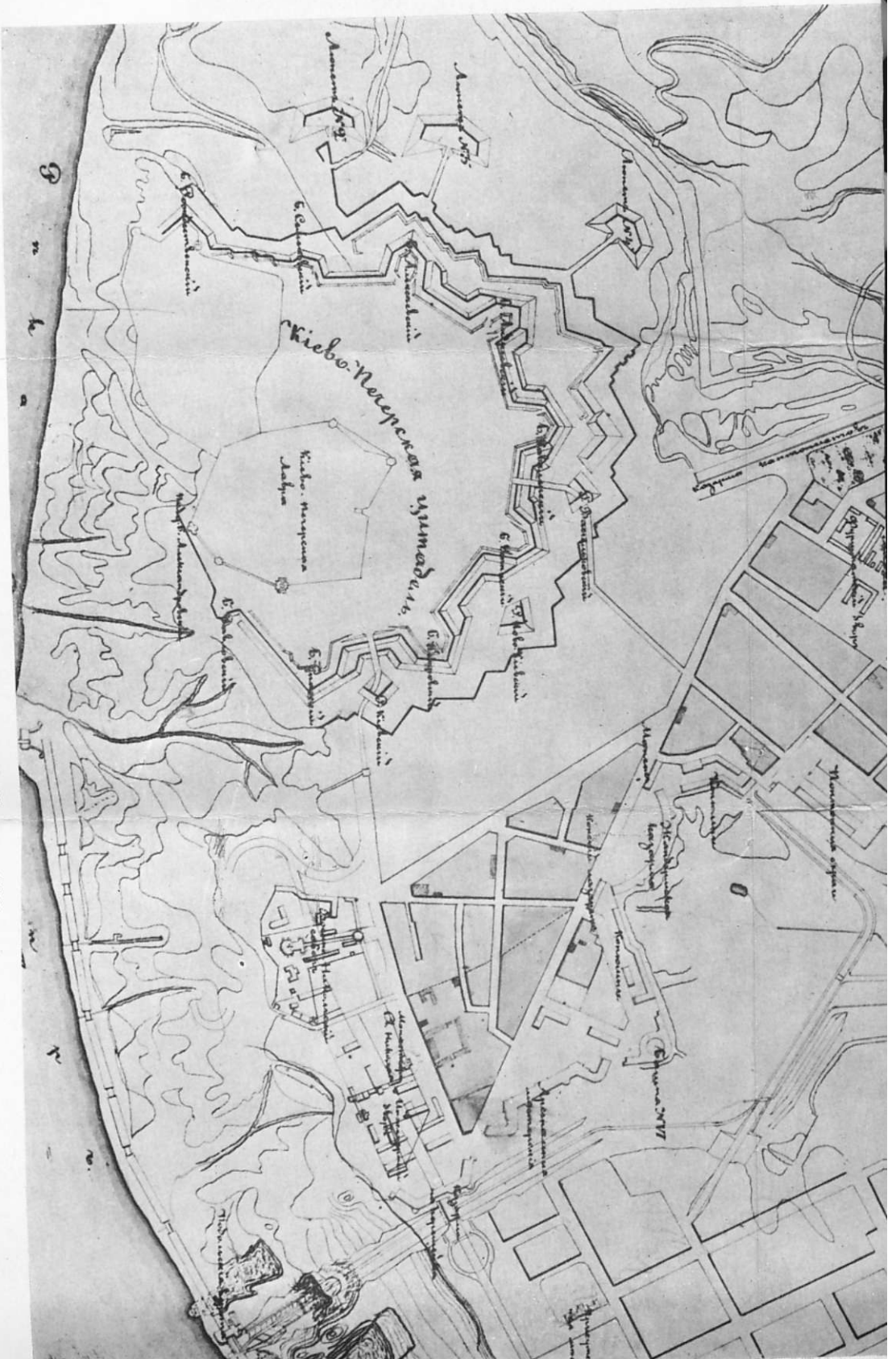
Генеральный план Киево-Печерской фортеці. 21 линия 1853 г. Масштаб: у 1 дюйма 100 сажень. Автор: инженер-подполковник Князичко.