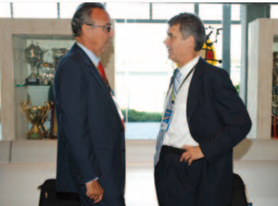
Joan Gaspart, vicepresidente de la RFEF, y Ángel María Villar.