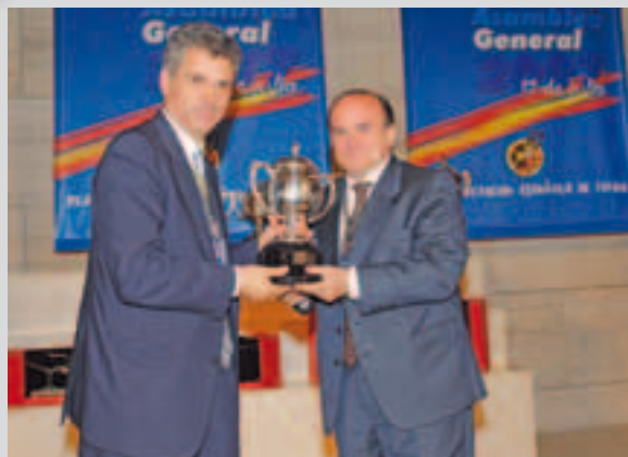
El presidente del Real Zaragoza...