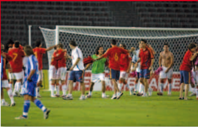
Michel Platini, presidente de la UEFA, entrega la Copa a los felices ganadores.