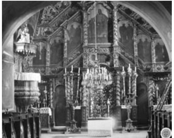
Іконостас церкви Св. Миколая в м. Бучач. Світлина 1894(?) р.

В порівнянню з львівським пятницьким іконостасом, що є твором різко очеркненої доби і стилю, богородчанський іконостас уявляє собою комплекс творів ріжних епох і артистів від XVI ст.