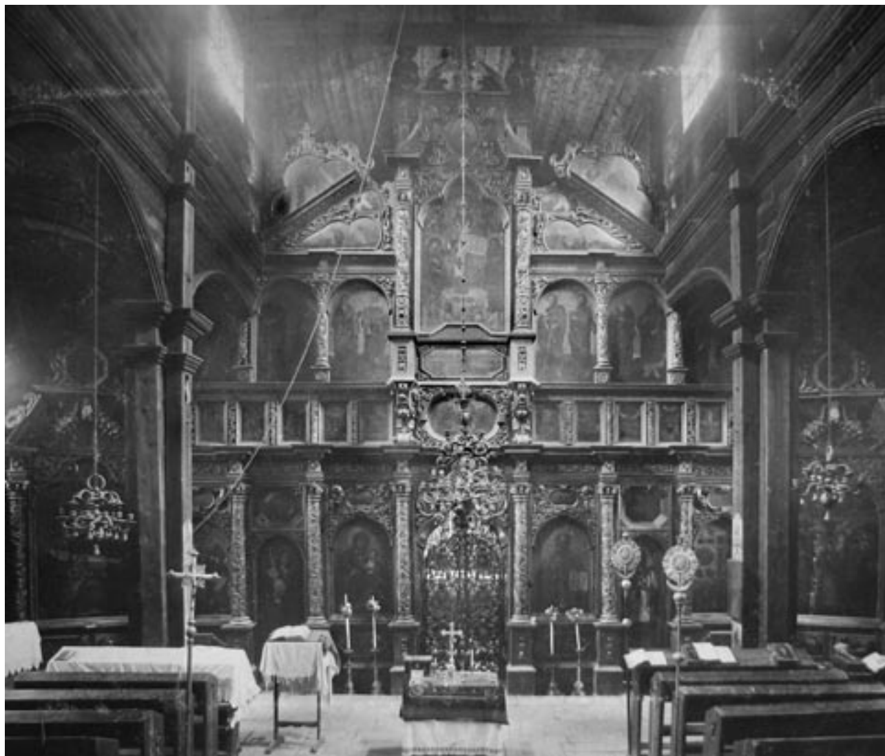
Іконостас з Хрестовоздвиженської церкви монастиря Скит Манявський, розміщений у дерев'яній Троїцькій церкві м. Богородчани. Світлина 1894(?) р.

Богородчанський іконостас цікавить нас не тільки тому, що це визначна пам'ятка нашої національної культури, але і тому, що цей твір мистецтва був одним з перших реставрованих об'єктів українського мистецтва у Галичині за державні кошти згідно рішення Галицького Сейму, до того ж тут застосувалися нові, на той час, дослідницькі методи в плані вивчення, – фіксація, обміри і фотографування.