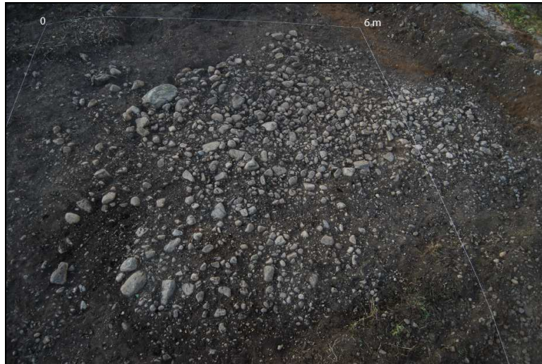
Figur 7: Oversiktsfoto av røysen etter finrensing. Mot SV.

Etter opprensing ble det tatt oversiktsfoto (jfr. Figur 7), i tillegg til fotomosaikk. Til fotomosaikk bruker man en ramme med et indre mål som er kjent, i dette tilfelle 2 x 2m. Man legger så rammen på røysen og tar en serie med bilder hvor hver ramme overlapper. Slik kan man i ettertid sette sammen bildene, og få en helhetlig plandokumentasjon av røysen.