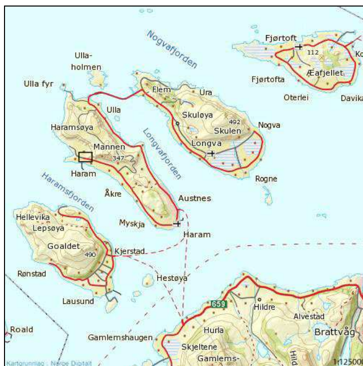
Figur 1: Oversiktskart.

Sikringsgravningen ble prioritert ut fra en sammenlignende tilstandsvurdering av flere objekt meldt inn av fylkeskommunene tilhørende Bergen Museums distrikt. Røysen framstår i dag som en røysrest som har blitt beskadiget av biler og landbruksmaskiner, og med plassering som en øy midt i et trafikkert tunområde er det bare et tidsspørsmål før kulturminnet går tapt (jfr. Figur 4). Vår vurdering var at det hastet med å utføre en utgravning av det som fortsatt måtte være bevart av rester etter gravleggingen, for å sikre dets kildeverdi. Bergen Museum så det som nødvendig å legge opp til en sikringsgravning som innebærer at hele kulturminnet graves ut, med påfølgende oppheving av fredningen.