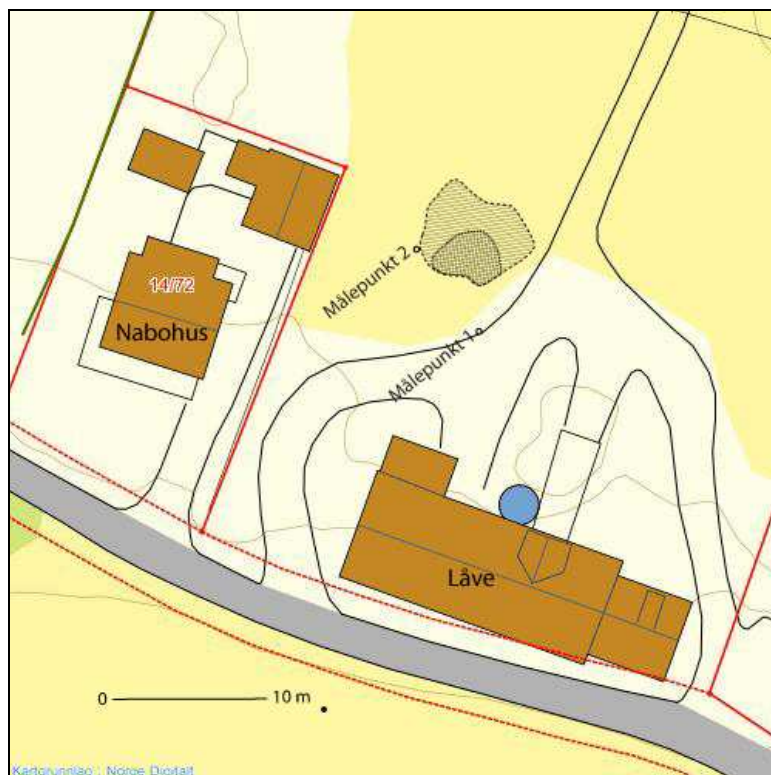
Figur 3: Kartfesting av røysen, ytre omriss markerer steinpakningens avgrensning, indre omriss markerer hovedtyngden av større stein.