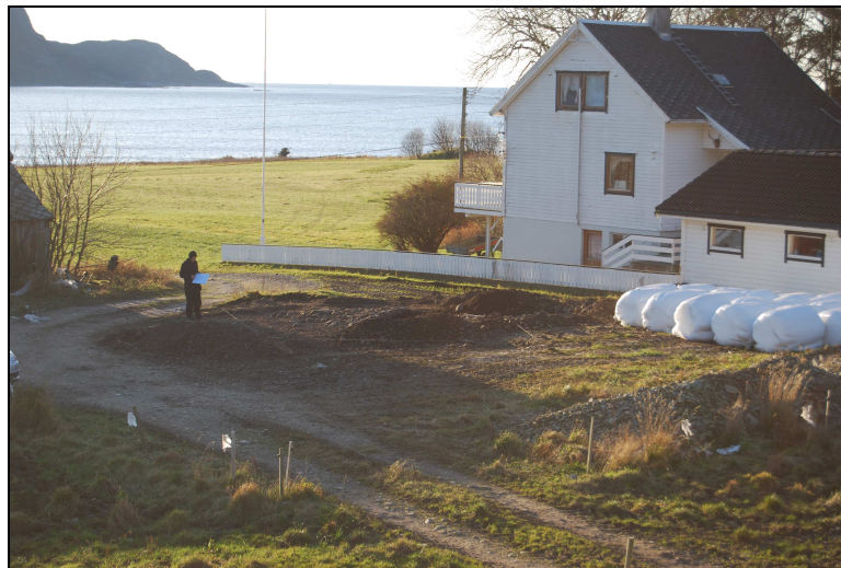
Figur 8: Utsikt mot sjøen. Mot V.

Røysen ble tegnet inn på en grov skisse hvor to punkter ble målt inn ved hjelp av kartfestete objekter i nærområdet, låven på tunet, og huset på nabolommen (jfr. Figur 9). Disse punktene ble brukt til å kartfeste røysen, (jfr. figur 3). Koordinatene ble funnet ved hjelp av karttjenester.