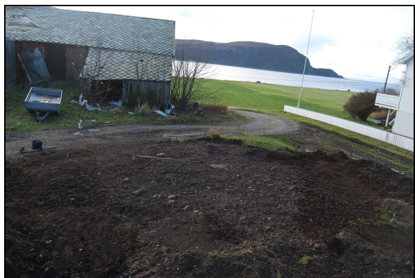
Figur 6: Ser småsteindekke etter grovrens. SSV.