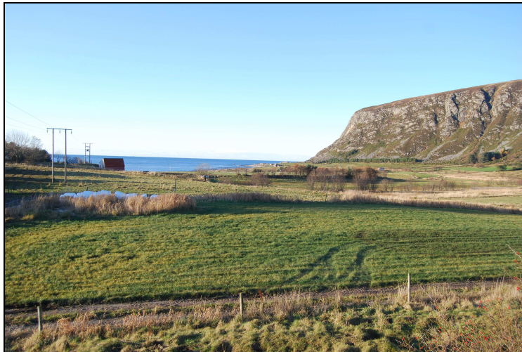
Figur 2: Utsikt fra tunet mot NV.

Møre og Romsdal fylkeskommune ble kontaktet av Harald B. Haram i forbindelse med gravrøys id 16192, som var skadet og lå utsatt til på tunet på gården Haram bnr.16. Gården ligger på vestlig side av Haramsøya (jfr. Figur 1), ca 10 m.o.h., med godt jordbruksland på alle kanter. Fra røysen har man utsikt mot Haramsfjorden og Lepsøya, og mot en karakteristisk flat fjellrygg i nord.