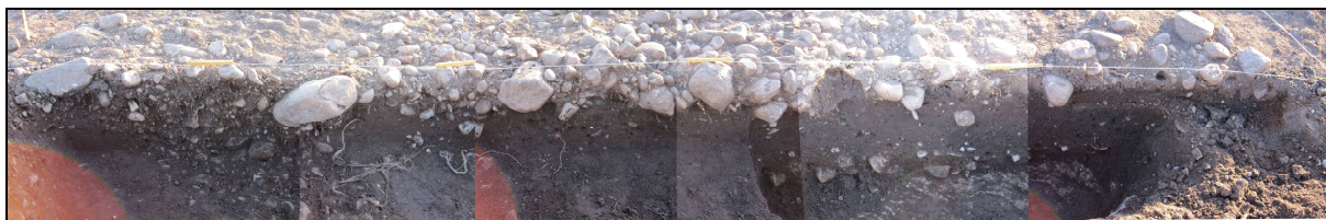
Figur 11: Sammensatt foto av steinpakningens profil. Mot SØ.

Forstyrrelsen kan mest sannsynlig tyde på at området har blitt fylt ut, mulig for å planere ut deler av terrenget. Grunneier kunne fortelle at åkeren før i tiden har strukket seg helt inntil tunet, noe som kan forsterke den antakelsen.