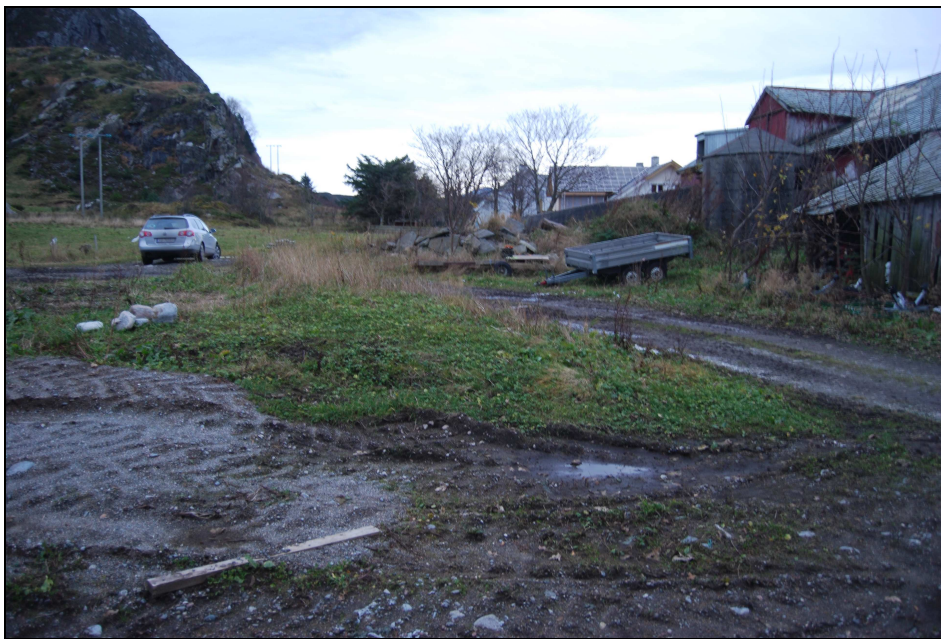
Figur 4: Viser kjøring med maskiner tett opptil røysen. Sett mot Ø.

På grunnlag av denne tilstandsrapporten så fylket det som beste løsning å tilråde utgravning, hvor alternativet var at røysen over tid kunne bli mer skadd.