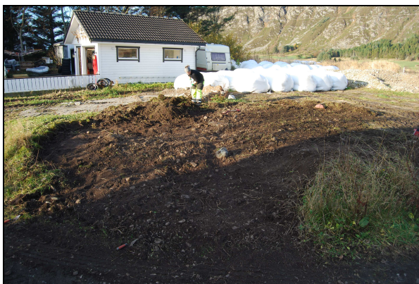
Figur 5: Røys under avtorving. Sett mot N.

Røysresten ble fotodokumentert før avdekking og var tilsynelatende i lik forfatning som på bildene fra 1999. Røysen var dekket av et torvlag på 5 til 20 cm i tykkelse, som ble fjernet for hånd, til sammen ble det avdekket ca 9 x 8 meter (jfr. Figur 5). Under torvlaget lå det et lag med mye småstein og noen større stein, som ble grovt rensset opp med krafse (jfr. Figur 6). Ved fjerning av ca 5 cm kom det til syne en pakning av større stein, som videre ble finrenset fram med graveskje. Steinpakningen hadde en uklar avgrensning ettersom den var forstyrret på alle kanter av påfylte masser og moderne nedgravninger, og mye småstein (tilsynelatende undergrunnsmasse) i kant.