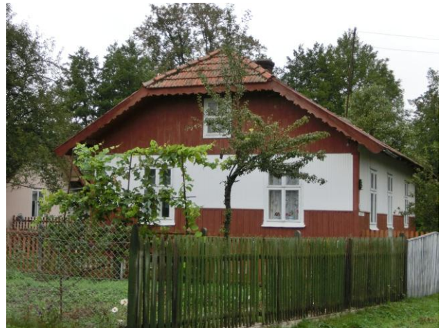
Neue Bilder aus dem früheren Sitauerówka Fotos Irmgard Steinmann, 09/2012