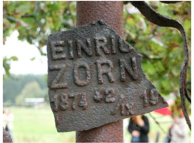
Der frühere deutsche Friedhof von Sitauerówka außerhalb des Dorfes