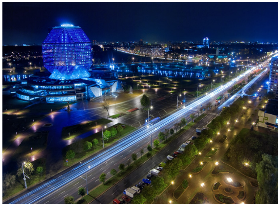
Столица Республики Беларусь г. Минск