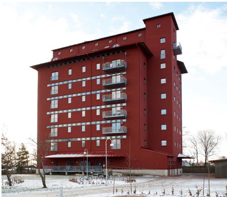
Lagerhuset i Eslöv efter ombyggnaden.