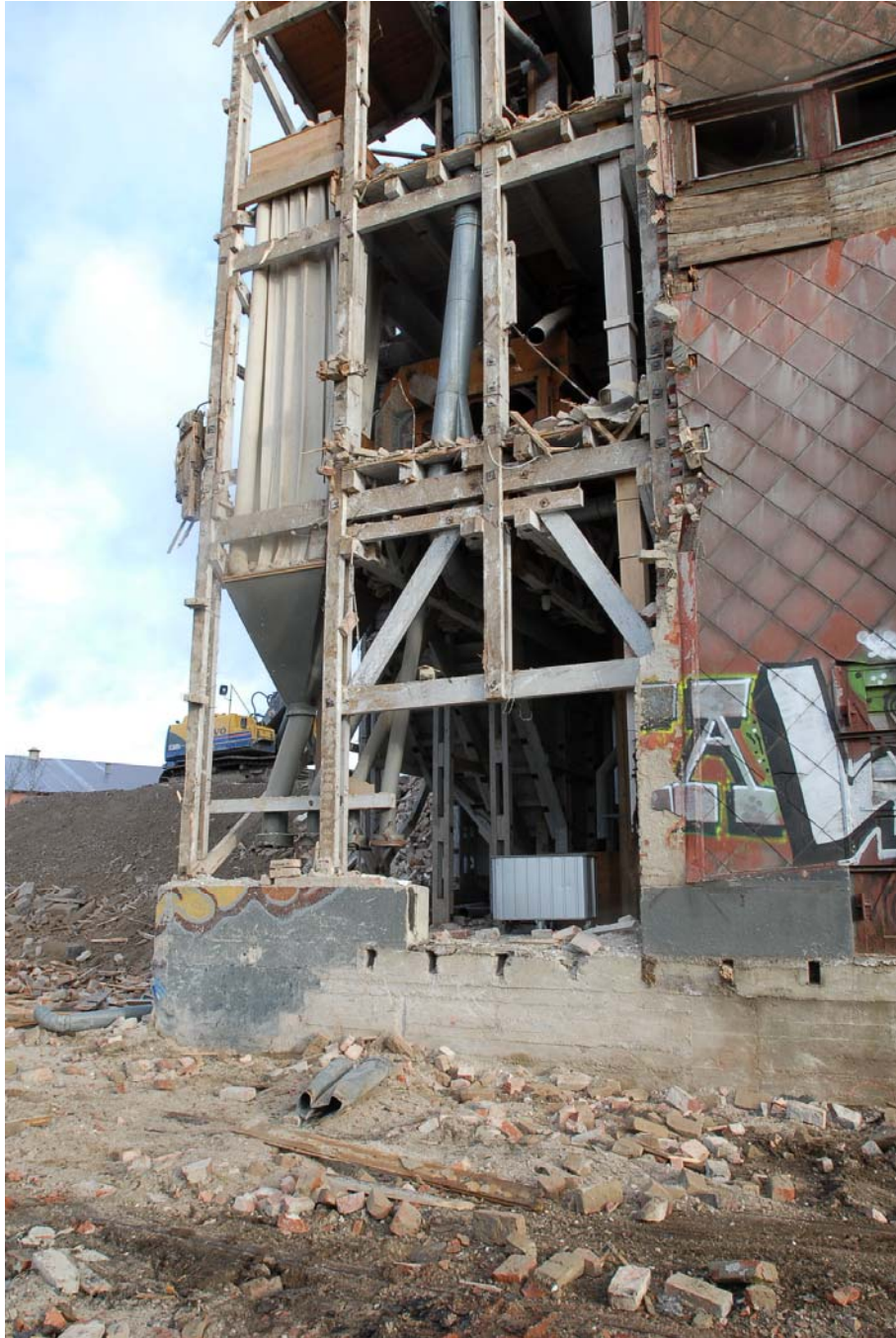
Foto från byggarbetsplatsen när lagerhuset i Eslöv, uppfört på 1910-talet, byggdes om till bostäder under 2000-talet.