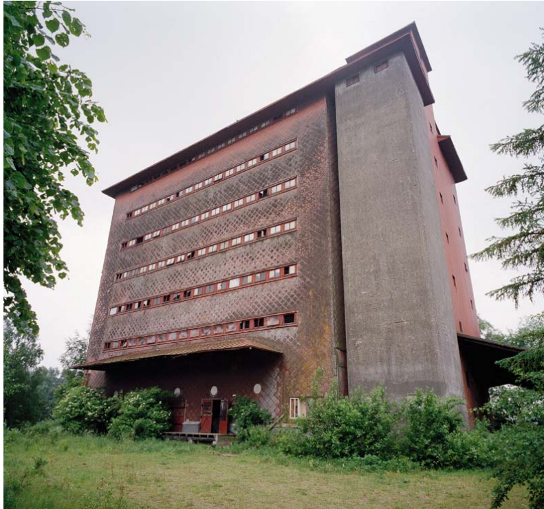
Lagerhuset i Eslöv före ombyggnaden.