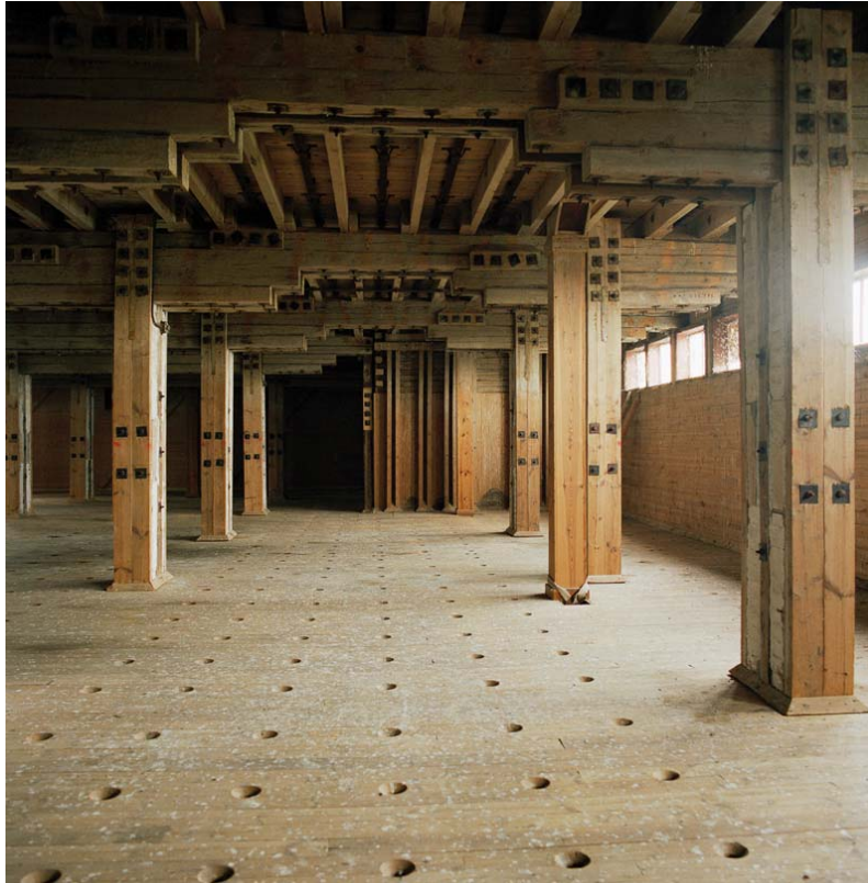
Lagerhusets interiör före ombyggnad, men efter en ordentlig rengöring.