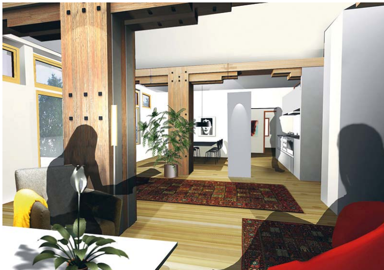
Arkitekterna Krook & Tjäders skiss av hus bostäderna i Lagerhuset skulle se ut.