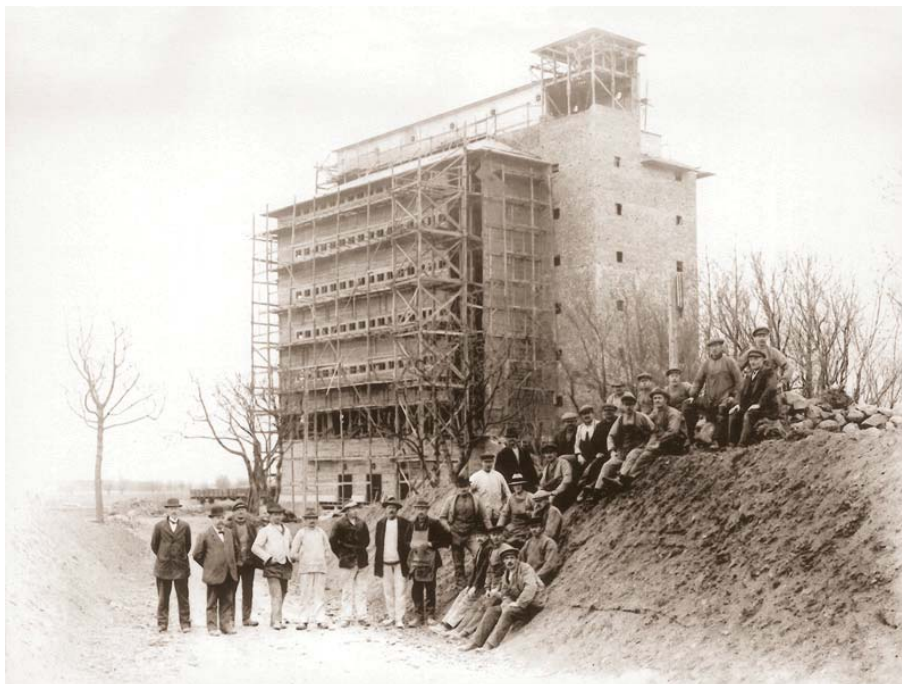
Lagerhuset i Eslöv under uppförandet på 1910-talet.

Ett exempel på en byggnad som stod inför ett liknande öde som torkladan var fram tills för ett par år sedan lagerhuset i Eslöv. Liksom torkladan är lagerhuset en större träbyggnad från början av 1900-talet, med höga kulturvärden, men som stått utan användning under längre tid. Byggnadens enda innevånare, sedan decennierna tillbaka, var levande och döda duvor.