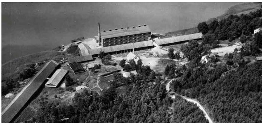
Tegelbruket och torkladan på en flygbild från 1949.

Dagens torklada är en modifierad version av hur den en gång sett ut. Byggnaden har både byggts om och till på flera sätt. Åtminstone några av förändringarna har skett efter att tegelbruket lades ner, vilket innebär att de kan ses som mindre värdefulla utifrån ett kulturhistoriskt perspektiv. Dessutom går flera av förändringarna stick i stäv med byggnadens kulturvärden och karaktärsdrag. Detsamma gäller för omgivningen närmast byggnaden.