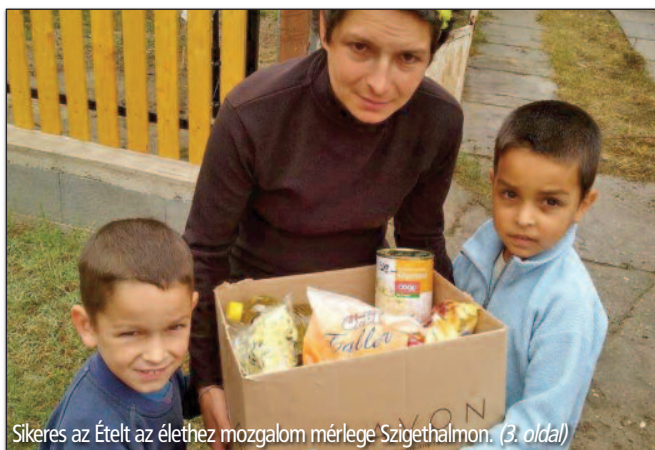
Sikeres az Ételt az élethez mozgalm mérlege Szigethalmon. (3. oldal)

XXV. évfolyam 10. szám, 2015. október ingyenes havilap