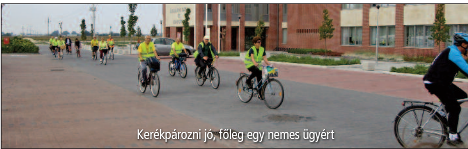
Kerékpározni jó, főleg egy nemes ügyért