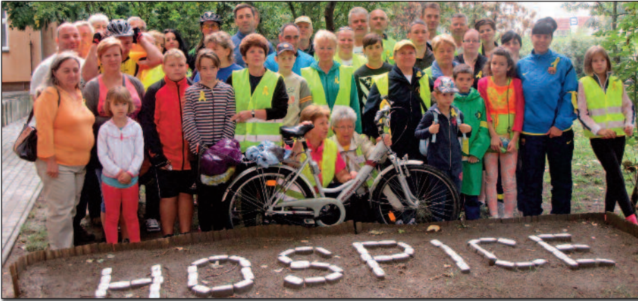
A résztvevők egy csoportja

Városunkat is érintette a „Sárga szalag” kerékpáros zárandokút idén szeptember 20-án, vasárnap. A cél, amiért nyeregbe pattantak nemes és fontos! A legnagyobb szükségét szenvedők segítése, ápolása. Az emberi élet utolsó szakaszának „bearanyozása”. Lelkes és elkötelezett emberek egy hospice ház építésébe kezdtek, s programjuk népszerűsítéséért szerveztek egy háromnapos zárandoklatot a környékbeli településeket érintve. Több száz résztvevő, segítők tucatjai csatlakoztak hozzájuk.