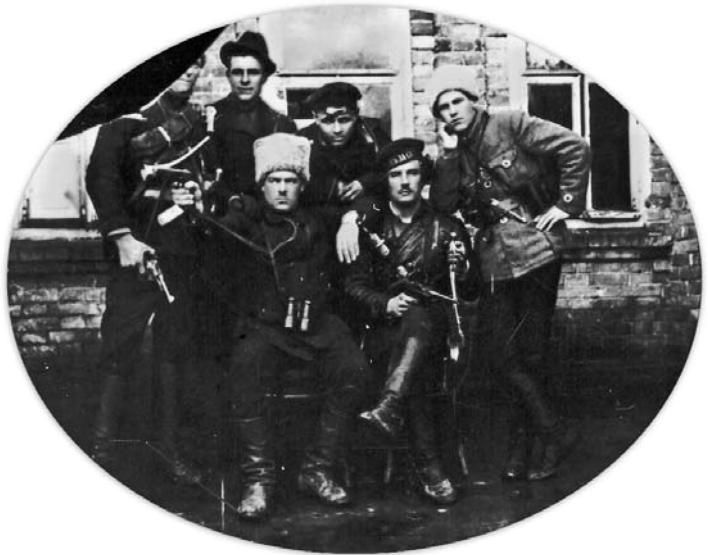
Група махновців. У центрі отаман Щусь