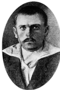
Цюпа–Лисиця, отаман, що діяв у Чернігівському районі 1921 р.