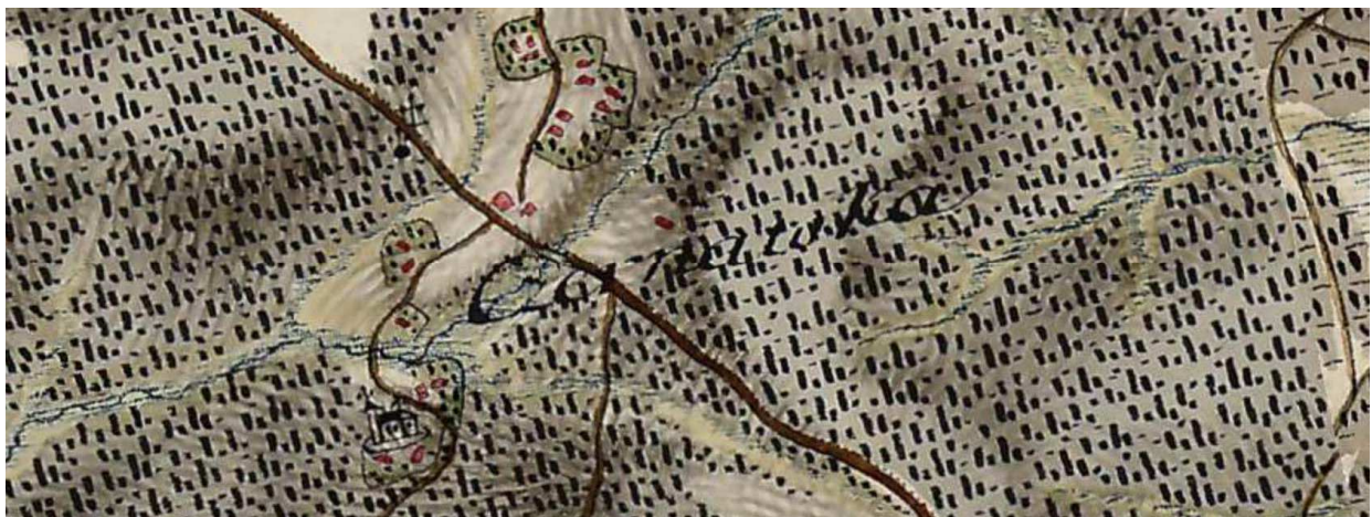
Rys. 2. Na powiększeniu widoczny napis Czarna łąka i oznaczenie świątyni. Według legendy mapy, tak oznaczane są kościoły otoczone murami ( Kirchen mit Mauern umgeben ).