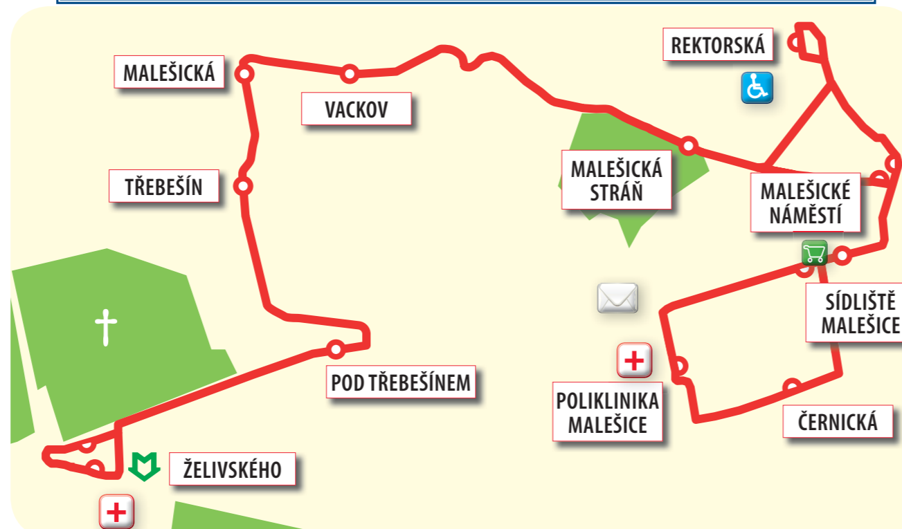
Plánek linky 297 v trase Želivského – Poliklinika Malešice – Želivského

Tato linka zlepší dopravní obslužnost zejména pro obyvatele domova seniorů v Rektorské ulici a také pro návštěvníky malešické polikliniky. Linka bude v provozu celotýdenně cca od 5:00 do 24:00 v pravidelném intervalu 20 minut v přepravních špičkách pracovního dne a 30 minut v ostatních obdobích. Na všechny spoje budou rovněž nasazeny nízkopodlažní midibusy. S touto změnou dojde zároveň ke zkrácení dosavadní autobusové linky 155 o úsek Sídliště Malešice – Habrová. Linku v tomto úseku plně nahradí právě nově zřízená midibusová linka.