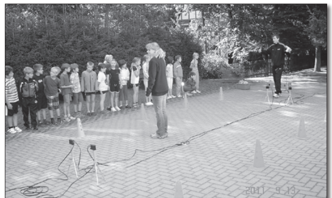
Klasse 1 und 4 der GS Wiesa

Wir lernten und wiederholten richtiges Verhalten an der Haltestelle, beim Ein- und Aussteigen, sowie während der Fahrt. Mit Hilfe einiger Verkehrskegel zeigt uns die Busfahrerin was passiert, wenn man zu nah an der Bordsteinkante steht. Außerdem wissen wir nun alle, was der „tote Winkel“ ist.