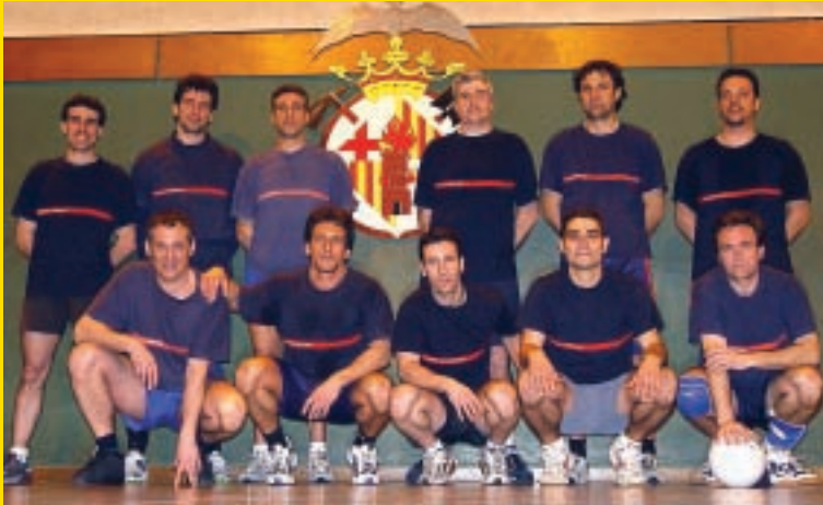
Imatge de l'equip que participarà als Jocs de Barcelona

L'equip de voleibol de Bombers es va crear al 1950. A la seva trajectòria mai no han faltat la il·lusió ni les victòries. El seu proper repte són els Jocs de Barcelona, on esperen fer un bon paper.