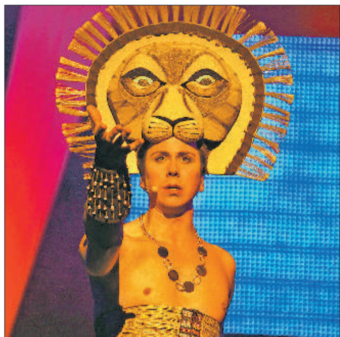
Die Atmosphäre des New Yorker Broadways oder des Londoner West Ends wird in der „Nacht der Musicals“ im Parktheater Iserlohn spürbar.

Iserlohn. Das neue Jahr hält viel bereit für aufmerksame Wochenkurier-Leserinnen und -Leser. Es wird nicht zaghaft gekleckert, sondern richtig geklotzt: Für gleich zwei atemberaubende Shows gibt es in dieser Woche Freikarten gewinnen.