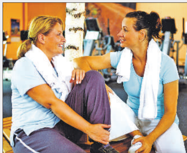
Bewegung tut in der kalten Jahreszeit gut - draußen, aber auch drinnen.

Iserlohn. In der dunklen und kälteren Jahreszeit ist selbst ein ansonsten aktiver Mensch schon mal eher dazu bereit, den inneren Schweinehund von der Kette zu lassen. Der hat dummerweise auch immer die passenden Ausreden parat, warum es gerade in dem jeweiligen Moment nicht so gut passt, sich zu bewegen. Oft sinkt die Motivation für ein Fitnessprogramm mit den Außentemperaturen. Außerdem fragen sich viele, ob Sport bei Kälte überhaupt gesund ist. Mediziner raten zu fortgesetzter Bewegung auch im Winter, weil dadurch das Immunsystem gestärkt wird. Letztlich beugt man so Erkältungen eher vor, als sie zu fördern. Und wem es draußen dann doch zu kühl für ein ausgedehntes Fitnessprogramm ist... - Fitnessstudios helfen den Trainierenden, die Gesundheit zu erhalten und Zivilisationserkrankungen die lange Nase zu zeigen. Wer sich partout draußen bewegen möchte, sollte es im wahrsten Sinne des Wortes