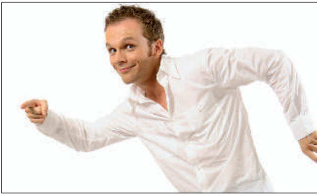
Ralf Schmitz ist „Aus dem Häuschen“.

Hemer. Ralf Schmitz ist mit seinem neuen Programm unterwegs. Nun kommt er auf Einladung der Märkischen Bank zum ersten Mal am Freitag, 29. April, um 20 Uhr nach Hemer ins Grohe-Forum. Der Top-Comedian ist die lebendig gewordenen Starkstrombatterie auf zwei Beinen. Seine Energie scheint grenzenlos, sein Akku schier unerschöpflich. In seinem neuen Bühnenprogramm nimmt Ralf uns mit auf eine herrlich rasante Odyssee rund um die aberwitzigen Irr-