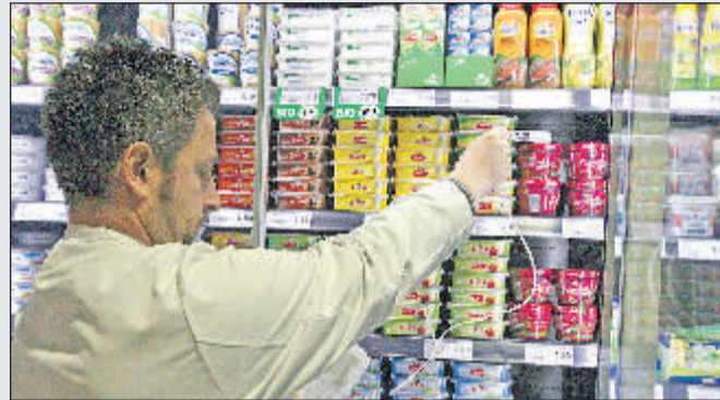
Darauf wird geachtet: Die Temperatur im Kühlregal muss stimmen.

Märkischer Kreis. (pmk) Die Lebensmittel verarbeitenden Betriebe im Märkischen Kreis achten auf die Hygiene und die gesetzlichen Vorschriften. Das geht aus der Jahresbilanz des Fachdienstes Verbraucherschutz/ Veterinärwesen hervor. Über mangelnde Beschäftigung konnten sich die Mitarbeiterinnen und Mitarbeiter des Fachdienstes im vergangenen Jahr nicht beklagen. Die Lebensmittelüberwacher kontrollierten insgesamt 2.184 Betriebe - von Großküchen, Supermärkten und Gaststätten bis zu Imbissen und Kiosken. 76 Mal wurden sie aufgrund von Hinweisen aus der Bevölkerung aktiv. Größere Mängel wurden nur in 56 Fällen (2,56 Prozent) festgestellt, die mit Verwarnungen oder Bußgeldern geahndet werden mussten. 1.740 Lebensmittelproben wurden entnommen und im Labor analysiert. Davon entsprachen 104 (5,97 Prozent) nicht den gesetzlichen Vorschriften. „Meistens handelte es sich dabei um Verstöße gegen die Kennzeichnungspflicht, das Mindesthaltbarkeitsdatum war überschritten oder bauliche Mängel in den Betrieben wurden beanstandet.