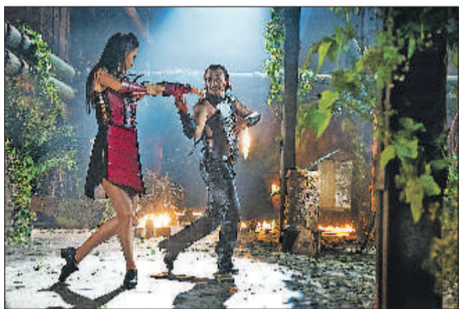
Beeindruckende Choreographien und kreative Kostüme vereinen sich in der „Night of the Dance“ zu einem fesselnden Bühnenfeuerwerk.

Ganz besonders Vergnügen dürfen die beiden Shows den Gewinnern der Wochenkurier-Freikarten bereiten. Zu gewinnen gibt es dreimal zwei Freikarten für die Nachmittagsvorstellung von „Night of the Dance“, am Samstag, 5. März, um 16 Uhr und für die „Nacht der Musicals“ am Donnerstag, 25. Februar, um 20 Uhr. Gewinnen kann man sie per Postkarte an den Wochenkurier, Karlstraße 2, 58636 Iserlohn, oder per E-Mail an redaktion.iserlohn@wochenkurier.de . In der Betreffzeile entweder „Nacht der Musicals“ oder „Night of the Dance“ angeben. Den eigenen Namen, Adresse und Telefonnummer nicht vergessen. Einsendeschluss ist am Mittwoch, 20. Januar, um 12 Uhr. Der Rechtsweg ist ausgeschlossen. Die Karten liegen an der Abendkasse bereit. Wer sie abholt, muss sich ausweisen können.