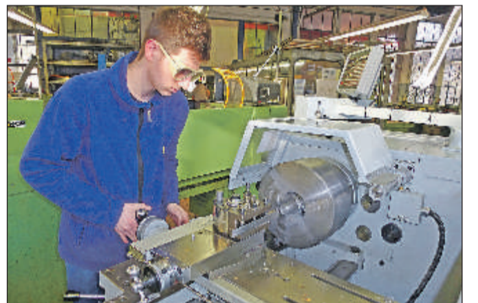
Die Schülerinnen und Schüler des Theodor-Reuter-Berufskollegs in Iserlohn geben am Samstag, 30. Januar, Einblicke in ihre Lern- und Arbeitswelt.

Iserlohn. „Ausbildung zum Anfassern“ bietet das Theodor-Reuter-Berufskolleg Iserlohn (TRBK) am Samstag, 30. Januar, ab 9 Uhr am Karnacksweg 43. Jugendliche können hier bis 14 Uhr erfahren und erproben, ob ein Beruf der Metall- oder Elektroindustrie für sie als Zukunftsperspektive genau das Richtige wäre. Angeboten werden Ausbildungen für junge Frauen und Männer zum Industriemechaniker, Mechatroniker, Elektroniker für Betriebstechnik sowie IT-System-Elektroniker. Über den Facharbeiterbrief hinaus besteht am TRBK je nach Eingangsvoraussetzung die Möglichkeit der Doppelqualifizierung bis hin zur Fachhochschulreife: „TRBK - doppelt gut“ - eine echte Alternative zur betrieblichen Ausbildung. Die Schülerinnen und Schüler des Kollegs freuen sich darauf, Gleichaltrigen ihren Beruf nahebringen und ihnen die modernen Labore, PC-Räume und Werkstätten zu zeigen. Gerne demonstrieren sie auch Projekte, die im Rahmen des fachpraktischen Unterrichts entstanden sind, und beantworten Fragen dazu. Gelegenheiten, an diesem Tag als Gast Erfahrungen in den Grundlagen der angebotenen Berufe zu sammeln, gibt es genügend. Bereitgehalten werden auch Informationen zum umfangreichen Fahrtenprogramm des Kollegs, zum differenzierten Förderkonzept sowie zum Schüleraustausch mit der südkoreanischen Partnerschule in Gwangju. Informationen finden sich im Internet unter www.trbk.de und werden gerne im Sekretariat des Kollegs unter 02371/9685-0 gegeben.