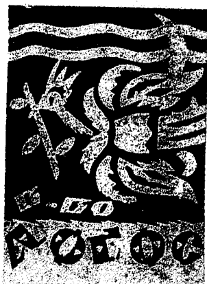
Книжкові знаки видавництва «Логос». Рис. Павла Ковжуна