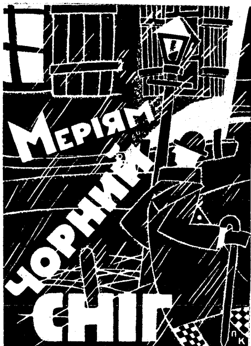
Обкладинка книжки нарисів Меріяма (Г. Лужницького) «Чорний сніг». 1928 р. Рис. Павла Ковжуна