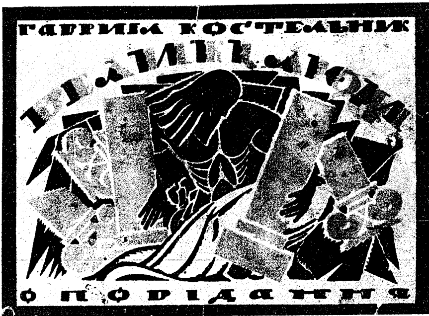
Обкладинка книжки оповідань Гавриїла Костельника «Великі люди». 1925 р. Рис. Павла Ковжуна.