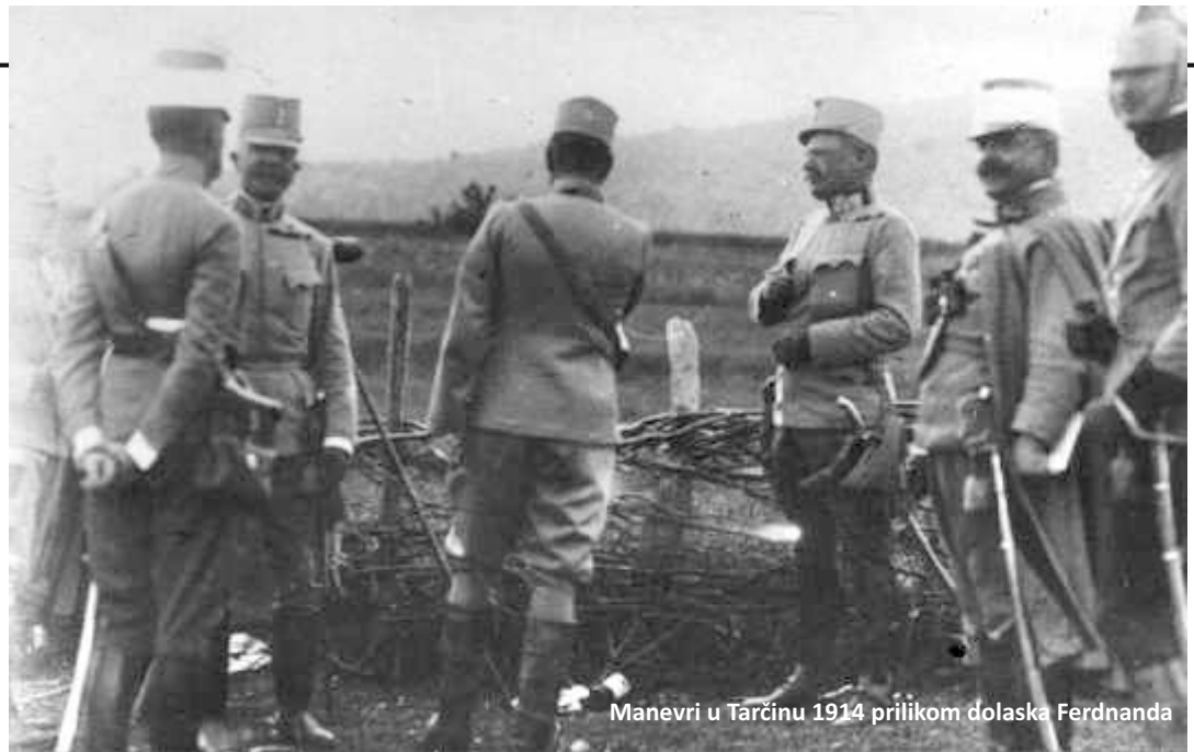
Manevri u Tarčinu 1914 prilikom dolaska Ferdnanda