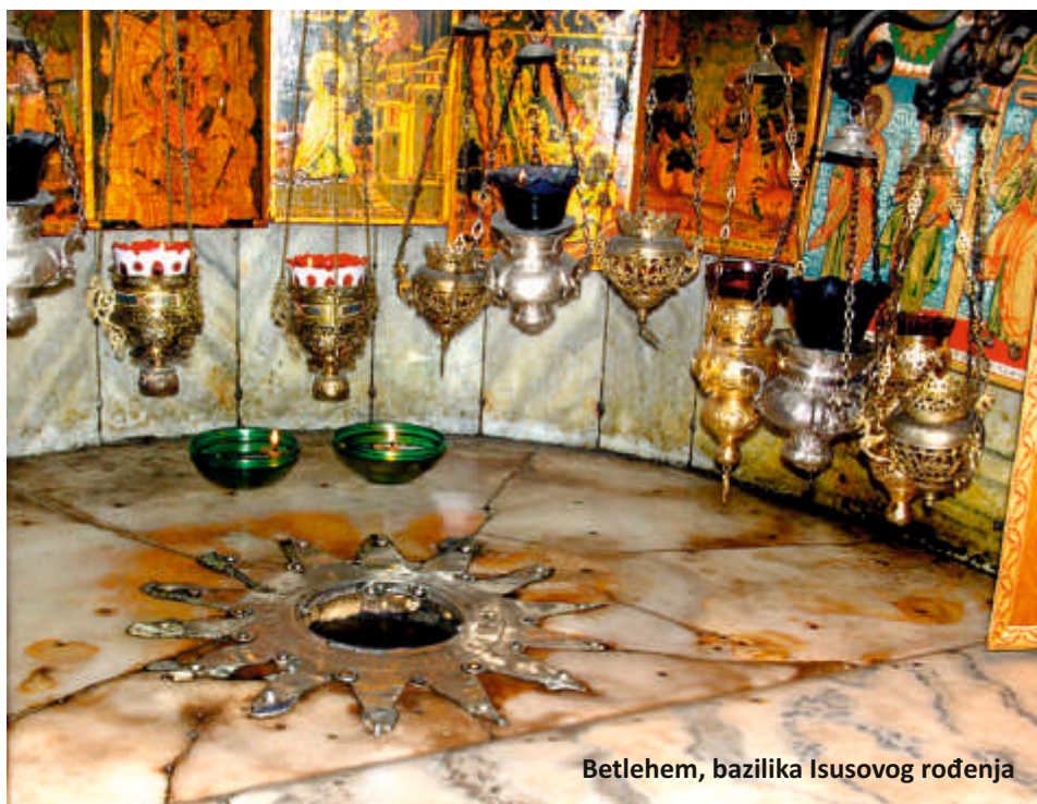
Betlehem, bazilika Isusovog rođenja

nju događaji Isusove muke. Pored Maslinske gore je židovsko groblje za koje židovi vjeruju da kada se napuni nastupa Sudnji dan. Mi smo donijeli zaključak da Sudnji dan neće biti još dugo jer je na tome groblju ostalo još dosta praznog prostora.