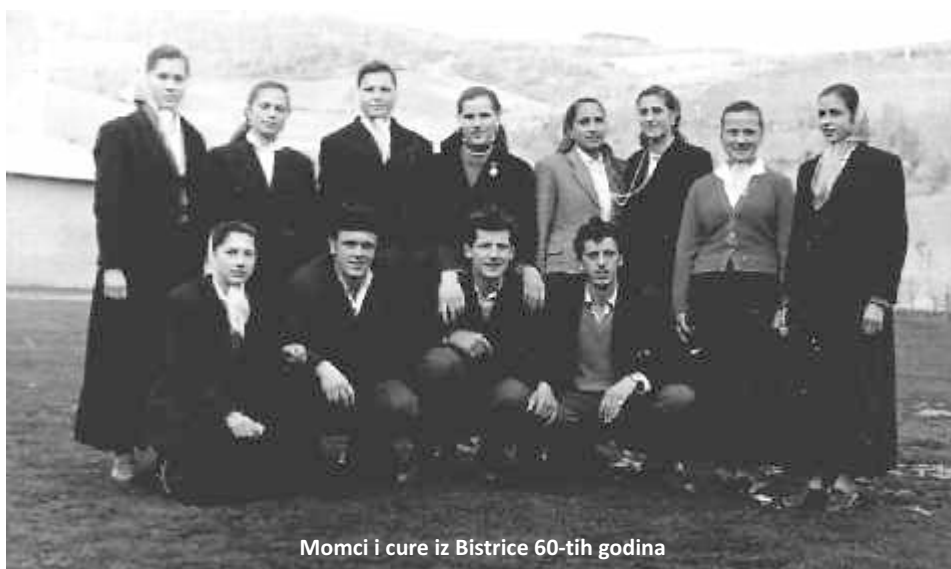
Momci i cure iz Bistrice 60-tih godina

Po izvještaju biskupa Delivića 1737. godine u Bistrici je živjelo šest katoličkih obitelji sa 40 članova. U svakom narednom popisu vidljiv je porast broja stanovnika; po popisu fra Marijana Bogdanovića, objavljenog 1771. godine, u osam obitelji bilo je 56 osoba, po shematizmu provincije Bosne Srebrene za 1856. godinu u 50 obitelji živjelo je 213 članova, 1885. godine 240 članova, 1932. – 169, a po zadnjem službenom popisu, 1991. godine u Bistrici je bilo 155 žitelja. Svi su bili Hrvati, osim troje koji su se izjašnjavali kao Jugoslaveni.