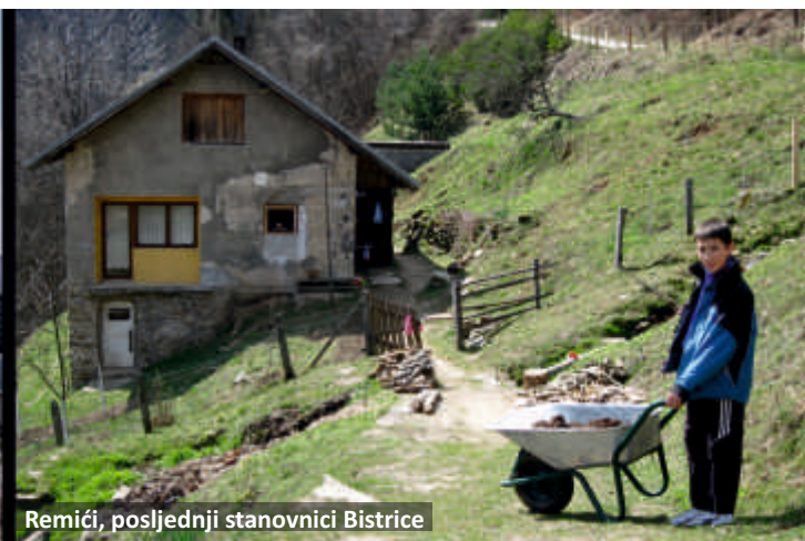
Remići, posljednji stanovnici Bistrice