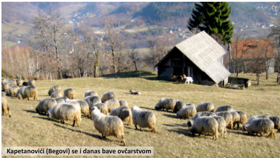
Kapetanovići (Begovi) se i danas bave ovčarstvom

Svaka kuća držala je mnogo stoke; goveda, konja, ovaca, svinja, koza... U kasno proljeće, oko Duhova, stoka se izgonila na Zec planinu, a silazila oko Velike Go-