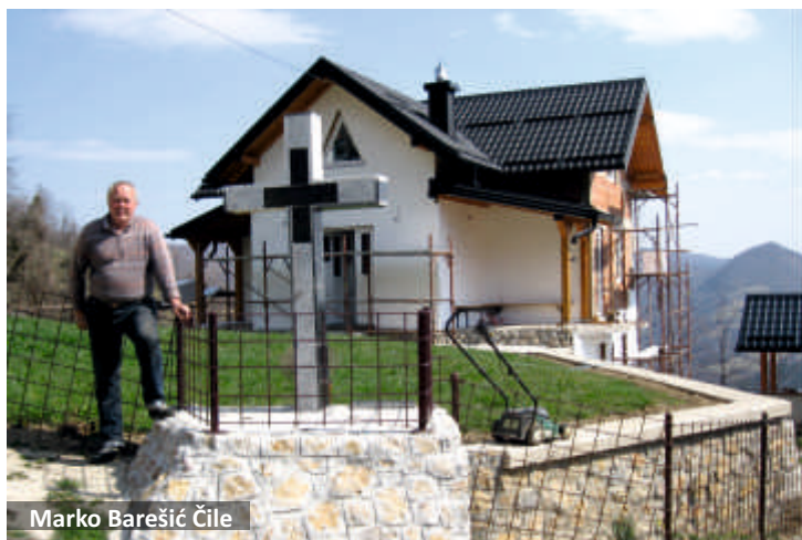
Marko Barešić Čile

Zadnjih godina glasno se govorilo o asfaltiranju dionice puta za vikend naselje na planini, upravo do Bistrice, što bi zasigurno dalo dodatni impuls oživljavanju sela, ali sagledavajući opće stanje u državi malo je vjerojatno da će do toga doći. I pored toga iluzorno bi bilo očekivati nekakav ozbiljniji povratak onih koji su se situirali na novim adresama i uživaju blagodati suvremenoga života pa pogled u budućnost Bistrice nije nimalo ohrabrujući. Povremeni dolasci pojedina, nakalemljena vočka, pokošena ili uzorana njiva među tolikim zapuštenim tužna je realnost koja ne može dozvati dičnu prošlost.