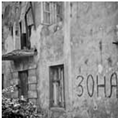
Тетяна ДРЕЄВА.