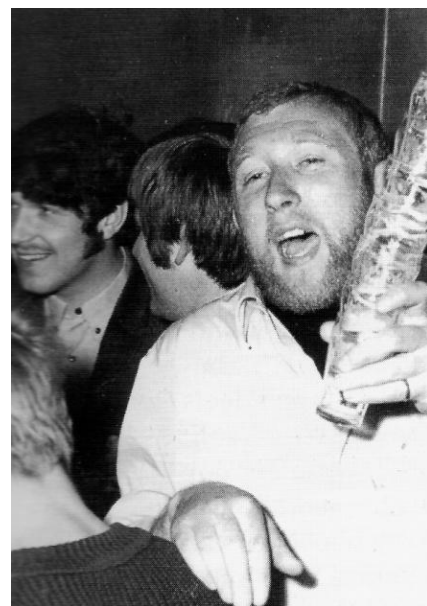
Afb 10: 'de Hors' aan het werk in Blue Star.

Sluisdijkstraat 88 was een voormalig winkelpand, met een gang tussen twee etalages in. In het begin moest je lid worden, anders mocht er geen bier gedronken worden. Horsman: '...nou dat was wat hoor, dat er bier werd gedronken...ingezonden brieven in de krant...maar we werden gedekt door mr Pot...ha, ha....dat wist niemand..'. Het was niet erg groot maar voorzag duidelijk in een behoefte voor de meer alternatieve jongeren.