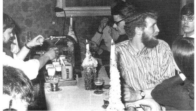
Afb 9: de Blue Star voorzag in een behoefte

ik zeker.....ja, het moet in 64 zijn geweest' ( Marinus Vermooten noemt in zijn uitgave "100 Jaar Amusement in Den Helder" een mogelijk exacte datum van 15 december 1961, GH).