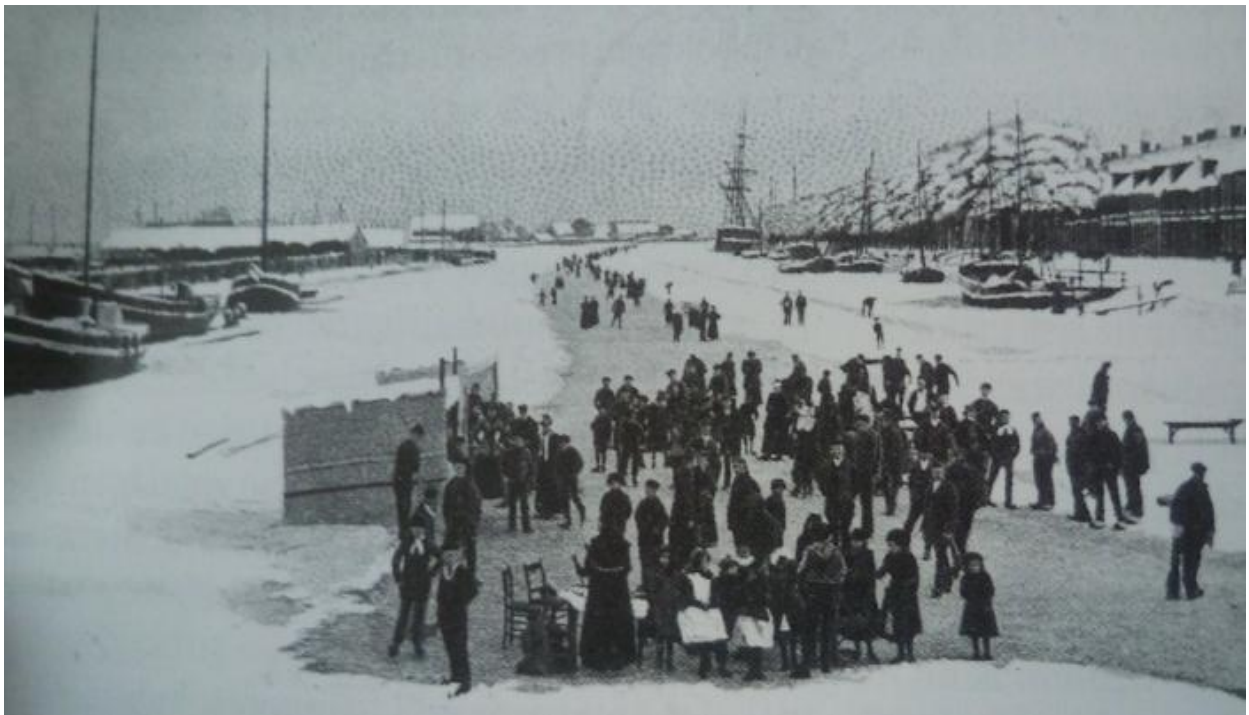
Afb 3: ouderwetse ijspret

Plezier voor de toeschouwers, en nut voor de arme schaatsers. Twee dagen later, op 5 februari, organiseert de vereniging 'Ontwaakt bij Tijds' eveneens een wedstrijd voor