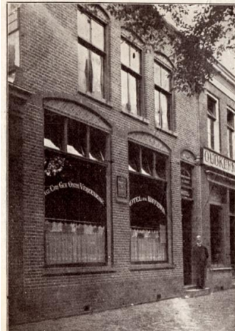
Afb. 4: 'geheelonthoudershotel' "de Blauwe Knoop" aan de Spoorgracht

ook als kind in huis waren en heus niet altijd vol vrome gedachten. Hier moesten wij in het portaal onze klompen uit doen, niet omdat ze