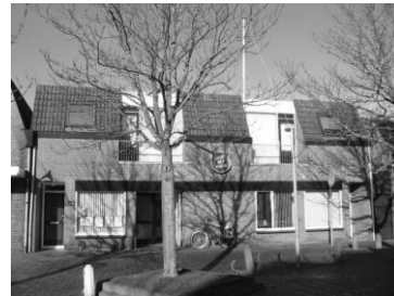
Afb. 5: huidig onderkomen van het Leger des Heils aan de Vismarkt in de vml Nutskleuterschool.

Langzaam komt in 1945 het korps weer op gang. Er volgt een tijdperk van nieuwe bloei. De zaal wordt zelfs te klein en naar achteren uitgebreid. Op 21 januari 1983 verliet men de Spoorgracht om onze nieuwe zaal aan de Vismarkt te betrekken.