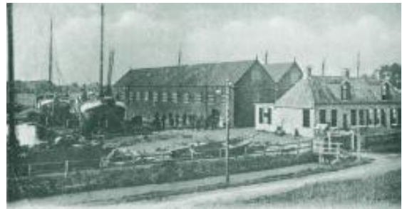
Afb. 2: scheepswerf de Boer in Lemmer