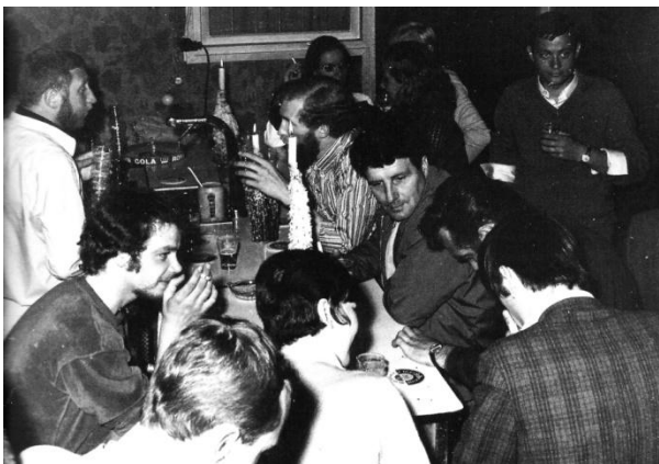
Afb 8: nog meergezelligheid in Blue Star

toen al een vrij groot jongerenprobleem, meer dan in andere steden. Ik denk dat dat ook kwam door de marine...veel vaders waren vaak weg.....en Pro Juventute wilde er wat aan doen'. Hiervoor werd een geschikt pand gevonden in de Sluisdijkstraat nummer 88, dat door de gemeente was aangekocht met het oog op de geplande sloop van de oude Sluisdijkbuurt. Ik kreeg 3000 gulden 'startgeld' voor de inrichting.