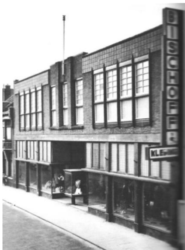
Afb 3: het statige pand van warenhuis van Willigen aan het begin van de Koningstraat

Overigens waren winkels in die tijd veel meer dan een plek om iets te kopen. In zo'n warenhuis betrad je een wereld met onbekende en vaak ook onbereikbare zaken. Zo had je in de Koningstraat het warenhuis van Willigen. Twee enorme etalages vol met vaak zeer begeerlijke spullen, die uitdagend waren uitgestald. Hoe vaak en hoe lang stond je als kind niet door de ramen te turen naar het prachtigste speelgoed. Ik herinner mij een aantal schitterende stoommachines en modelspoortreinen. Daar kon je als kind van monetair niet bijster goed bedeelde ouders slechts van dromen! Maar toch! Na een eeuwigheid van gedroom bij de etalage van kind niet maken in die dagen. Ik mocht er overigens niet alleen mee spelen, mijn pa van Willigen, kreeg ik dan toch een stoommachine.....veel gelukkiger kon je een vond dat veel te gevaarlijk met die brandbare vuurblokjes. Heel verstandig ouderschap natuurlijk, al was al snel duidelijk dat de magische stoommachine ook bij hem het kind naar boven bracht. Zo maar opeens, zo leek het was van Willigen verdwenen en achteraf is het makkelijk te constateren dat het leven desondanks gewoon door is gegaan. Misschien biedt dat enige hoop als je denkt aan de enorme leegte die V&D nalaat. Filosofisch gesteld: alles is vergankelijk,