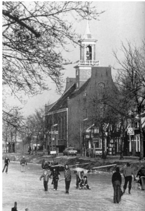
Afb 2: schaatspret op de Loodsgracht