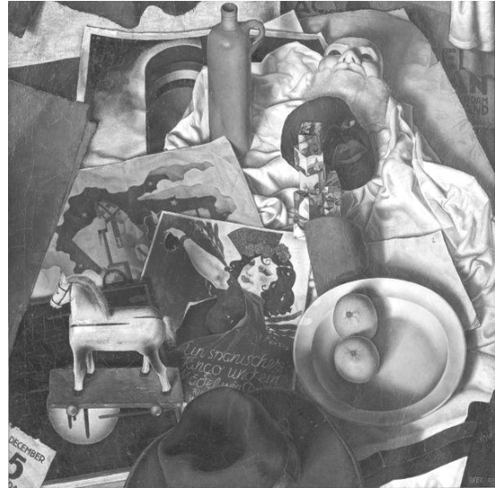
Afb 4: Sint Nicolaasstilleven 1937 (Arnhems Gemeentemuseum)

Hij was ook beïnvloed door het kubisme van die tijd, hoewel hij zeker niet tot die stroming behoorde. Zijn lichamelijke beperking en geringe mobiliteit waren bepalend voor zijn werk: veel zelfportretten en stilleven met vaak dezelfde attributen uit het ouderlijk huis. De geranium, de jeneverkruik en vooral het