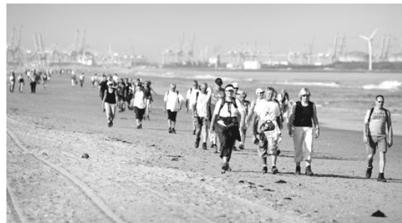
Afb 12: strand6daagse onderweg.