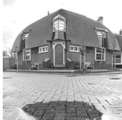
Afb. 3: Paddestoelhuis, Huisduinen

Kijkduinlaan, waarvan er nog maar enkele in Huisduinen staan. Frans vertelt dat hun huis een ontwerp is van Maarten Koning, een architect die zich sterk maakt voor het in ere houden van Noord-Hollands erfgoed, zoals de typisch West-Friese stolpboerderij.