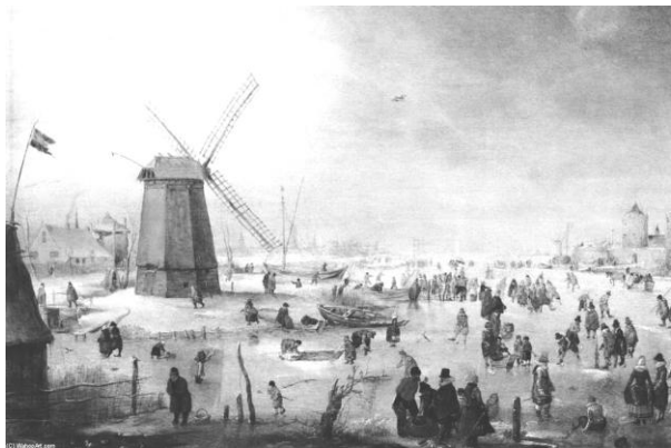
Afb 1: ouderwetse winter

Buiten dwarrelen enkele verdwaalde sneeuwvlokken neer. Zoals heel vaak maakt Koning Winter een dreigend gebaar. Daar blijft het bij. Ook begin 2016 gaat de winter, afgezien van wat nachtvorst, aan Den Helder voorbij. In het noordoosten van het land vriest het strenger, en er valt veel sneeuw. Verandert het klimaat echt? Warmterecord na warmterecord wordt verpulverd, en stortbuien doen tropisch aan. Het weer verandert, en wij ook.