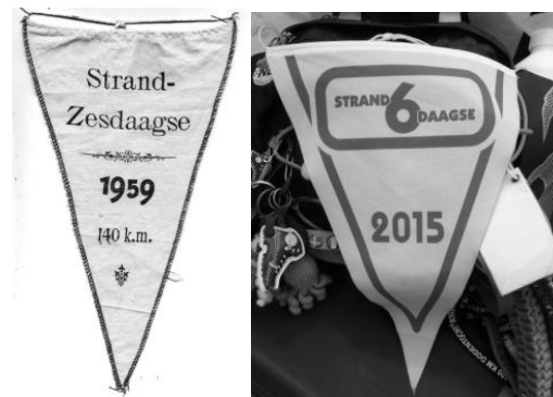
Afb 13: Het eerste en voorlopig laatste vaantje.

gelijk aan een budget van vele tonnen aan stadspromotie'. Over het geheim van het succes van de strandzesdaagse laat van Exter zijn niet geringe verbeelding los: '.....vele elementen van terug naar de natuur.....gedrenkt in vitale romantiek en een avontuurlijke losbandigheid, met van tijd tot tijd veel drank...'