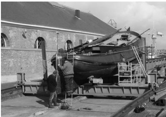
Afb. 1: LE 74 't Kan Verkeren op de helling op Willemsoord.

Den Helder en de visserij horen bij elkaar. Zo bestond de Helderse zeevisvloot in 1900 uit 34 botters, 13 schokkers, 16 blazers, 4 kotters, 8 schuiten, 1 stoomblazer, 1 jacht en 135 vletten. De opbrengst van de visafslag bedroeg in dat jaar 379.444,35 gulden. Ter vergelijking: in 1975 was de jaaromzet ruim 54 miljoen gulden. Na eerst op een aantal andere plekken gehuisvest te zijn (o.a. de Vismarkt), nam de gemeente in 1891 een afslaggebouw op de dijk aan de Buitenhaven in gebruik. In 1906 werden een hulpafslag en schuilplaats bij ongunstig weer gesticht nabij het Wierhoofd. Dit gebeurde op verzoek van de vissers en de handelaren en het werd voornamelijk gebruikt voor de verkoop van de haringvangst. Deze haring werd aangevoerd door de zogenaamde haringtrekkers, die elk voorjaar met behulp van trek- of drijfnetten aan het strand en de zandbanken bij Huisduinen en Texel deze vis vingen. Haring, ansjovis en geep zwommen namelijk via het Marsdiep de Zuiderzee in om kuit te schieten. De aanleg van de Afsluitdijk in 1932 maakte hier echter een einde aan.