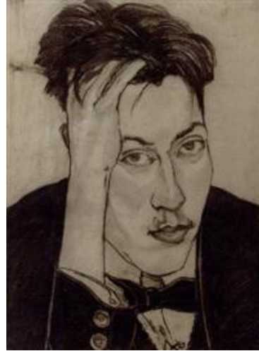
Afb 2: zelfportret pentekening; 1925