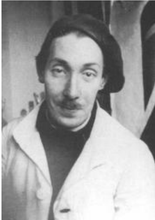
Afb1: Dick Ket, kunstschilder 1902-1940