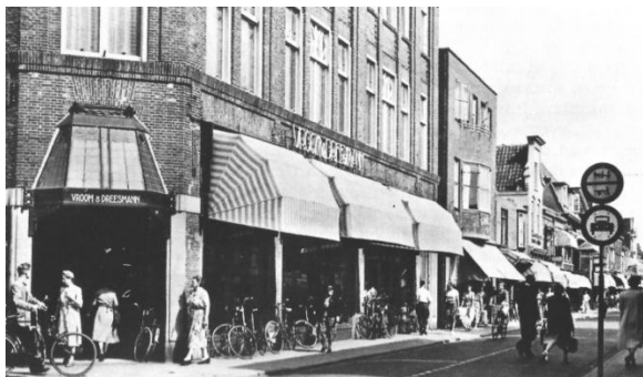
Afb 1: de oude vestiging van V&D met de ingang op de hoek van de Spoorstraat/Keizerstraat: met lift!