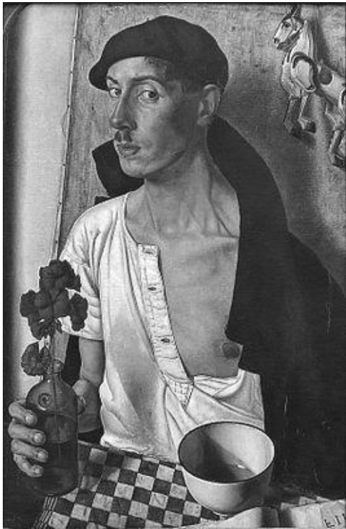
Afb 3: zelfportret 1932 met geranium en 't kommetje

Ket begon als kunstenaar in een impressionistische stijl met het schilderen van landschappen en stilleven met karakteristieke brede penseelstreken en het gebruik van het paletmes. Later ging hij steeds meer over op een nieuw-realistische en zelfs magisch-realistische stijl, die in zijn beste werk tot uiting komt. Hij was steeds meer met grote precisie gaan schilderen en streefde naar een perfectionistische weergave van de werkelijkheid.