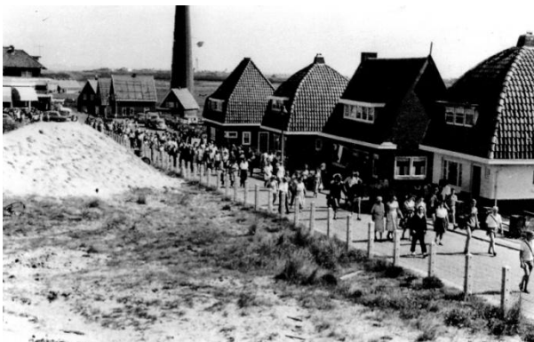
Afb 1: de 1 e strandzesdaagse in 1959; 37 deelnemers vertrekken uit Huisduinen