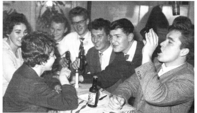
Afb 5: vrolijkheid in Ruimte met prik

soos in de Oostslootstraat, geïnspireerd door een bezoek aan Parijs. Horsman: 'het was een