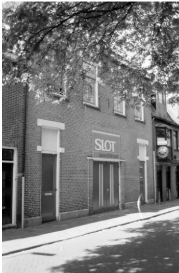
Afb. 2: het pand van het Leger de Heils aan de Spoorgracht

het uitgaansleven, bioscoop, bars en dansgelegenheden. Dit was dus voor het Leger een plaats bij uitstek om 'de strijd te leveren'.