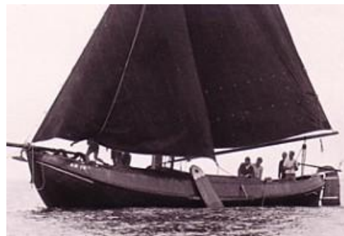
Afb. 4: LE74, t' Kan Verkeren, in volle glorie onderzeil.

Konings traditionele ontwerp viel precies in de smaak. "Wij zijn namelijk niet zo van ultramodern en strak." Binnenshuis is bijna alles afkomstig van een bedrijf van oude bouw-materialen, bijna alles heeft een verhaal. Frans is ook een liefhebber van klassieke muziek en dan in het bijzonder klassieke dwarsfluit muziek. Hij hoop nu ook tijd te kunnen vrijmaken voor een 2 e passie, het bespelen van de dwarsfluit. In het verleden zat hij in diverse ensembles, maar zijn huisartsen praktijk in Groningen en zijn gezin slokte veel tijd op en de dwarsfluit werd steeds minder gebruikt en bleef zodoende steeds meer in de kast liggen.