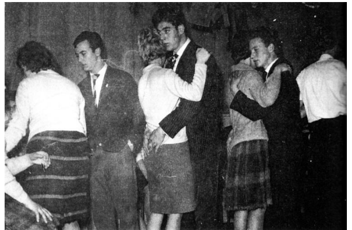
Afb 6: oei, oei! nog meer scharrebakken: verheffing in Ruimte.....

beetje in de sfeer van de Franse zangeres Juliette Greco met visnetten, druipkaarsen, Gauloise sigaretten.....en er werd eigenlijk alleen maar geluisterd naar jazzplaten...' Aan het begin van het nieuwe decennium ging gelijk met de sloop van het oude schoolgebouw ook Ruimte ter ziele evenals het alternatieve modernistencafé.