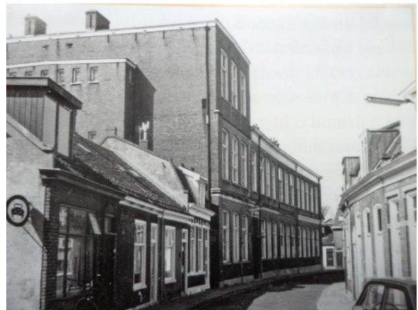
Afb 3: de Comeniuschool hier gezien vanuit de Vlamingsstraat