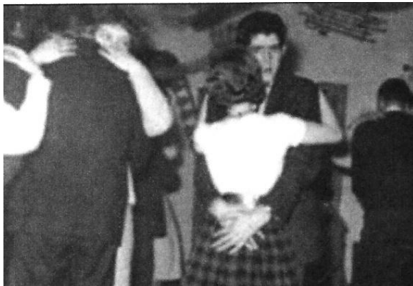
Afb 4: foei! scharrebakken in jeugdsoos Ruimte: Sodom & Gomorra!

foto in de Helderse Courant. ook de landelijke pers kreeg er lucht van. De foto sprak boekdelen: hier werden de goede zeden op forse wijze geschonden! Jongens en meisjes dansten tegen elkaar aan in stevige omstrengeling, al gauw in de volksmond 'scharrebakken' genoemd: oei oei, 'Sodom en Gomorra!'. In de gemeenteraad werden vragen gesteld; moest er niet worden ingegrepen? Een delegatie van Ruimte toog naar het stadhuis om te overleggen met burgemeester Rehorst. Dank zij de steun van mevrouw Stoorvogel van de jeugd- en zedenpolitie mochten de activiteiten echter worden voortgezet.