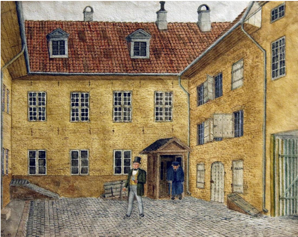
Fra 1814 gjennom hele 1800-tallet holdt Finansdepartementet til i Generalitetsgården i Dronningensgate 15 (en del av kvadraturen). Akvarellen er malt av finansminister Henrik Helliesen i 1893. Helliesen ble utnevnt i 1863 og var finansminister i 20 år. Han var en ivrig maler, og dokumenterte blant annet livet i departementet og etatene i sine malerier.

Det var altså bare 6 måneder mellom tidspunktet da budsjettet ble lagt frem for Stortinget, til vedtaket om å innføre en ny pengeenhet i landet. Wedel Jarlsberg fikk det som han ville.