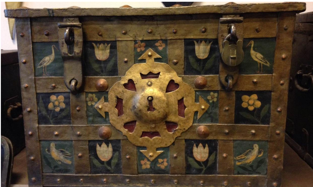
Tollkiste fra 1700-tallet. Tollmuseet

For en skattebetaler av i dag kan det virke forunderlig at den viktigste inntektskilden er toll og konsumpsjon. Men slik hadde det vært i mer enn hundre år, og slik fortsatte det å være i mange tiår etter 1815. De vakre, forseggjorte og mektige tollbodene i byer som Arendal, Risør, Kragerø, Kristiansund og andre byer forteller om hvilken mektig institusjon tollbodene var, og hvilke pengesamlere de var for staten. Hver måned ble tollkursen kunngjort i byene, ledsaget av trommevirvler. En blomstrende utenrikshandel i tiden før 1807 hadde gjort tollene svært innteksbringende, og man håpet selvsagt at fredsperioden som nå tok til, skulle få utenrikshandelen til å blomstre opp, og innlede en ny gullalder for tolletaten.