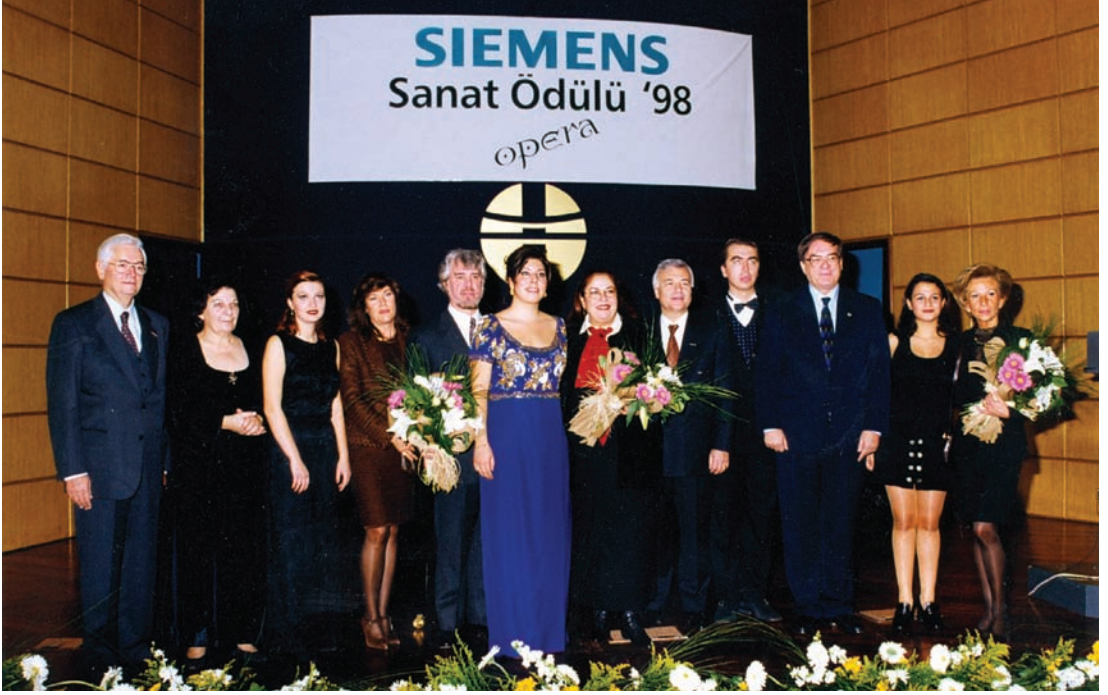
1998 yılı dereceye girenleri ve Siemens yöneticileri bir arada

rışmaya katılmaya karar verdim. Açıkçası benim için çok büyük bir fırsattı, bizim içinde bulunduğumuz opera kariyerinde maalesef bazen imkânlarınızı kendiniz yaratmak zorunda kalabiliyorsunuz. O yüzden her fırsat gibi bu fırsatı da en iyi şekilde değerlendirmeniz şart. Yarışma sırasında hiç duymadığım, tatmadığım bir heyecan vardı. Yarışmaya iyi hazırlanmıştım ve sahnede olduğum zaman içinde o anı en iyi şekilde değerlendirmem lazımdı. Bunun bilinciyle sahneye çıktım ve elimden gelenin de en güzelini ortaya koymaya çalıştım. Yarışma sonuçları açıklanacağı zaman da çok heyecanlanmıştım ve birincilik beklemiyordum. İsmim birinci olarak sevgili sahne hocam Yekta Kara tarafından anons edilince ne yapacağımı bilemedim ve sevinçten gözyaşlarımı tutamadım.”