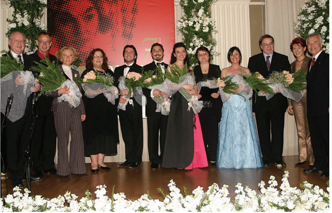
2005 yılı kazananları, jüri üyeleri ve Siemens yetkilileri bir arada