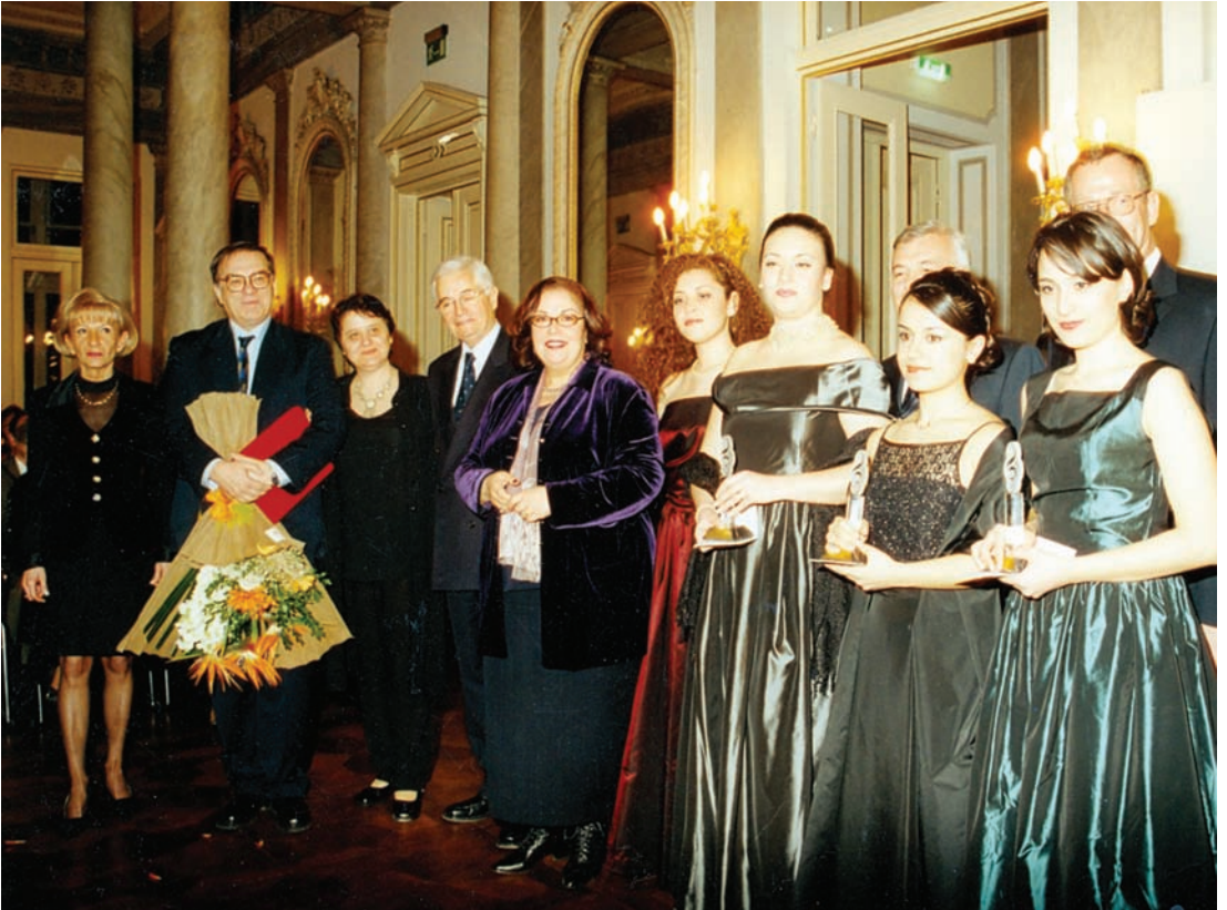
2001 yılına damgasını vuran kadın sesler, Siemens yöneticileri ile birlikteler