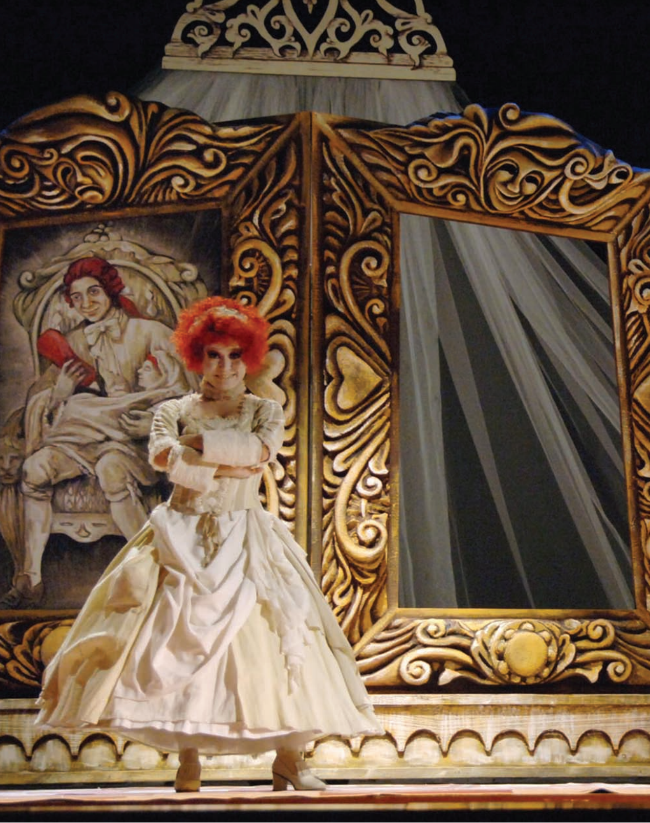
İstanbul Devlet Operası'nda sergilenen Pergolesi'nin Hanım Olan Hizmetçi operasından bir sahne