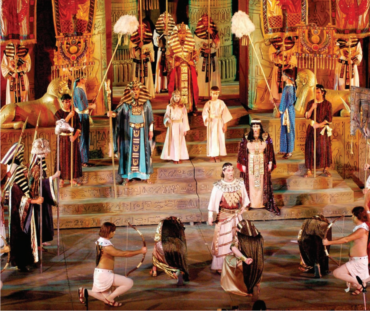
Ankara Devlet Opera ve Balesi'nde sahnelenen Aida operasından bir sahne...

uzun olmayan tarihinde neredeyse ortalama her on yılda bir yeni bir kentte kurulmuştu; Ankara'da başlayan serüven, İstanbul ve İzmir'den sonra Mersin ve Antalya'ya da uzadı. Şu anda Türk operası tam beş ayrı kentte seyirci karşısına çıkıyor. Samsun Operası ise 2009 yılından itibaren temsiller vermeye başlıyor. Kadrolu opera sanatçılarımızın, koristlerimizin sayısı giderek artıyor. Devletin bu aralıksız desteği sayesinde bir opera temsili seyretme bedelinin 100 - 150 avroya yaklaştığı Batı'daki önemli opera merkezlerinden farklı olarak Türkiye'de çok düşük bilet fiyatları ödenerek, bu dev kadrolu prodüksiyonlar izlenebiliyor. Repertuar olarak ise 70 yıla yakın gelişim süreci içinde büyük değişiklikler oldu. Ankara Halkevi'nde 1940'ta Mozart'ın Bastien ve Bastienne operası temsili-