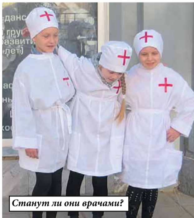
Станут ли они врачами?

Заявлено, что особым законодательным актом впервые установлены меры социальной поддержки, в частности, по обеспечению полноценным питанием беременных женщин, кормящих матерей, а также детей в возрасте до трех лет. В прошлом году на эти цели областью было выделено 87 миллионов рублей, на нынешний год запланировано выделить почти вдвое больше. Очень хорошо! Но оторопь берет, когда знакомишься с этой обеспечиваемой категорией людей! Кто они, эти люди?