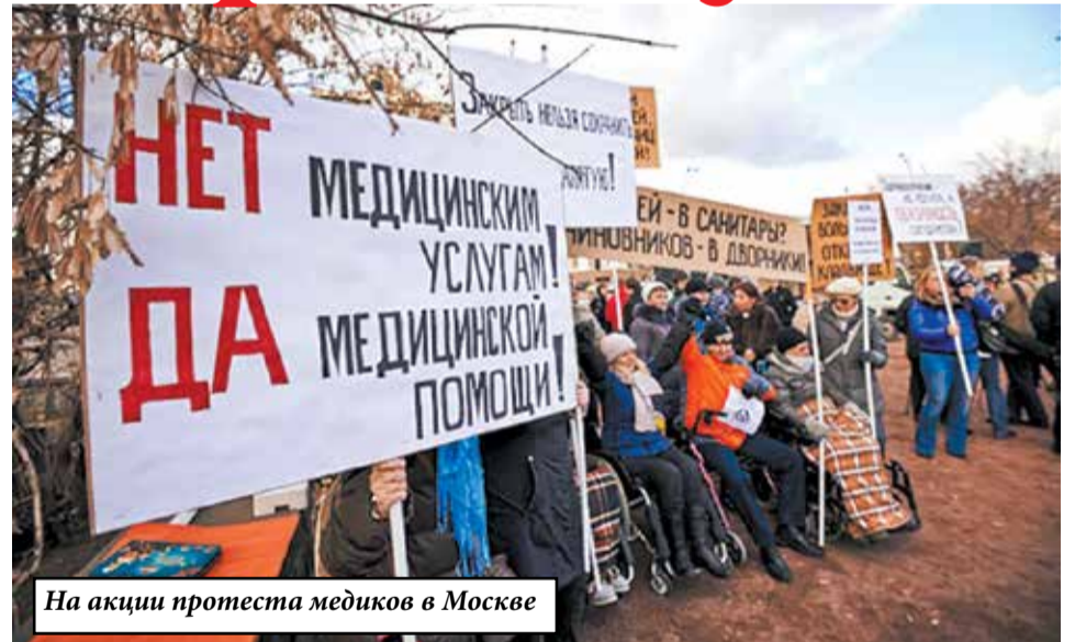
На акции протеста медиков в Москве

2 ноября медработники Москвы провели крупнейшую за последние годы акцию против закрытия больниц и массовых сокращений их сотрудников. Митинг поддержали независимые профсоюзы, либеральные партии и КПРФ.