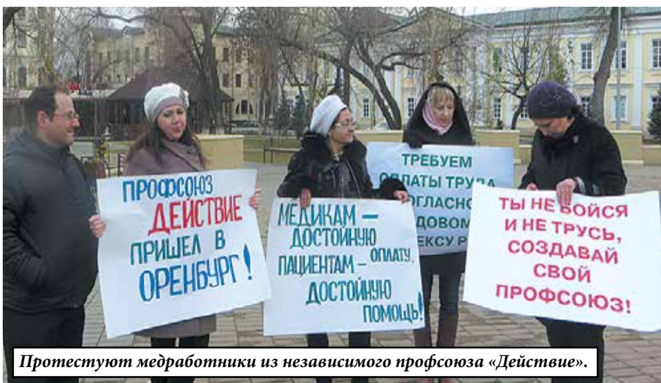
Протестуют медработники из независимого профсоюза «Действие».

Количество медицинских чиновников и обслуживающего их аппарата выросло до немыслимых величин. Идиотские планы по заболеваемости, стандартизации, штрафные санкции в отношении лечебных учреждений довели ситуацию в российском здравоохранении до полного абсурда.