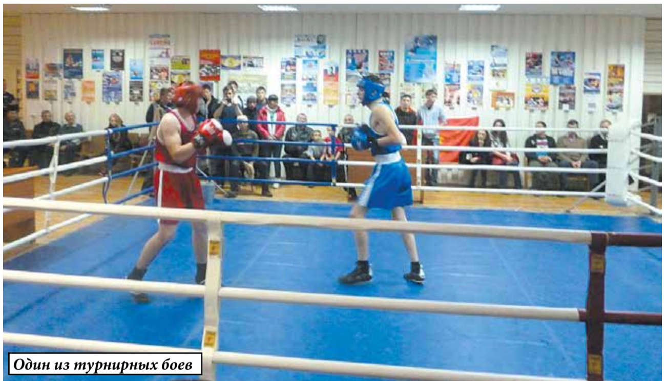
Один из турнирных боев