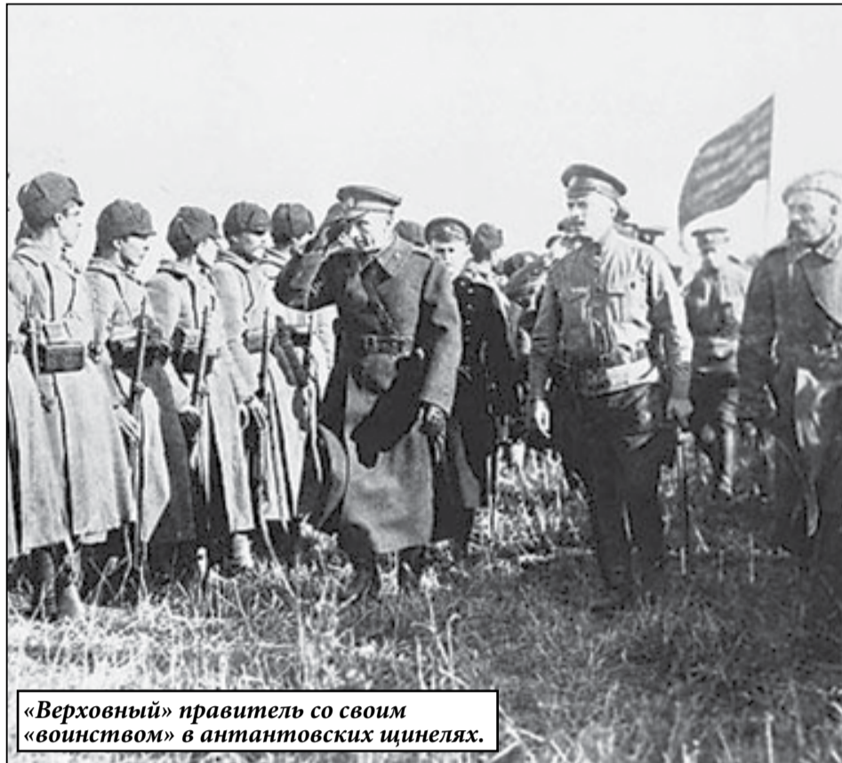
«Верховный» правитель со своим «воинством» в антантовских щинелях.