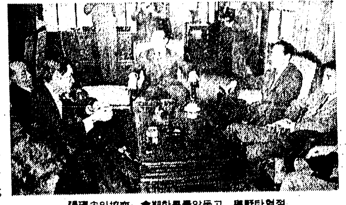
【서울 8일 특파원 리태원 기자 특보】 8일 오후 4시 30분 국방부에서 열린 정세회의에서 "국방부에서 8일 오후 4시 30분 국방부에서 열린 정세회의에서"