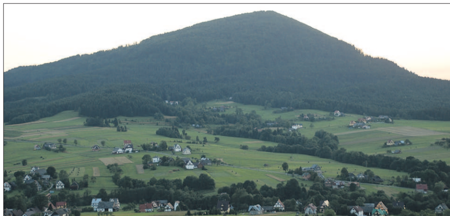
Kasina widziana z wyciągu na Śnieżnicę

Opiekunem medialnym „Odkrywania Beskidu Wyspowego” jest „Dziennik Polski”. (DMA)