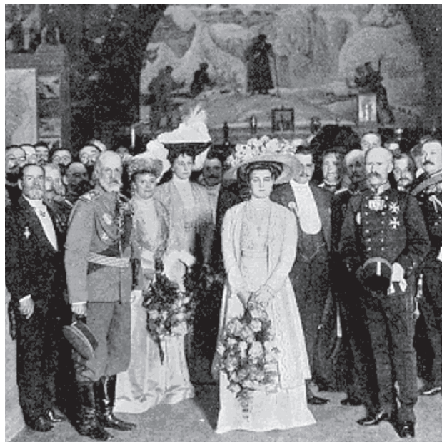
Великая княгиня Мария Павловна, герцогиня Зюдерманландская, во главе выставочного комитета

Анализ состава организационного комитета Русско-шведской выставки дает нам возможность предположить, что проведение выставки имело важное значение в межгосударственных спортивных, культурных и политических отношениях.