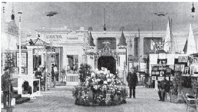
Русско-шведская выставка физического развития и спорта, открытая 16 августа в г. С.-Петербург

ды и спортивно-гимнастических принадлежностей, кинематограф. Таким образом, мы можем предположить, что Русско-шведская выставка выполняла не только спортивно-оздоровительные функции, но также и просветительские, социально-культурные и экономические.