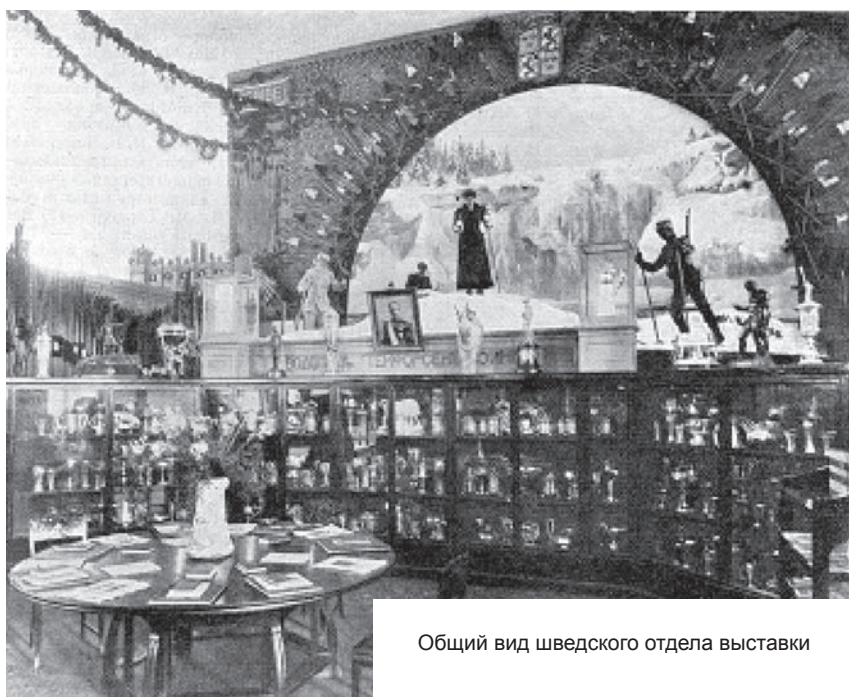
Общий вид шведского отдела выставки

В конце сентября проходили выступления средних учебных заведений, в которых приняли участие семь заведений. Каждому участнику был выделен отдельный день для того, чтобы продемонстрировать навыки маршировки, вольных движений и упражнений на аппаратах. Выступления средних учебных заведений завершились общим гимнастическим вечером, на котором присутствовали: министр народного просвещения, руководители учебных заведений, попечитель Санкт-Петербургского учебного округа, большое количество педагогов, общественных и спортивных деятелей. Таким образом, мы можем предположить, что проблемы здорового способа жизни и физического развития молодежи были актуальными вопросами общественности, которыми инте-