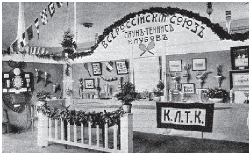
Отдел всероссийского союза лаун-теннис клубов

общество любителей бега на коньках», созданное в 1877 году и «Кружок любителей лыжного спорта «Полярная звезда», существующее с 1897 года.