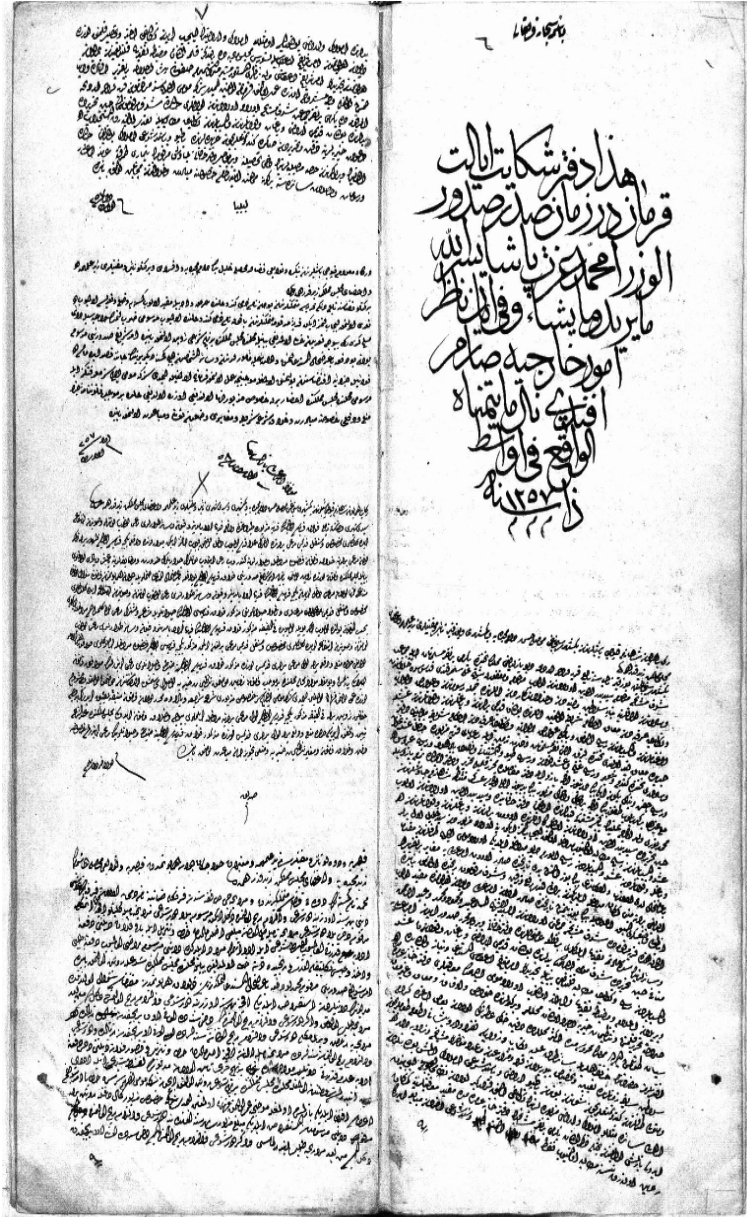
Belge 4: Şeyh Bedrettin Evladının Serbestiyetine Dair Hüküm 38