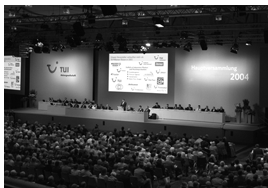
Reunió ordinària de tots els accionistes d'una societat

Les juntes generals podran ser ordinàries o extraordinàries i hauran de ser convocades pels administradors de la societat.