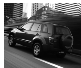
El rènting de cotxes creix a un ritme de l'11% anual.

L'actiu és el conjunt de béns i drets propietat de l'empresa.