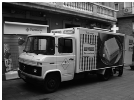
Els autònoms del sector del transport, que tenen la majoria de característiques dels TRADE, podran comunicar a les seves empreses la situació particular en què es troben.

Els acords d'interès professionals signats entre les associacions d'autònoms i els clients són semblants als convenis col·lectius, ja que contindran els mínims que s'haurà de respectar en la teva contractació, però amb una gran diferència, l'acord no s'aplicarà si no ets afiliat a l'associació signat. o el teu client no el va signar