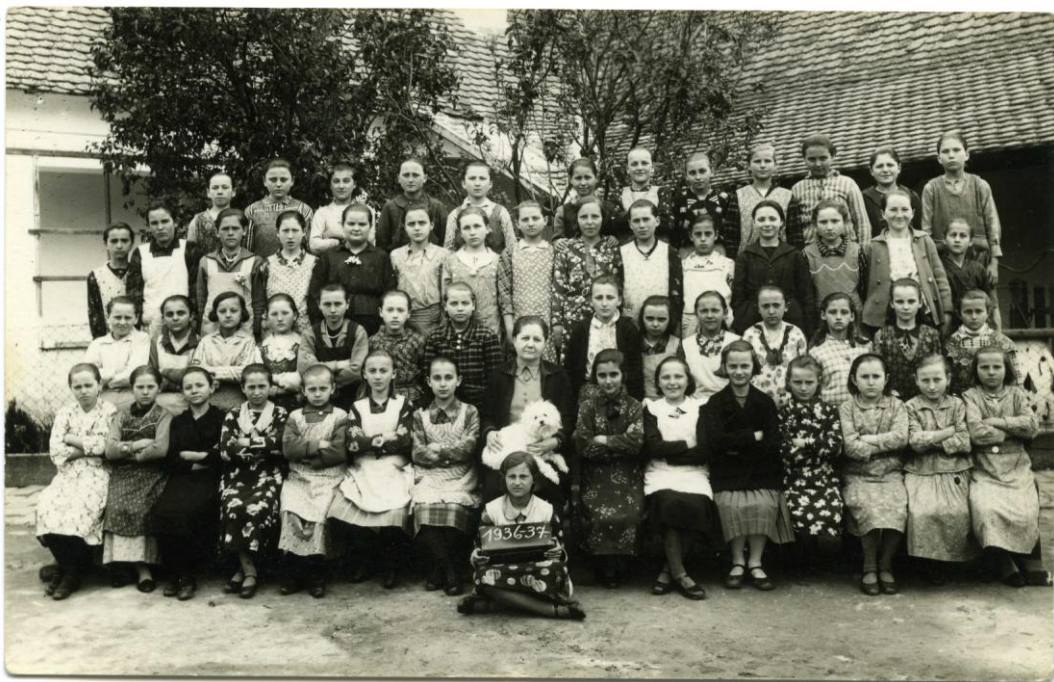
1. ábra Leányosztály az 1936-37-es tanévben a Mezőhegyesi úti iskola udvarán

A gyermekek, főleg a leányok, Szent Mihály nap körül, a fiúk, különösen a nagyobbak, csak október végén, egyesek csak újév körül kerültek az iskolába. A tanév szeptember elején kezdődött, a nyári vizsgákat május végén, a későbbi években június elején tartották. Az iskolai mulasztások leggyakoribb okai a temetések, lakodalmak, disznótorok, a mezei munkák; télen meg a nagy sarak, hóesések, különösen a tanyákról bejáró gyermekeknél. A nagy tanulói létszámok mérséklésére az ev. egyház a község felső végén, 1884. évben új iskolát emelt. 1890-ben pedig, a Mezőhegyesi út mellett fekvő üres telken felépült a kilencedik (az ún. alsóvégi) iskola.