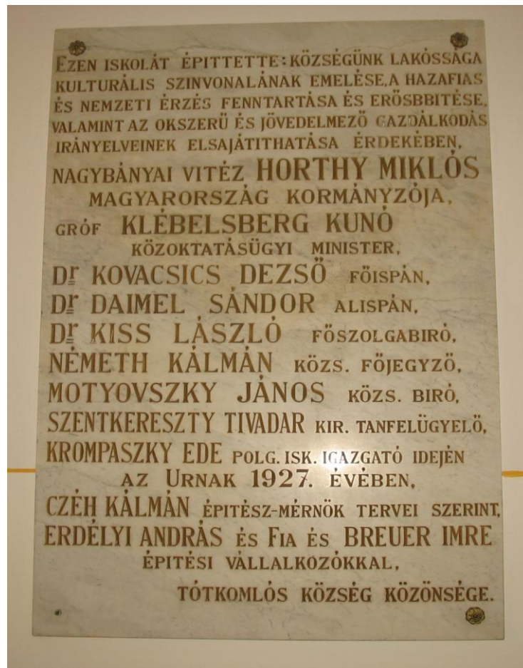
3. ábra A régi iskolaépület bejáratát díszíti ez az emléktábla

Az iskola megalapításával a Komlóiak régi álma teljesült: a község középszintű tanintézetet kapott. A képviselő-testület az iskola részére 35 kat. hold területű szántóföldet mintagazdaság céljára azzal a szándékkal ajánlott fel, hogy a polgári iskolánál alkalmazandó mezőgazdasági szaktanerő útmutatása mellett a polgári iskola tanulói, valamint a község kiscgazda közönsége az okszerű gazdálkodás alapelveit olyan területű gazdaságban sajátíthassák el, amely az itteni átlagos gazdasági állapotnak megfelel.