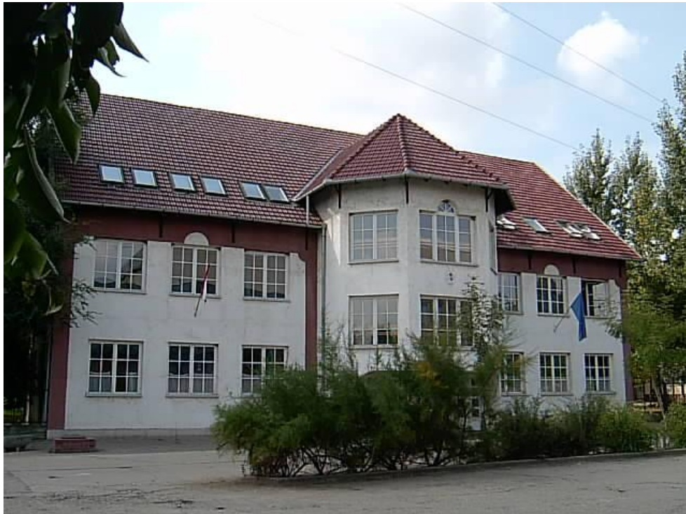
7. ábra Az új épület

A gimnázium 18 éves fennállása és újraalapítása nagyban hozzájárult Tótkomlós és környéke kulturális életének gazdagításához. Remélhetőleg a továbbiakban is sok helybeli és vidéki tanuló számára biztosít majd továbbtanulási lehetőséget.