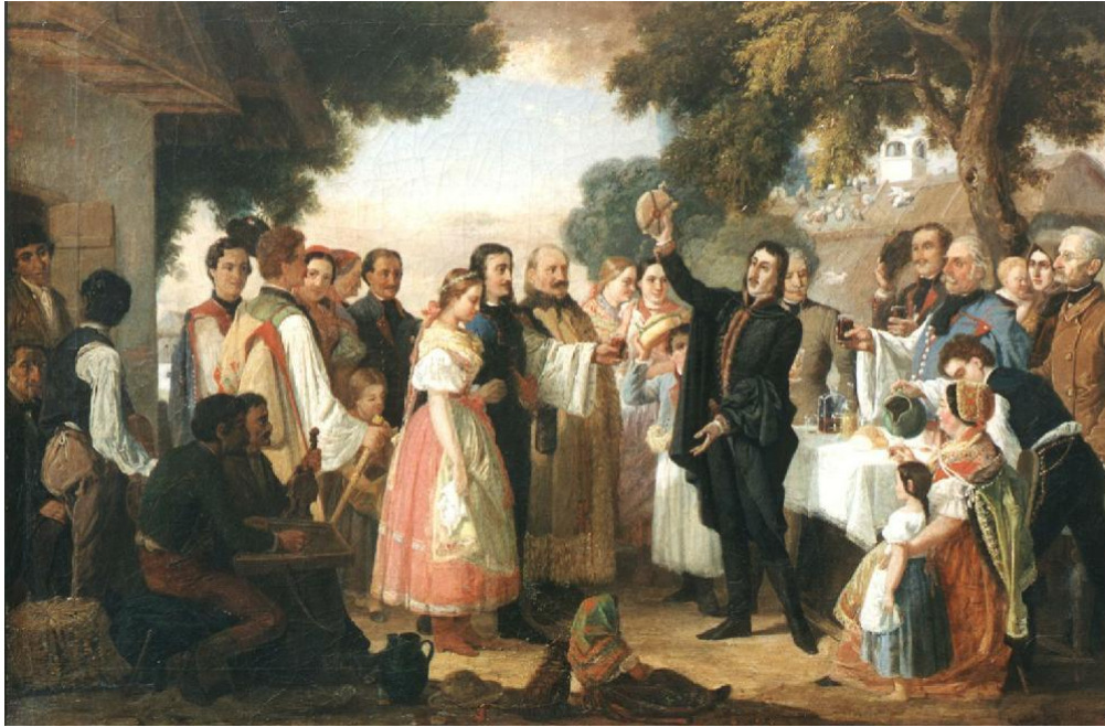
Jankó János: Csokonai a lakodalomban