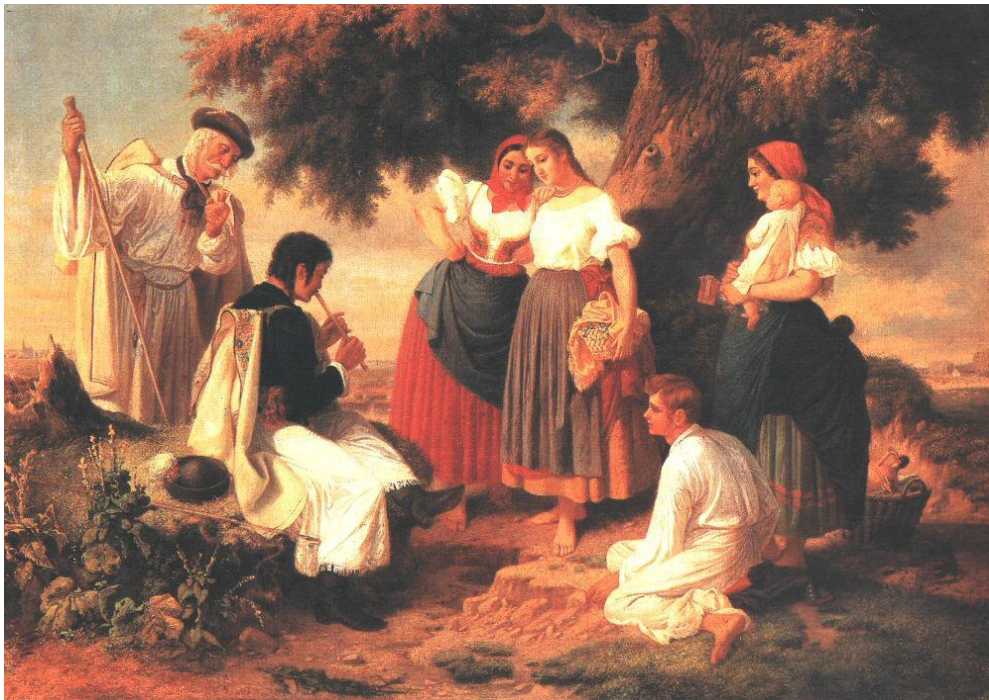
Jankó János: A népdal születése

A karikatürisztikus rajz műfajának magyarországi megteremtője és a romantikus zsáner képviselője 1833-ban Tótkomlóson született. 1845-től a szarvasi gimnázium tanulója volt. 1855-től a fővárosban letelepedve Marastoni Jakab festőiskoláját látogatta. Első életképeit a Barabás által meghonosított magyar népies életkép és a bécsi Rahl művészi dekorativizmusának hatása alatt festette.