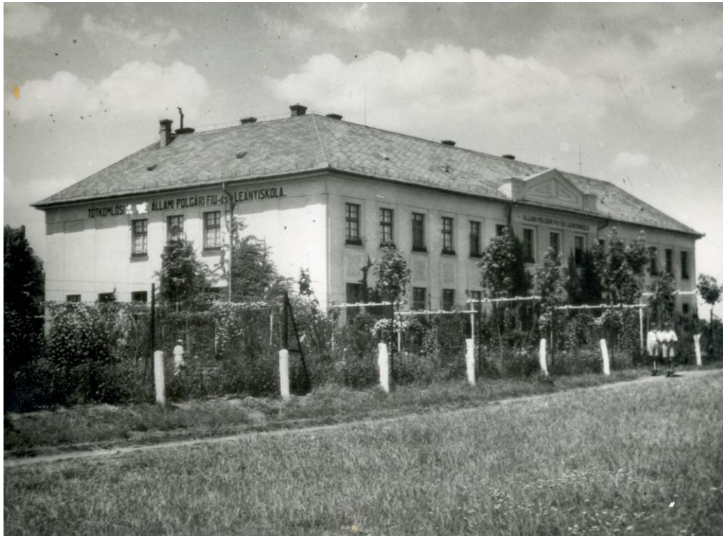
5. ábra Az egykori Polgári Iskola épülete

Az iskola épülete Czéh Kálmán építész tervei szerint 10899 m 2 -es alapterületű telken épült fel. A beépített rész 996 m 2 .