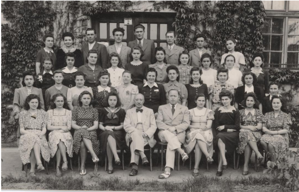
4. ábra Az egykori Polgári Fiú- és Leányiskola végzős osztálya a 30-as évek végéről

országos szintet, de a magatartásban, a fegyelemben azt felül is múlta. Tótkomlós községnek minden joga meglesz ahhoz, hogy iskolánkra büszke legyen.