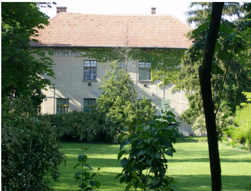
6. ábra Az egykori Polgári Iskola épülete

1945 őszén a polgári iskolában már általános iskolai oktatás kezdődött, osztályai a következő években fokozatosan felváltották a polgári iskolai osztályokat. 1948-ban az utolsó osztállyal a polgári iskolai oktatás megszűnt.