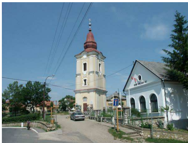
Aggtelek 18. századi, református barokk harangtornya