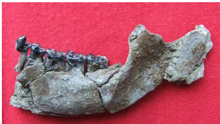
Anapithecus, alsó állkapocs