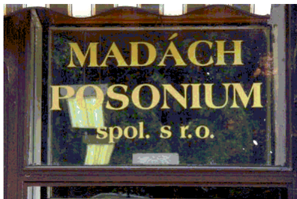
Ez a felirat már a múlté