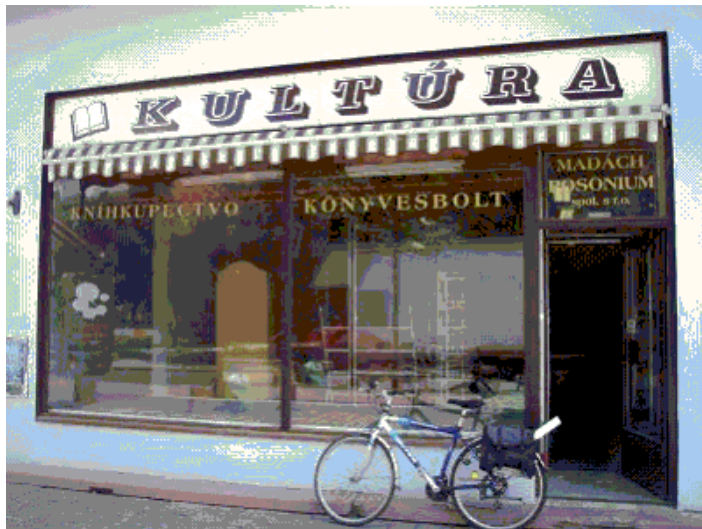
A megszűnt üzlet

A kassai magyar könyvüzlet nemcsak egy bolt volt a sok közül, hanem intézmény a szó nemes értelmében. 1952 óta működött folyamatosan ugyanazon a helyen, a Fő u. 17 alatt.