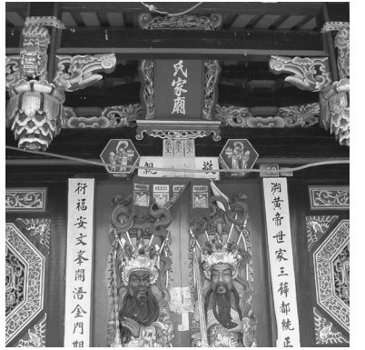
写真7 珠江の薛家の家廟。毎年12月に一族の祭りが行われる。

です。中国では、華南方面では姓氏、家廟等々が発達したけれども、文化大革命でかなりの破壊を受けました。このように考えれば、伝統的な中国的なるものそのものが残っている空間は、もはや金門しかないということになります。そして、単姓村がしっかりと残っていて、その宗族のネットワークを通じ海外に雄飛する。ある意味で海外移民パターンとしては典型的であったはずの形式が金門ではずつと存続していました。このような形で村落と海外とのネットワークが残されていることは今ではきわめて珍しいのではないかと、このような視点を強調しておられました。貴志 このネットワークの問題は、ディシプリンとしての地域研究の問題に関わるように思います。私たちは、これ