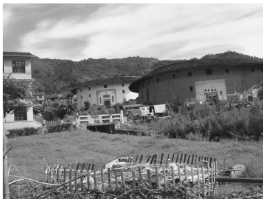
写真1 福建省永定県の客家の土楼。2008年、世界遺産に指定された。

れますね。私も同じような印象を持ちました。私は、この数年間、福建、広東の沿岸部の、いわゆる華僑を生み出している僑郷を歩くようにしています。世界遺産になった福建の土楼や広東の碉楼などを見てみると、建物にしても何にしても、ある程度金門と共通性を見出せます。もちろん、中華人民共和国の統治している空間と、中華民国が一〇〇年にわたって統治している金門が同じとはいいません。ただ、ある時期まではかなり似た、つまり移民を送り出す地域としての共通性があるのだと感じました。ただ、話を聞いていくと、金門は僑郷にしては科挙官僚を多く輩出したという特徴を持ちます。金門出身の官僚が台湾に赴任することも多く、台湾に対しては優位性、優越性を感じ