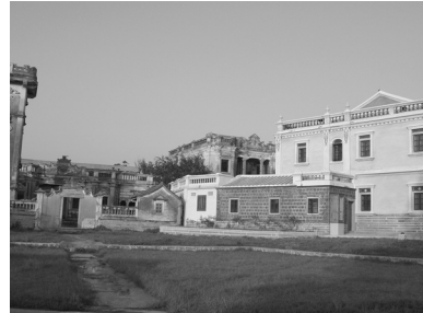
写真2 金門西部の水頭の僑郷の風景。洋楼が多く残されている。

う中で、それぞれが出先地といいますが、ネットワークにつながる移民先を持っています。金門島は孤立した小さな島ではなくて、それがハブ的な拠点として広がりを持つ地域を形成している点に関心がありますね。