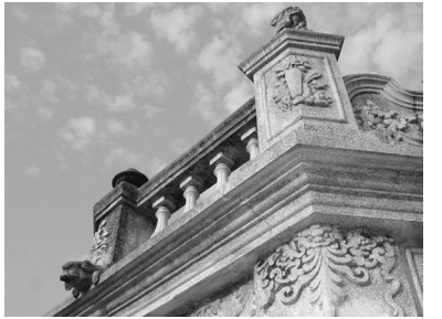
写真4 金門の建築物の、見晴らし台になっている最上階部分。様式や意匠には、移民先からの影響が見てとれる。

完全に戻ることもあれば、また移民先に戻ることもありま す。この往來の激しさが、彼らのネットワークの広がり につながっていると感じました。