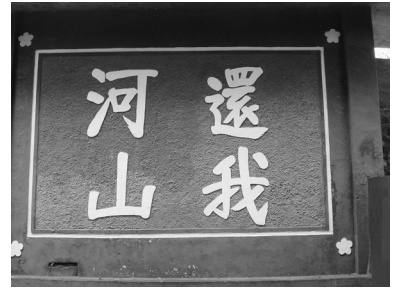
写真5 金門島の各地には現在でもさまざまな戦時のスローガンが残されている。「還我河山」は中国奪還を求める内容。

一九四五年で過去と未来が切れるという歴史観は修正を迫られるのではないかと思いますし、そういった日本の姿も金門を通じて描き出される面があるのだと思います。