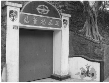
写真6 金門島から中国に対しては拡声器による宣伝が行われた。写真は馬山播音站。

この映画を通じて、日本人は初めて冷戦の最前線に金門島があることを実感したのだと思うんですね。ただし、日本