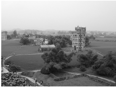
写真3 広東省開平県の碉樓のある風景。2007年、世界遺産に加えられた。僑滙で建てられた高層の碉樓が目立つ。

川島 おっしゃるとおりですね。そこで考えることは、上海のような近代と、金門島において展開した華僑送金（僑滙）に基づく、海外のコロニアルモダンの影響を受けた近代が全然違うということですね。おそらく中国政府や中国の地方政府が進めた近代もあるのでしょうか、それぞれ異なるのです。金門では、華僑がドネーションで学校をつくり、また衛生建設などをしたわけです。そういうモダン